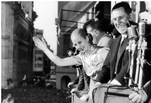
Evita y Juan Domingo Perón desde el balcón de la Casa Rosada. Año no exacto: entre 1945-1946. 10

A continuación vamos a adjuntar imágenes relevantes del objeto de investigación