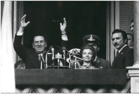
Perón e Isabelita en el balcón de la casa Rosada en 1973. Fórmula Perón-Perón. 13