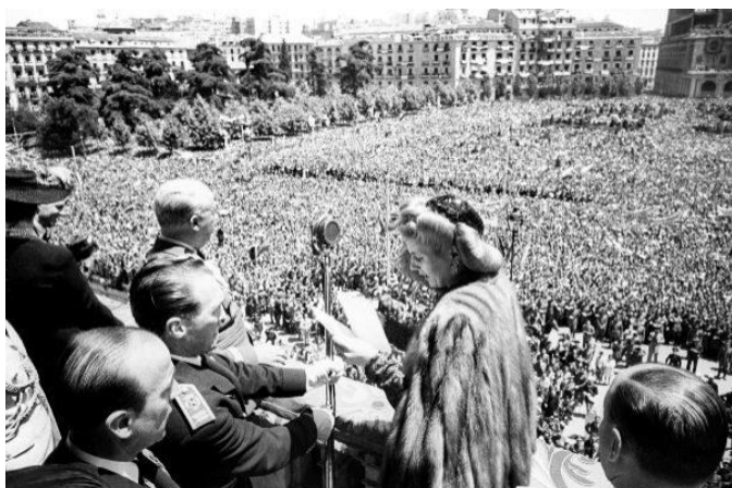
Evita dando un discurso desde un balcón del palacio real, 1947. 12