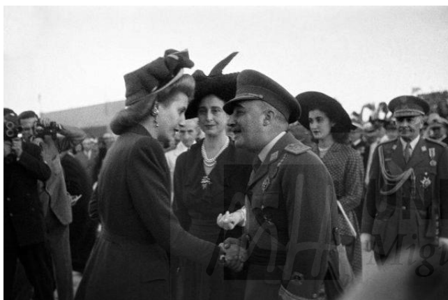
Eva Perón en su visita a Madrid (España) con Franco en 1947. 11