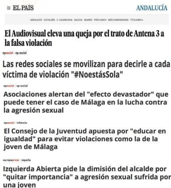
Figura 2. Recopilación de los titulares publicados en relación al caso de 'la Corta'.