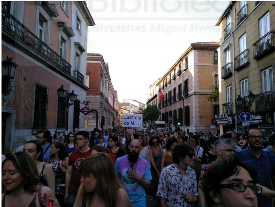
Manifestación convocada en Madrid para protestar contra la sentencia de ‘La Manada’.