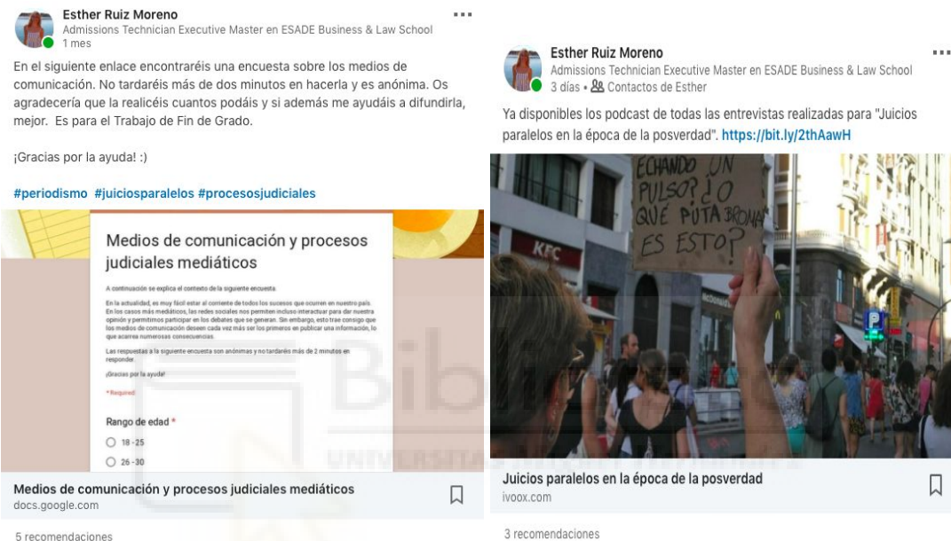
Publicaciones del reportaje en LinkedIn.

➤ LinkedIn: esta plataforma ha sido seleccionada por el público objetivo al que va dirigida. Se trata de una red profesional, donde la mayoría de los contactos han sido agregados por motivos laborales. En esta red se dio a conocer la encuesta y los audios de las entrevistas realizadas, los cuales tuvieron una buena bienvenida entre los contactos agregados. En las publicaciones se utilizó un lenguaje más profesional.