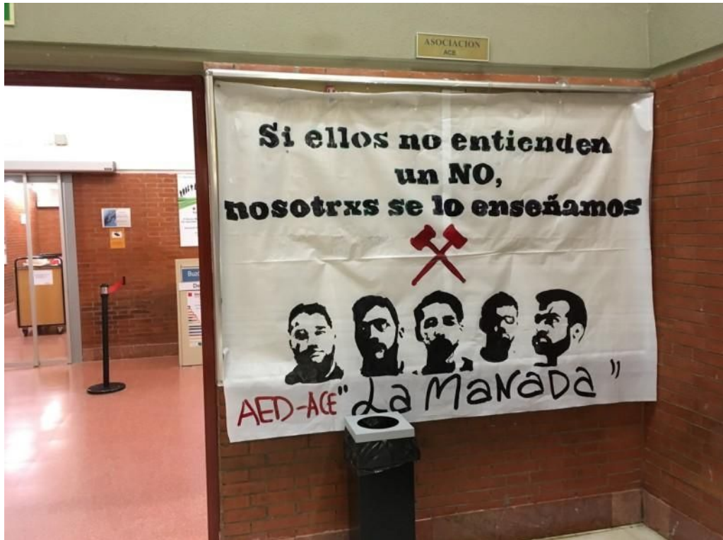
Carteles colgados en la Universidad Autónoma de Madrid en protesta por el caso de 'La Manada'.