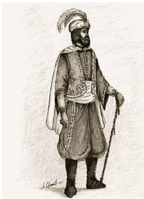
Imatge superior: Un dels dissenys "a la antigua" llogat l'any 1858 per a les festes d'Alcoi.