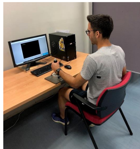
Figura 2. Colocación de los sujetos para la realización de la tarea.