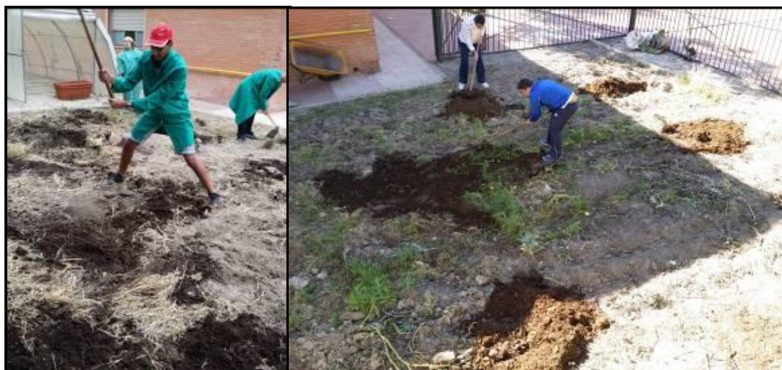
Imagen 8: Alumnos del centro aportando y extendiendo el estiércol en la parcela

Una vez cosechadas las habas, los restos se los llevamos al ganadero que nos facilitó anteriormente el estiércol y aprovechamos para traernos un poco más, una pequeña parte la dejamos en el suelo para usarla como abono verde. Comenzamos nuevamente con la preparación del terreno, empleando un motocultor para triturar bien los restos y mezclarlos de manera más uniforme, con esto da comienzo la “Huerta de Verano”, principalmente solanáceas y cucurbitáceas.