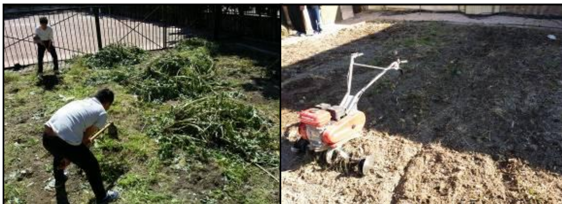
Imagen 9: Eliminación de los restos de cosecha y triturado posterior