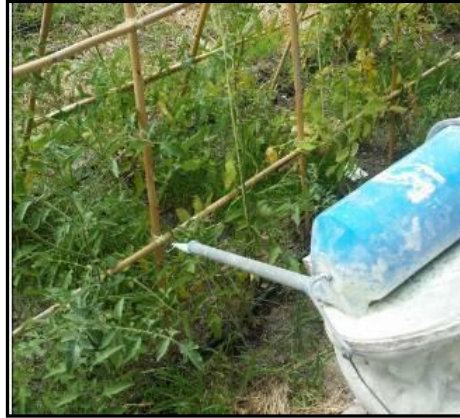
Imagen 3: Espolvoreador empleado para aplicar el azufre

Destacar que se observaron insectos beneficiosos también durante el desarrollo del Huerto como fueron las abejas polinizadoras, las mariquitas y las criposas, que actúan depredando plagas del género Aphis entre otras además de los trips anteriormente mencionados (Carballo M. y Guharay F., 2004).