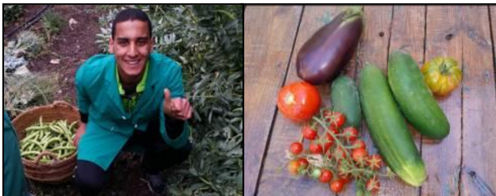
Imagen 16: Algunos de los alimentos cosechados. Fuente: elaboración propia