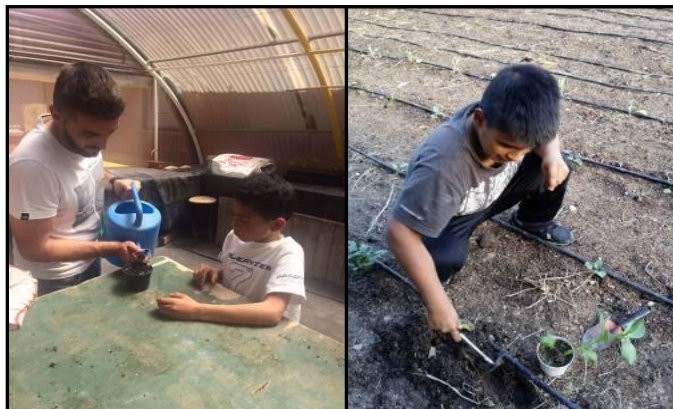
Imagen 19: Alumnos de primaria sembrando una planta que posteriormente trasplantarán al huerto.