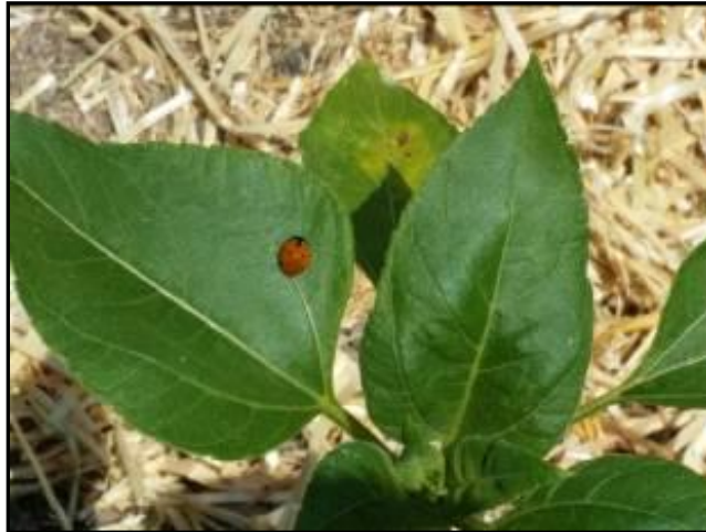
Imagen 19: Mariquita ( Coccinella bipunctata ) en una planta de girasol del Huerto.