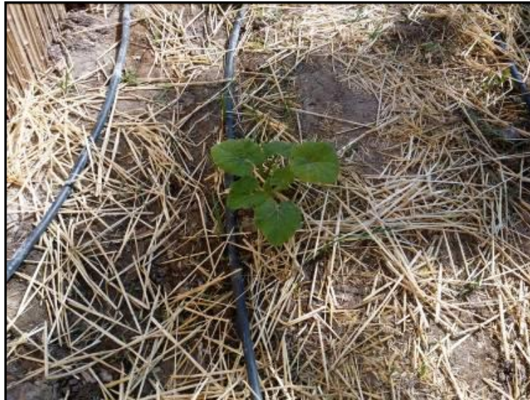
Imagen 15: Acolchado de paja alrededor de una planta de calabaza.

Como inconvenientes a la hora de elegir utilizar un acolchado tenemos el precio, el viento, el fuego o los roedores.