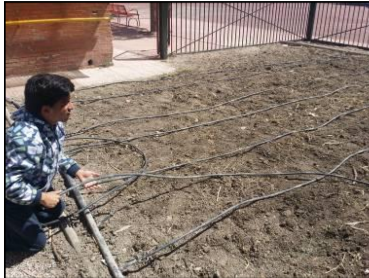
Imagen 12: Un alumno colocando las tuberías para el riego

A la hora de programar los riegos, se ha tenido en cuenta que el exceso de agua puede crear problemas de plagas y enfermedades, mientras que las carencias hídricas suponen una merma en el desarrollo vegetal y torna las plantas duras y con tendencia a espigarse o montar en flor (Bueno 2010), procurando regar en primavera y verano a la puesta o salida del sol. En otoño e invierno se riega en las horas centrales del día, para evitar que el agua no absorbida se hiele durante la noche.