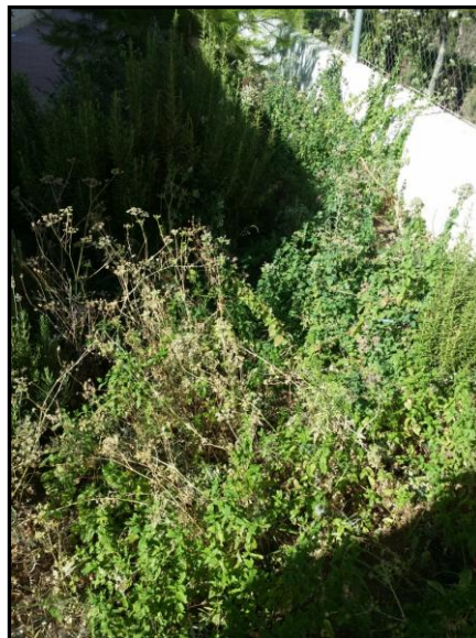
Imagen 22: aspecto actual del jardín de aromáticas.