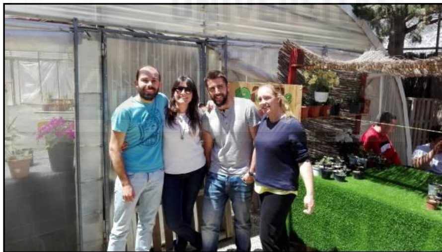
Imagen 20: Reparto de árboles autóctonos con motivo del Día del Medio Ambiente. En la imagen salgo yo junto otros profesores involucrados en el huerto.