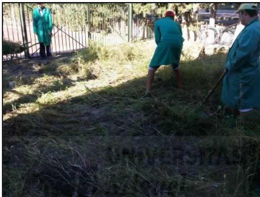
Imagen 5: Aspecto inicial de la parcela.

El aspecto que presentaba originariamente era el de un terreno baldío, lo primero fue proceder al desherbado manualmente (imagen 5). Para posteriormente aportar compost natural hecho a base de malas hierbas, hoja de ciprés y restos orgánicos procedentes de la cocina del colegio: piel de patatas, naranjas, plátano... Visitamos a un ganadero de la zona que nos proporciona estiércol de ovino maduro, cargamos varios sacos para facilitar su transporte y vertido a nuestro suelo.