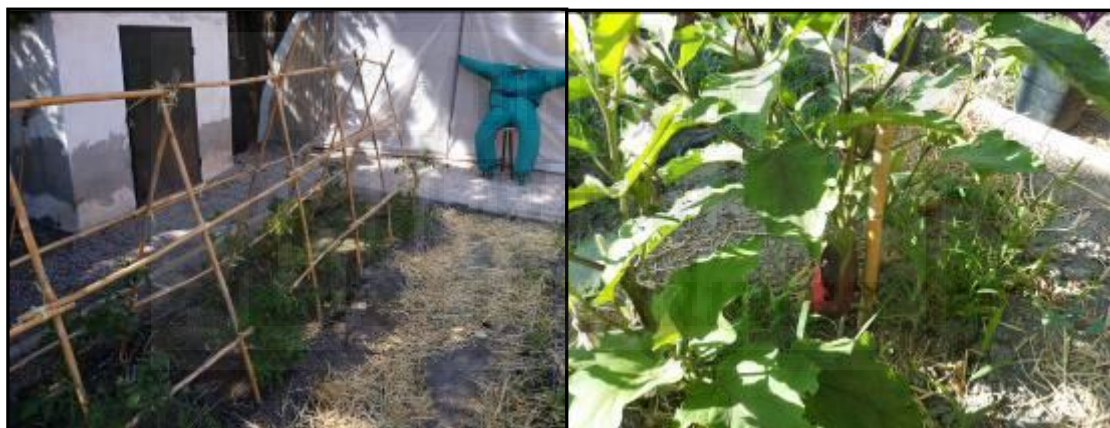
Imagen 14: Detalle de los tutores empleados en tomateras y berenjena.