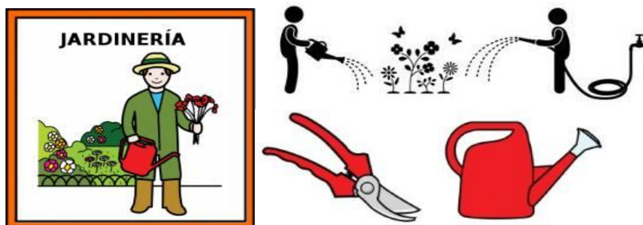
Imagen 17: Algunos de los pictogramas empleados durante el curso

El uso de rutinas y de pictogramas ha sido de gran ayuda para favorecer el trabajo de los alumnos, por este motivo, el trabajo del huerto siempre ha tenido una extensión en el aula y viceversa, para ayudar a reconocer qué tarea, materiales o herramientas se utilizarían en cada labor.