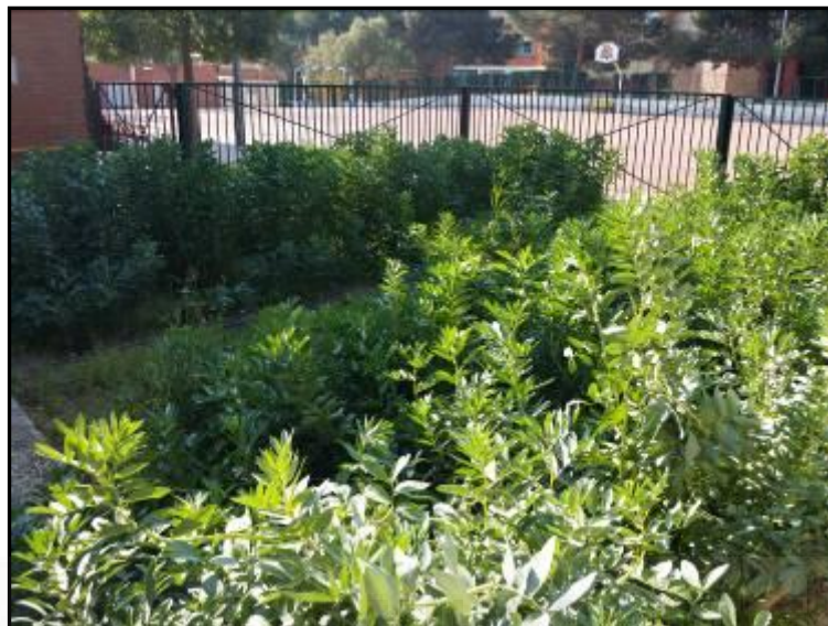
Imagen 7: Plantación de habas en plena producción.

Al disponer apenas de 6 -7 meses antes de que acabe el curso para poner en marcha el huerto, el planteamiento fue sencillo. En primer lugar plantar alguna leguminosa, en este caso concreto elegimos plantar habas. Las leguminosas tienen en sus raíces unas bacterias beneficiosas llamadas rhizobium . El rhizobium es por tanto un biofertilizante, que sustituye al nitrógeno químico. Las plantas crecen fuertes y sanas, al igual que sus frutos y hojas. Las leguminosas son imprescindibles para realizar una rotación de cultivos correcta con vistas a que todo se desarrolle de manera adecuada.