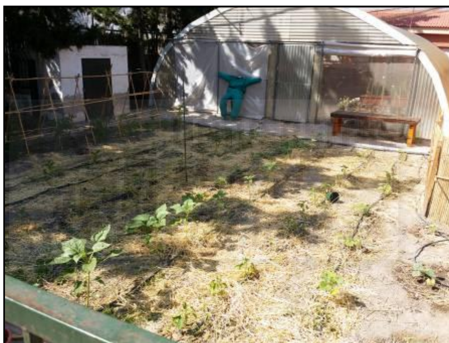
Imagen 10: Aspecto general del huerto de solanáceas y cucurbitáceas