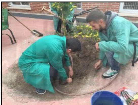
Imagen 18: Plantación y colocación del riego de un árbol con motivo del Día de la Paz.