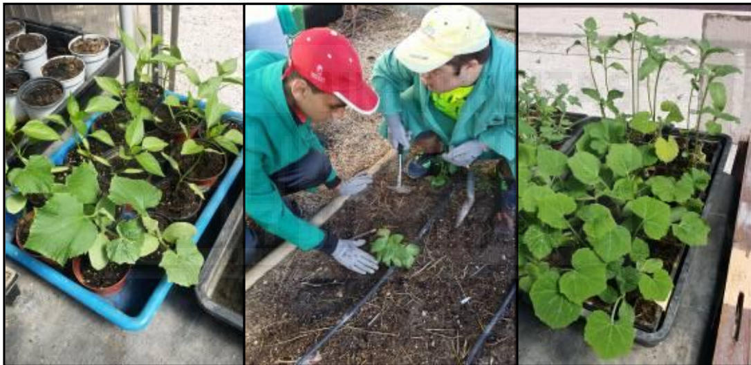
Imagen 11: Plantas de calabaza, pimiento y girasol en bandejas de semillero y en macetas, en el centro, dos alumnos realizando la labor de trasplante.

Para el trasplante en cepellón, la planta se extrae de la maceta y se deposita directamente sobre los hoyos. Hay que cuidar que la planta quede bien enterrada. Después de la siembra o el trasplante se riega abundantemente y a menudo, excepto tras la siembra directa de judías que precisan de tierra húmeda pero no encharcada.