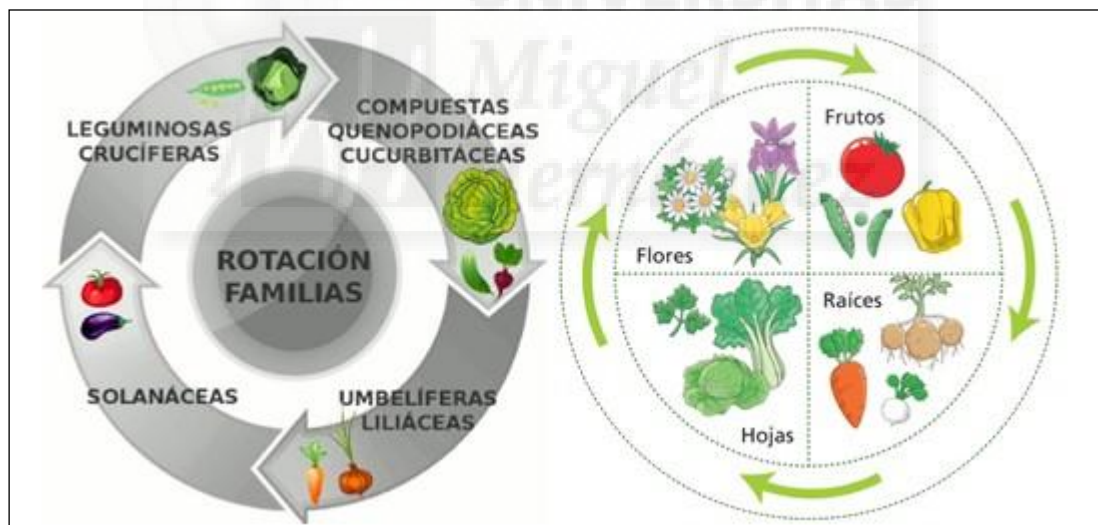
Imagen 1: esquemas de rotación de cultivos en función de las familias o de sus partes aprovechables.

Una regla fácil de seguir para establecer la rotación, es la que plantea Marín et al. (2015), que consiste en repartir los bancales por grupos de familias: solanáceas; umbelíferas y liliáceas, compuestas, quenopodiáceas y cucurbitáceas, leguminosas y crucíferas... e ir rotándolas siguiendo el mismo orden. También resulta interesante establecer la rotación en función de las partes aprovechables de las plantas (Imagen 1).