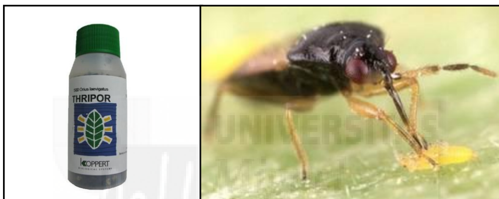
Imagen 2: Frasco comercial de 500 adultos de Orius laevigatus y un adulto de esta especie alimentándose de un trips.

- Aparición de trips ( Frankliniella occidentalis ) en las flores de las plantas de pimiento, provocando lesiones superficiales de color blanquecino en la epidermis de hojas y frutos. Al ver los primeros individuos, se realizó una suelta de unos 80 - 100 individuos de Orius laevigatus por las hileras de pimientos.