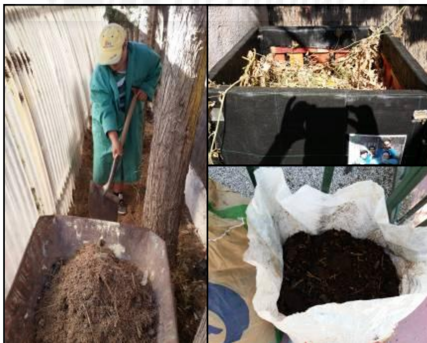
Imagen 6: Restos de hoja de ciprés, materia orgánica en la compostadora y estiércol de ovino.