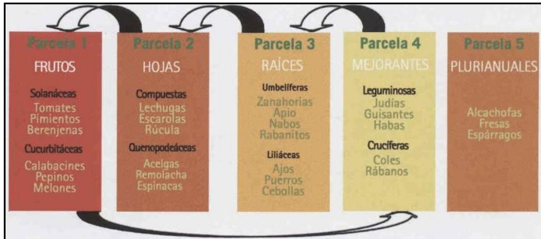
Imagen 21: Esquema de rotación de cultivos por exigencia de nutrientes.

ya en el apartado 2.2.1 de este trabajo, para evitar así posibles problemas relacionados con plagas y enfermedades. Para Bueno (2010), la forma más sencilla de realizar rotaciones es siguiendo una serie de reglas de distribución basadas en las exigencias de nutrientes. Esto se haría, tal y como vemos en la Imagen 21, alternando plantas exigentes de nutrientes, con plantas medianamente exigentes, seguidas de plantas poco exigentes y completar el ciclo con plantas mejorantes de la tierra o fertilizantes (abonos verdes y leguminosas).