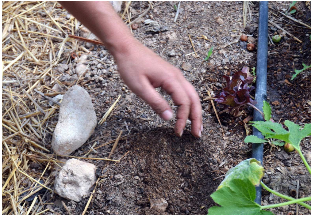
La Oficina Ambiental UMH ofrece cursos de agricultura ecológica