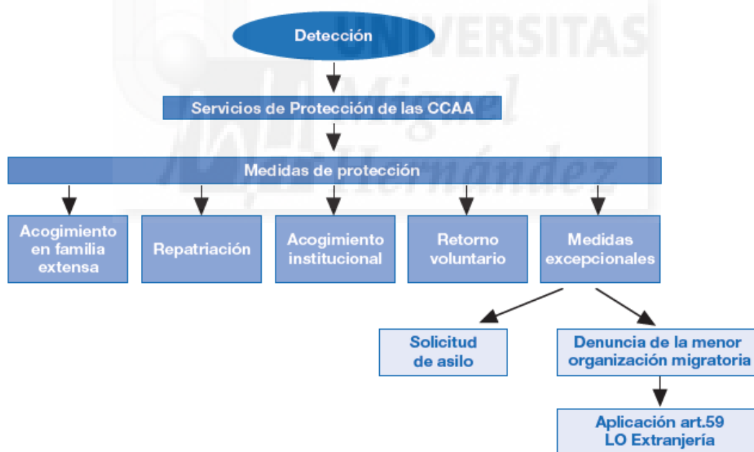
CUADRO 1. ESQUEMA DE ACTUACIÓN ANTE UN MENA EN ESPAÑA. Fuente: VIOLETA QUIROGA, ARIADNA ALONSO, MONTSERRAT SÒRIA, “Menores migrantes no acompañados/as: Sueños de bolsillo”, UNICEF y Fundación Banesto, diciembre de 2010, p. 123. Disponible en: https://www.unicef.es/sites/www.unicef.es/files/Suenos_de_bolsillo.pdf (consultado 12/05/2016).

En el siguiente gráfico se ve un esquema de la forma de actuación ante un MENA en España.