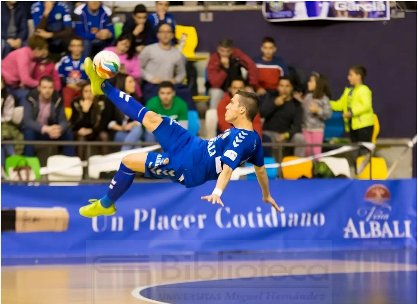
El fútbol sala español se encuentra dividido por la profesionalización de su deporte

El fútbol sala sigue tratando que los organismos oficiales le reconozcan lo que sus méritos deportivos aclaman, ser un deporte profesional. Pero, aún queda un largo camino para que los clubes puedan hacer frente económicamente a este reconocimiento, ya que en el apartado estructural el futsal español está más que preparado y organizado para su profesionalización.