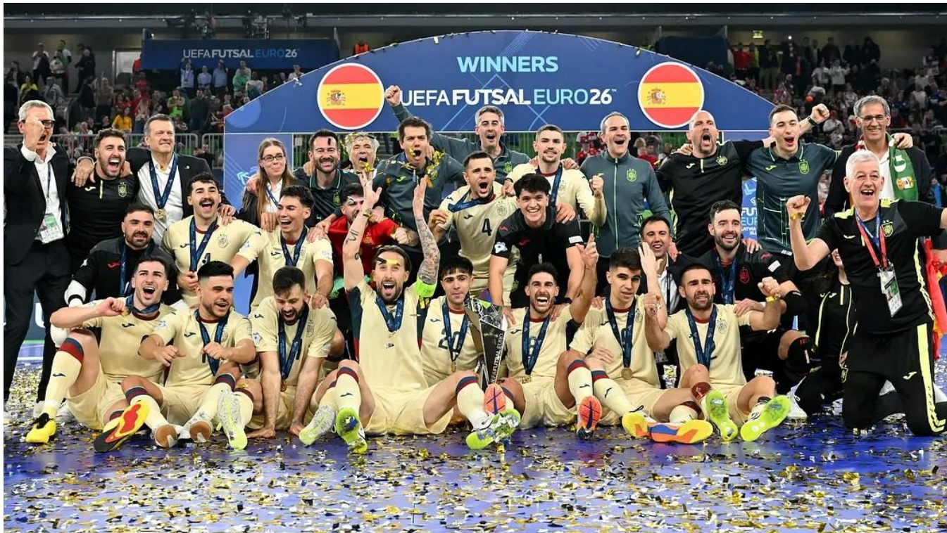
La selección española celebra su octava FUTSAL EURO conseguida el pasado siete de febrero en las sedes Letonia, Lituania y Eslovenia

Pero, al fútbol sala español le queda un largo camino para volver al lugar "privilegiado" donde estuvo alguna vez y atraer a personas del ámbito futbolístico para alcanzar el crecimiento deportivo que alguna vez se tuvo y que sus éxitos deportivos reclaman.