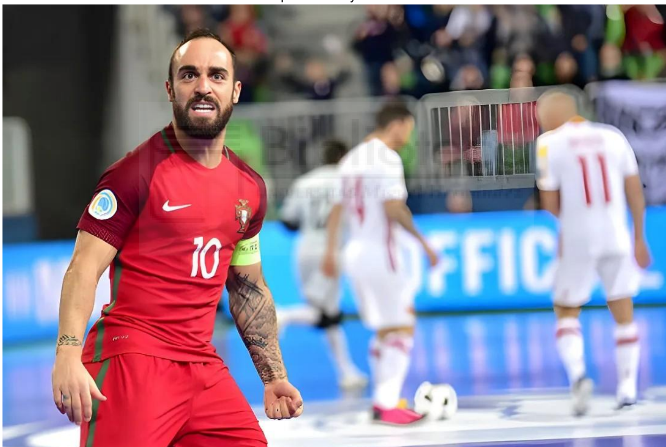
Ricardinho en la final de la EURO 2018 contra la selección española de fútbol sala

Dos años después, la selección logra alcanzar una nueva final de la EURO frente a Portugal, que terminaría perdiendo. Este encuentro se emitía en la cadena DMax (del grupo Warner Bros. Discovery) y tuvo un despliegue mayor que la final del 2016, contando con un espacio para la previa y otro para el post de la final. En la prórroga de este encuentro, donde se decidió el resultado final, se alcanzó un pico máximo de casi 970.000 espectadores , lo que se tradujo en más de un 5,5% de share . Nuevamente, esta cifra consigue ser la más alta del ‘resto’, en este caso concreto, todavía destacándose aún más que en el año 2016. Sin embargo, no logra acercarse a lo más visto de aquel 10 de febrero de 2018 que fue “El Tiempo de La 1”, que alcanzó más de dos millones trescientos mil espectadores y más de un 16% de share.