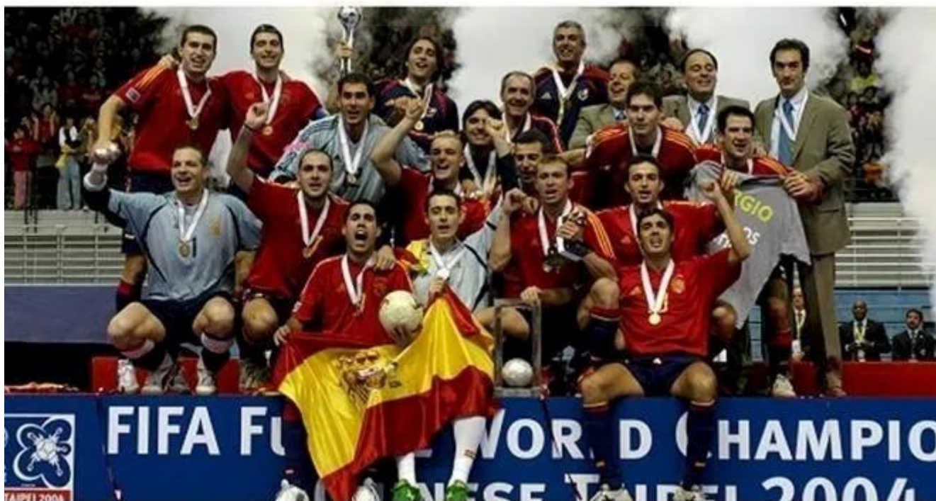
La selección española de futsal conquistaba su segundo mundial consecutivo en el año 2004 |

Uno de los motivos por el que el fútbol sala llega a las televisiones españolas es debido principalmente a la Selección Española absoluta de futsal. Con un palmarés de dos Copas del Mundo de Futsal (FIFA Futsal World Cup) en los años 2000 y 2004 ; ocho Campeonatos de Europa de Futsal (UEFA Futsal EURO) y un subcampeonato en la competición internacional UEFA-CONMEBOL (Futsal Finalissima); la Selección Española es una de las más exitosas del mundo del fútbol sala.