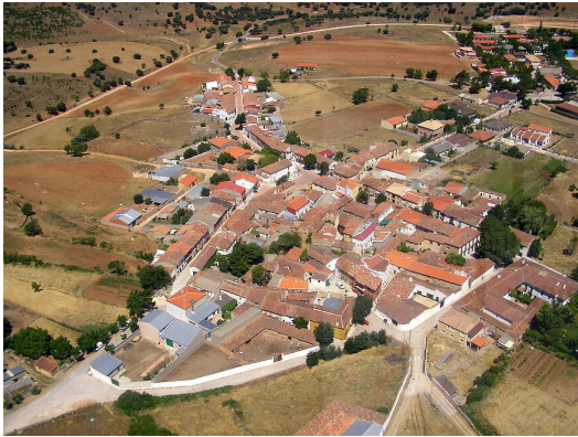
Peñascosa vista desde el aire 65