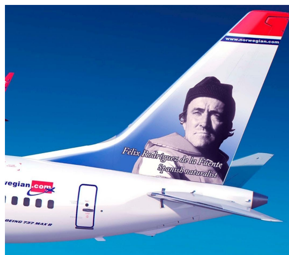
Félix Rodríguez de la Fuente en la flota "Héroes con alas".

El joven naturalista, nacido el 14 de marzo de 1928, provenía del modesto pueblo remoto de Poza de la Sal, al norte de la provincia de Burgos, pero se iba a convertir en una leyenda. La repercusión en el extranjero es tan marcada, que cuando la aerolínea Norwegian lanzó su flota Héroes con alas para homenajear a personajes históricos a nivel internacional, eligió al burgalés junto con otros 114 personajes internacionales, para llevar su rostro en la cola de dos aviones de la compañía 27 . Médico de formación y dentista de