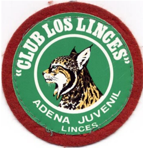
Logo de "El Club de los Lince".

pieles anuales del felino (Ibíd.: 30), en el año 2000 solamente quedaban 94 lince ibéricos en la Tierra. Existe unanimidad en determinar las enfermedades que asolan al conejo de monte (principal alimento del lince) la causa de la desaparición del lince durante las últimas décadas. Pero en los años 60 el lince estuvo a punto de desaparecer debido a su piel.