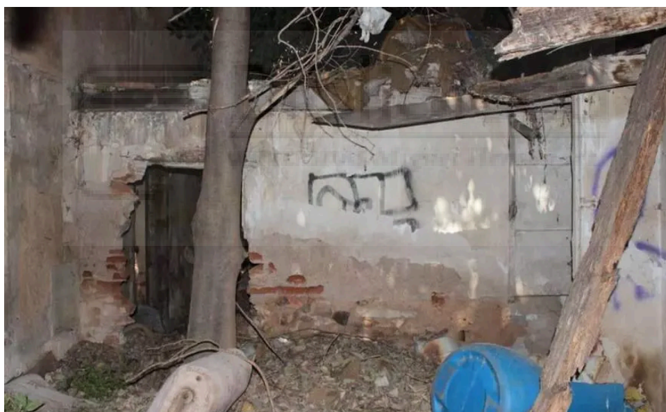
Figura 2. Molino Alfatego.

En este punto es dónde toma importancia la perspectiva fotográfica, la cual en muchas ocasiones ha sido la única vía por la que se podían registrar las situaciones injustas y visibilizar aquello que estaba desapareciendo. La fotografía, en este sentido, se transforma como una herramienta de resistencia y memoria, capaz de generar una reflexión sobre lo que significa perder el patrimonio de un territorio. (Sontag , 2006)