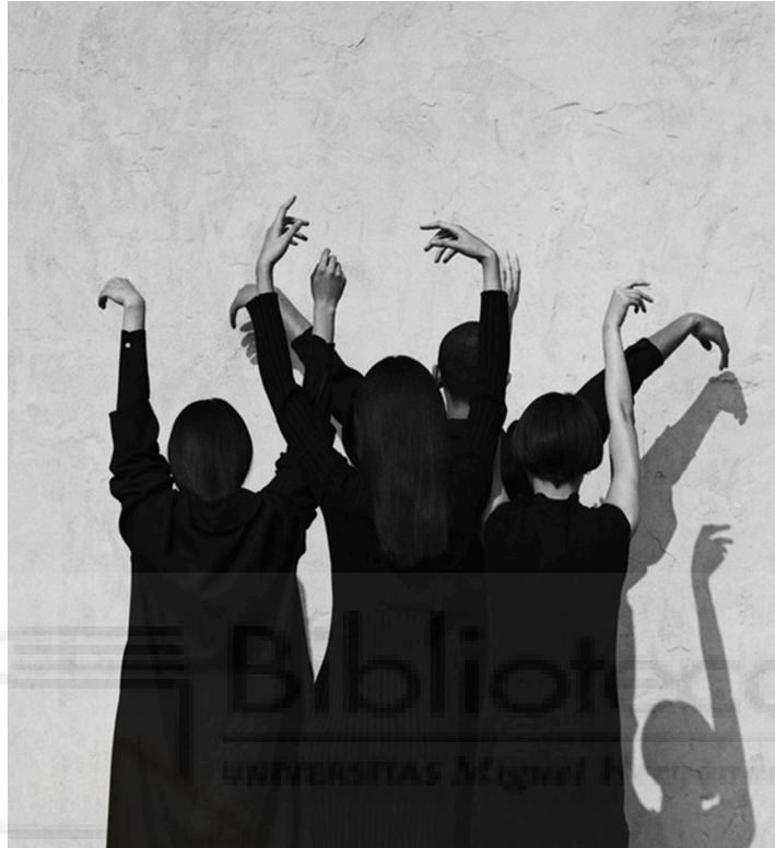
Figura 5. Fotografía de Jack Davinson. Fuente: Good2b.

Del mismo modo, las fotografías de Jack Davison , también en blanco y negro, aportan una referencia interesante por su movimiento, su composición y a la unión del cuerpo con del entorno, lo cual ha influido en la forma de trabajar el relato de este proyecto.