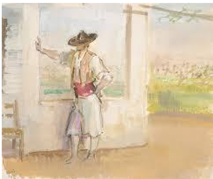
Figura 8. Pintura de Ramón Gaya.

Asimismo, la pintura de Ramón Gaya ha influido en la forma de componer ciertas imágenes desde la calma y lo cotidiano. Este enfoque también aparece en fotografías, donde se combinan elementos de la huerta como frutas, herramientas, flores con restos o símbolos del abandono.