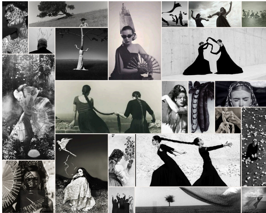
Figura 9. Moodboard de expresión gráfica.

El conjunto visual se define a través de moodboards organizados en blanco y negro y en color, donde se trabaja con la estética, atrezzo floral y vestuario.