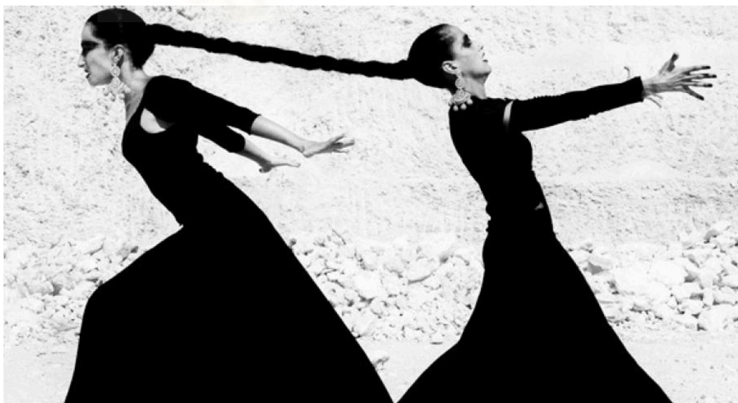
Figura 3. Proyecto Ángel Gitano .

Ruven Afanador ha sido una figura esencial. Su trabajo fotográfico, especialmente en series como Mil besos o Ángel gitano , ha sido esencial para entender cómo el folclore puede dialogar con la moda, el arte y lo simbólico sin perder fuerza ni respeto hacia lo que representa. Afanador no muestra el folclore como algo estático o muerto, sino que lo eleva a lo emocional y lo corporal. Su uso del blanco y negro, de fuertes contrastes, composiciones teatrales y personajes que habitan una frontera entre lo tradicional y lo vanguardista, ha sido una gran inspiración para este proyecto. Esa forma de representar lo identitario desde la teatralidad y la expresión corporal se traslada aquí a las imágenes que buscan unir cuerpo y tierra como ejes simbólicos.