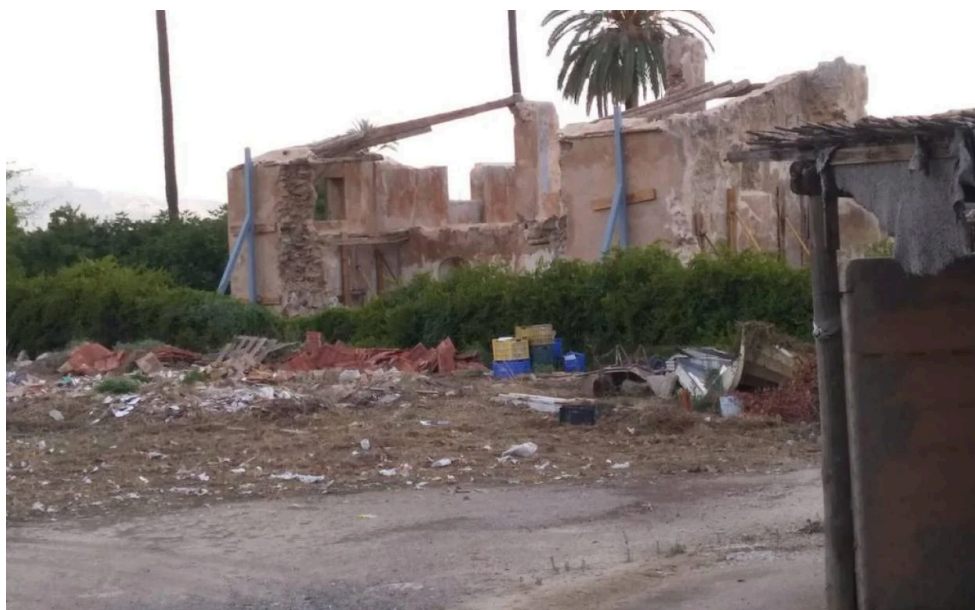
Figura 1. Casa de Antonete Gálvez.