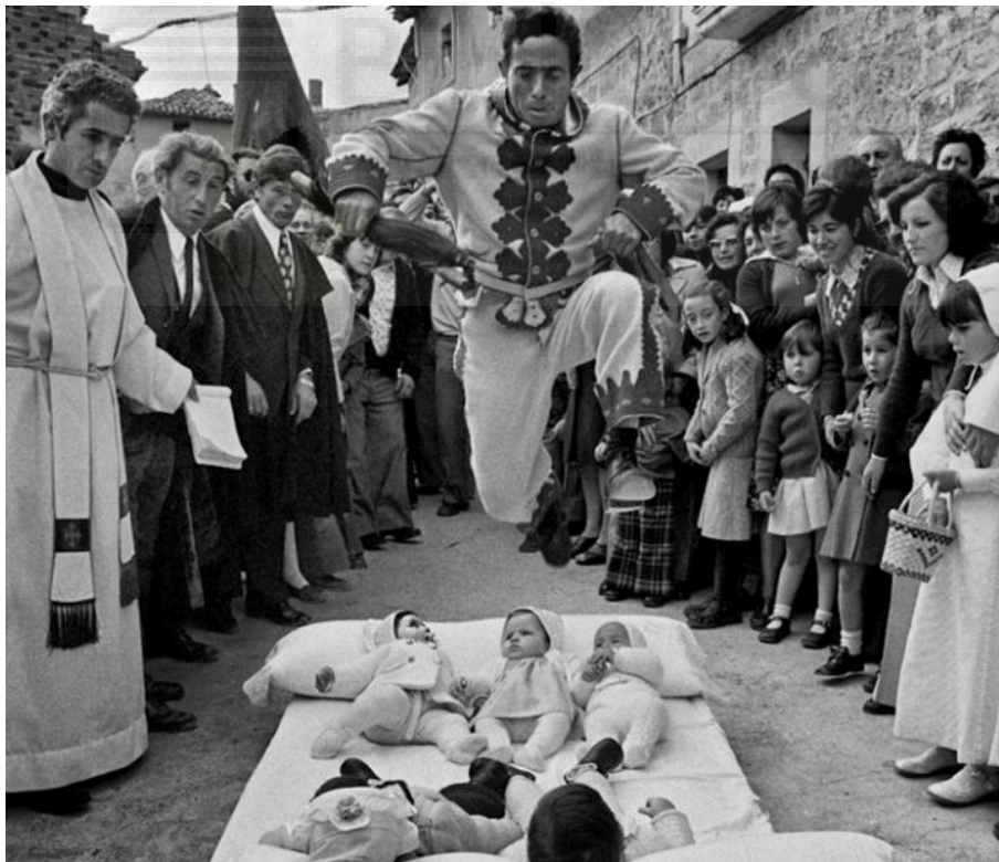
Figura 4. Libro España oculta. Cristina García Rodero.

Además, su capacidad de visibilizar lo que permanece oculto, conecta con los objetivos de este trabajo, ya que no solo se busca evidenciar la degradación física de la Huerta, sino también la pérdida de los saberes y costumbres que han dado forma a su identidad histórica.