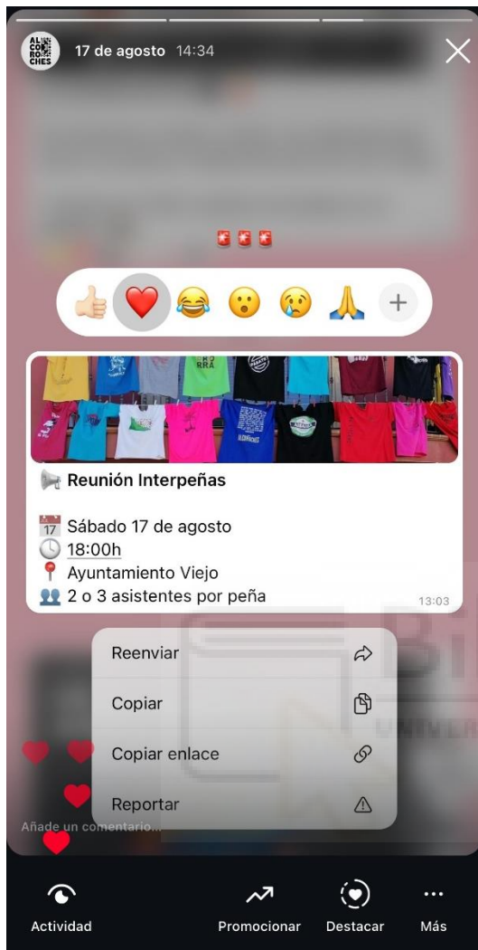
Figura 4: Canal de WhatsApp – Recordatorio

objetivo de ampliar la audiencia y fortalecer el sentido de cohesión intergeneracional en Alcoroches.