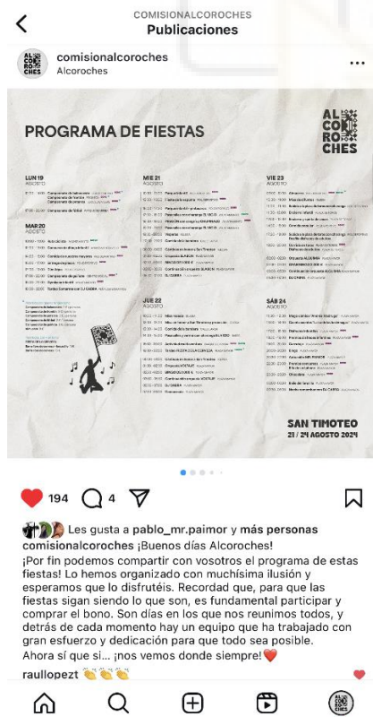
Figura 5: Post Instagram - Programación de fiestas 2024