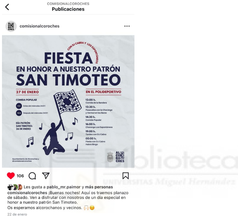
Figura 1: Post Instagram - fiesta enero

21:30 y las 22:30) los domingos, martes, miércoles o jueves, ya que esos eran los momentos en que la gente estaba más receptiva y tenía tiempo libre para interactuar. Se evitaban los viernes, sábados y lunes, cuando las personas estaban ocupadas con otras actividades o descansando.