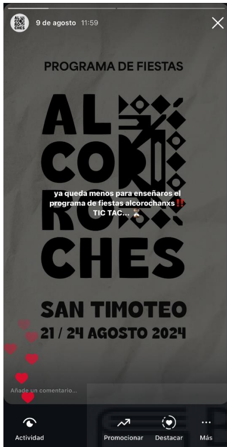
Figura 2: Historia de Instagram - Adelanto programa fiestas