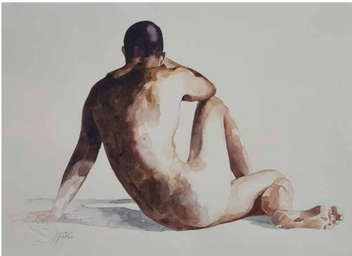
Hombre reclinado. Acuarela sobre papel. 38x52 cm.