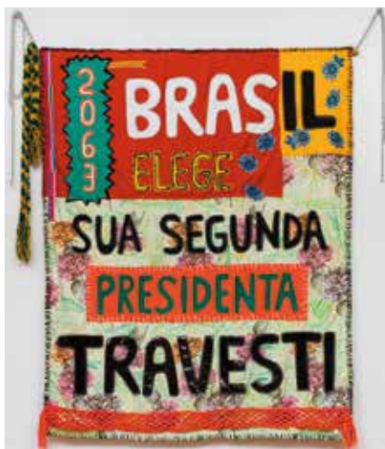
Profecias 2063 - Brasil elege sua segunda presidenta travesti / Profecías 2063 - Brasil elige a su segunda presidenta travesti. Costura e bordado em tecido. Costura y bordado en tela, 180x200cm, 2021.