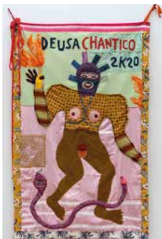
Deusa Chantico 2k20 / Diosa Chantico 2k20. Costura e bordado em tecido / Costura y bordado sobre tela. 150x220cm, 2020.