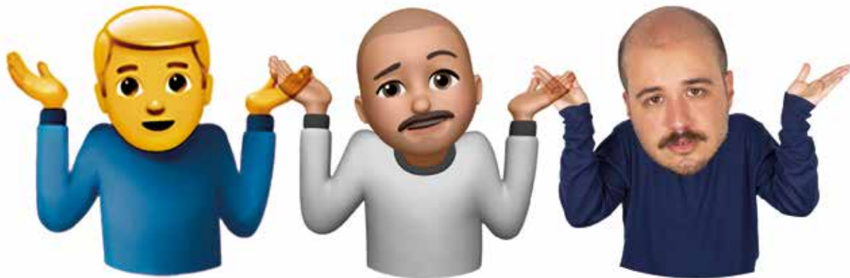
Me, Myself and I. Composición con Emoji, Memoji y Retrato. 2021.