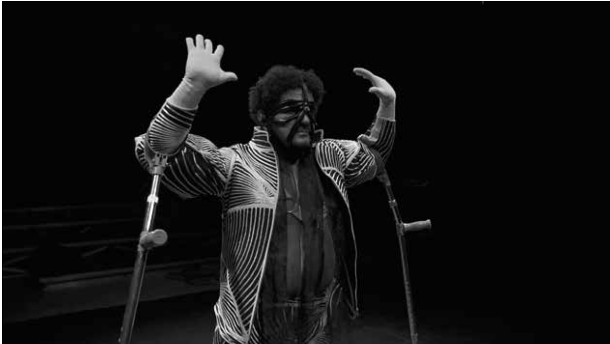
Devotees . Vídeo-performance. 2021

Devotees é um ensaio sobre o corpo e seus desejos. O direito ao corpo, ao sexo, à sexualidade. Todo corpo é desejado e desejante. As cenas se desenrolam dentro de clichês e ousadias de um corpo def que se apodera de fetiches sobre corpos não hegemônicos e compõe partituras de movimentos que incitam ou rompem com os paradigmas de corpo e desejo.