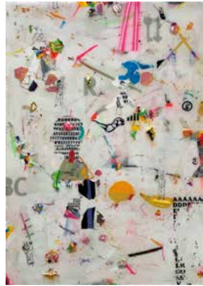
Tratado de amor actualizado . Tríptico. Pintura. 70x150 cm.