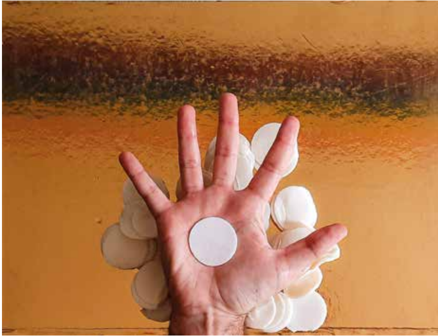
Performance “Desbatismo - Primeiro Ato” / “Desbateig - Primer Acte”.

Partindo da experiência do batismo como um ato imposto às crianças que nascem em famílias católicas, esta performance reivindica o desligamento de corpos bixas dos preceitos e imposições católicas, por meio da criação de rituais que saqueiam objetos, símbolos e ritos do catolicismo.