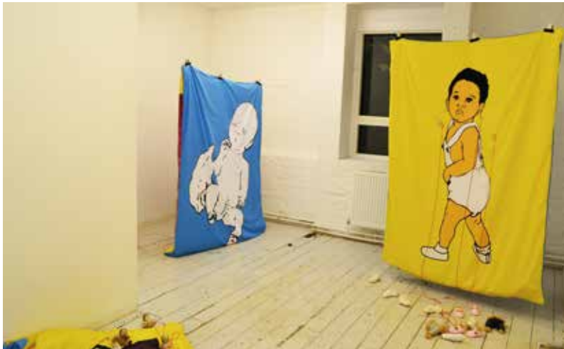
Nuevas personas 03.