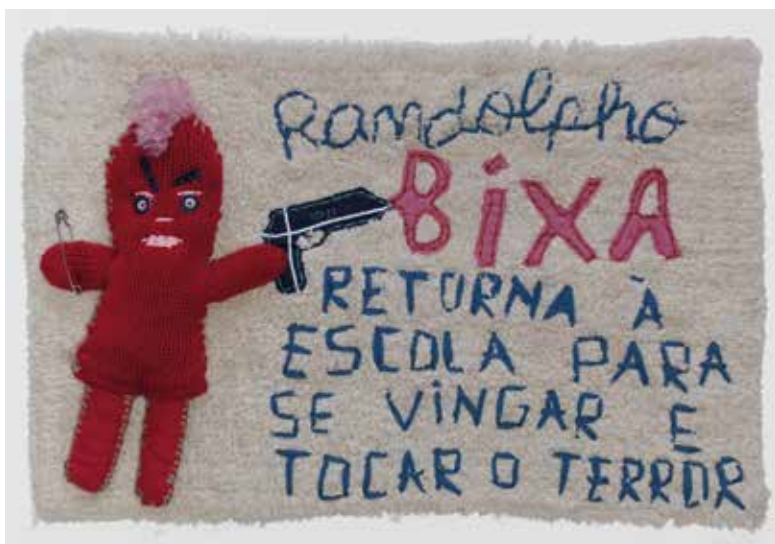
Crônicas de Retalho - Randolpho Bixa retorna à escola para se vingar e tocar o terror / Randolpho Bixa regresa a la escuela para vengarse y aterrorizar a la gente. Bordado en alfombra. Crônicas de harapos / Bordado sobre tapete. 60x 40cm, 2018.