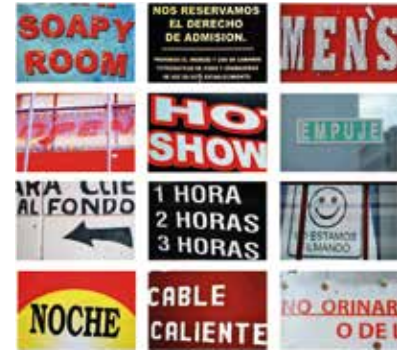
Escrituras para luditas.