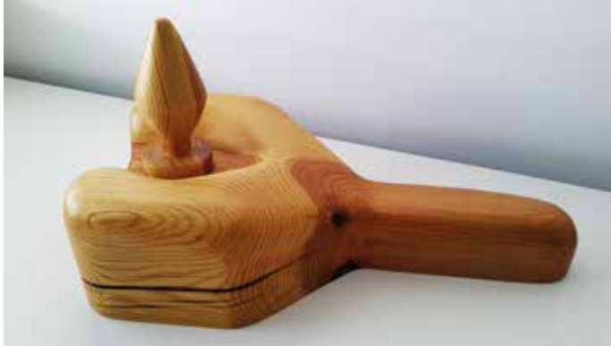
Selló de bicicleta amb dilatador anal (2015). Talla amb fusta de pi i tècnica constructiva. 40x20x20 cm. Joc contrasexual que promou la dildotectònica anti-fal·luscèntrica.