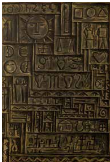
Arte Universal. Collage digital. 2018.