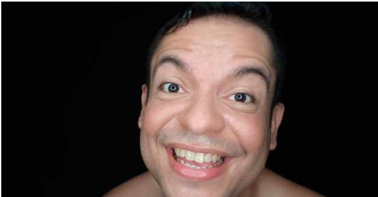
Paz no futuro e glória no passado. Video-performance, 2022.