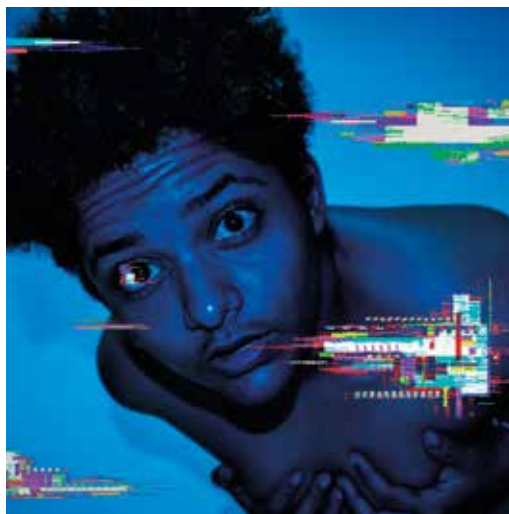
Cyborgue . Tríptico fotográfico com edição digital. Manuseio de agulhas, ampolas, hormônios e sangue. Foto-performance, 2018.