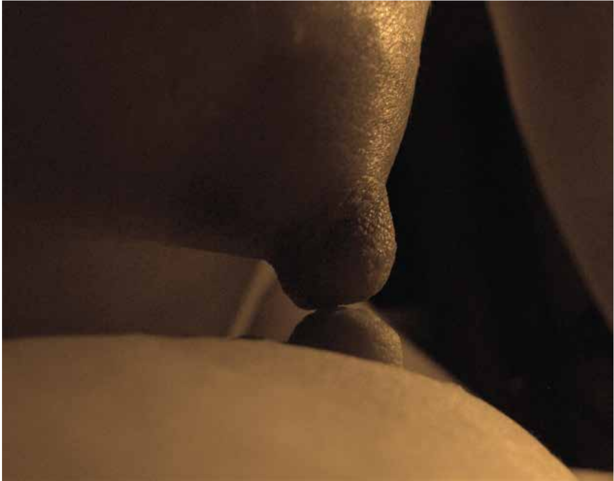
Poemas cotidianos . De la serie Poemas cotidianos . Fotografía. 70x50 cm.