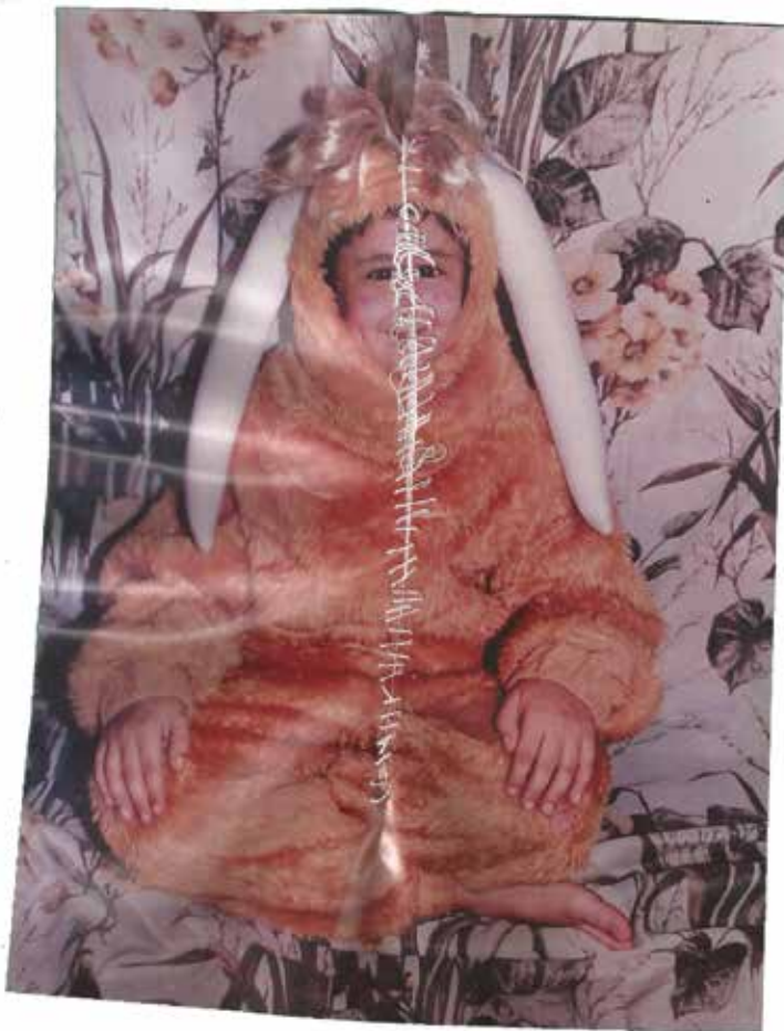
Sutura sobre fotos de criança trans(viada). Impressão em papel fotográfico com costura. 2022.