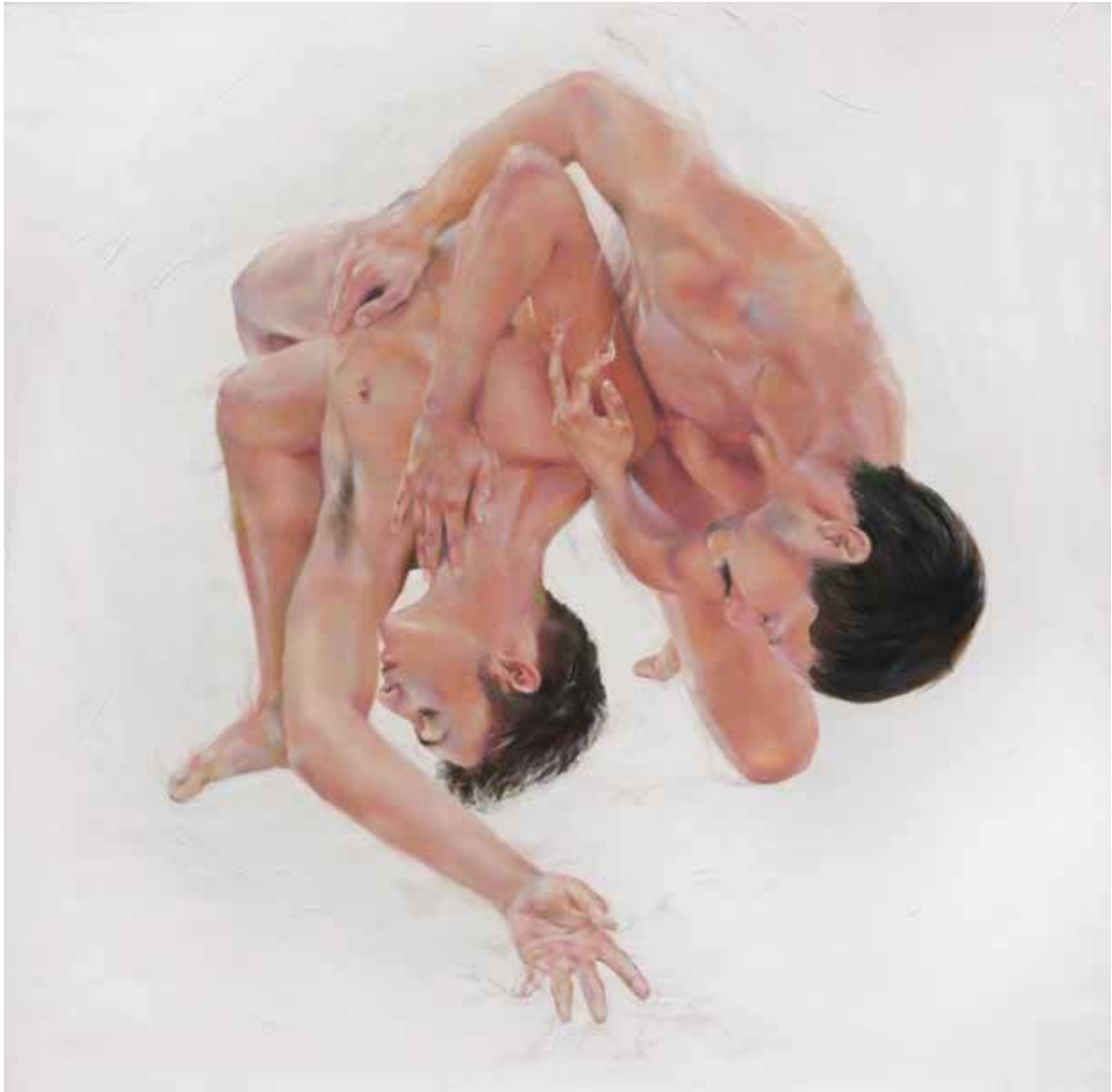
El abrazo. 2018. Del proyecto multidisciplinario Traje Humano . 100x100 cm.