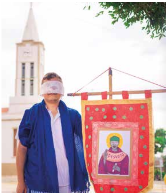
Nosso Senhor dos Des-votos . Estandarte em tecido, oração impressa em papel, 2022.