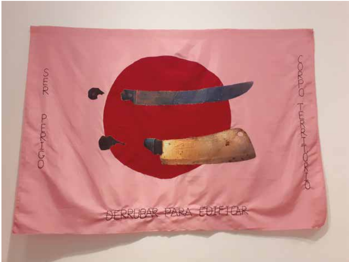
Terraaterra bandeira. 113x160cm, 2019.