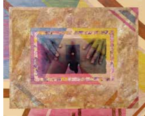
Dit i forat: escatologies geomètriques sobre l'analitat. 2017. Tècnica mixta sobre contraxapat. 76x94 cm.