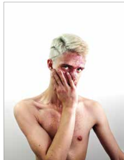
Martín. De la serie Consagraciones. Fotografía digital. 2015.