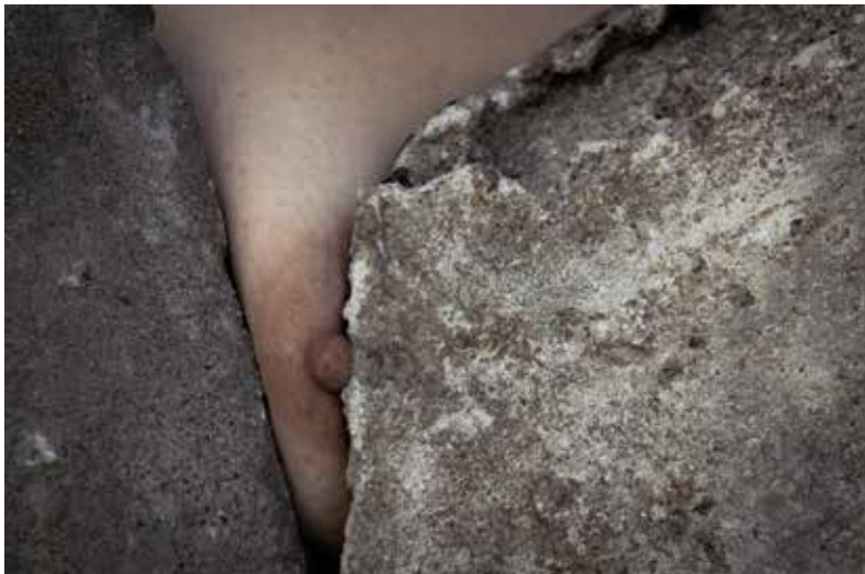
Remissão. Foto-performance, 2016.