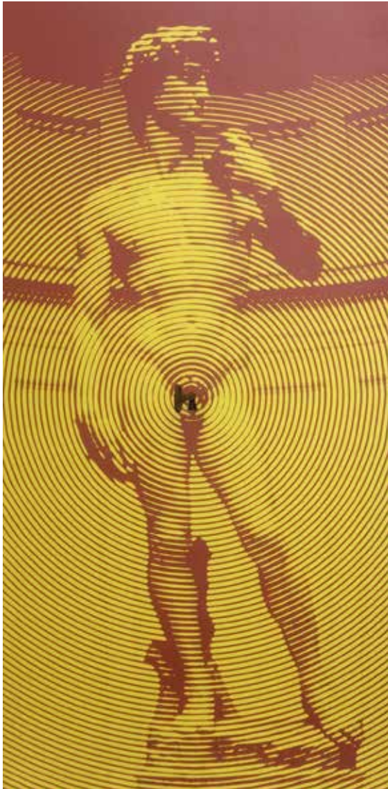
Fons d'armari. Impressió digital sobre tela samba, intervinguda amb pany i clau. 114x57cm. 2022.