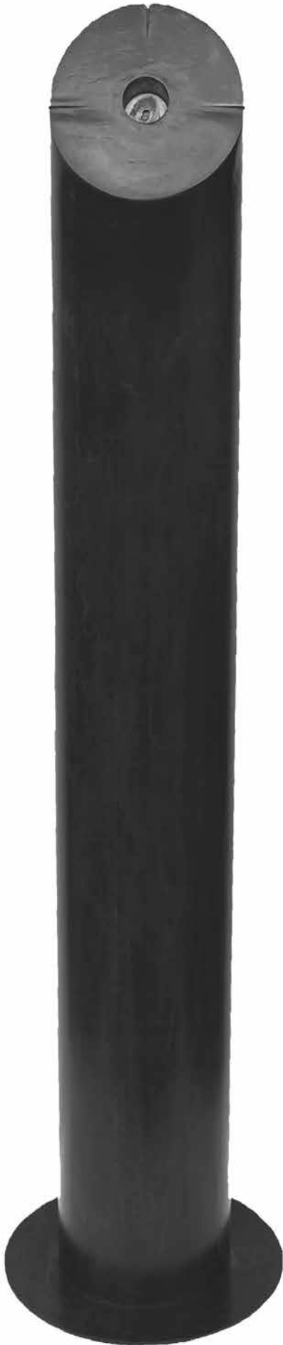
Columna de Eros V. Pieza escultórica en hierro de M.J. Zanón.

espectador. El artista no debe distinguirse únicamente por la habilidad con una técnica, sino que también tenemos que tener en cuenta y ponernos en valor por nuestra perspicacia imaginativa.