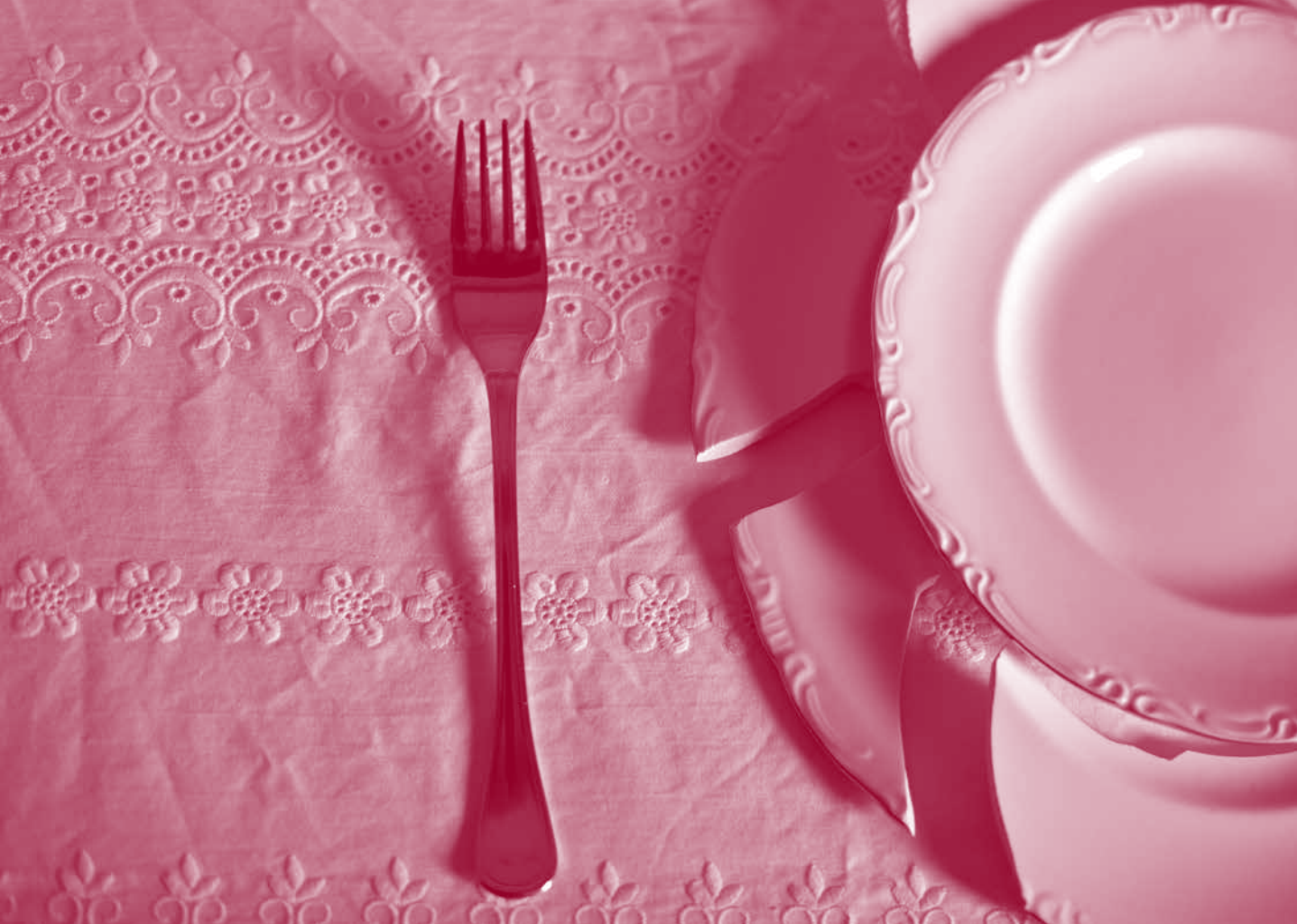
Las bocas inútiles. Instalación de Imma Mengual (detalle).

vez, quien acaba el proceso a través de su visión por su propia reflexión. El azar me permite plantear un juego que consiste en descomponer el cuerpo hasta desligar su referencialidad, en donde el espectador es quien lo descodifica, quien lo debe traducir, haciendo un trabajo intelectual para acceder a su lectura. Con este fin, siempre doy una pista, pues utilizo el título de la obra para iniciar al espectador en la experiencia.