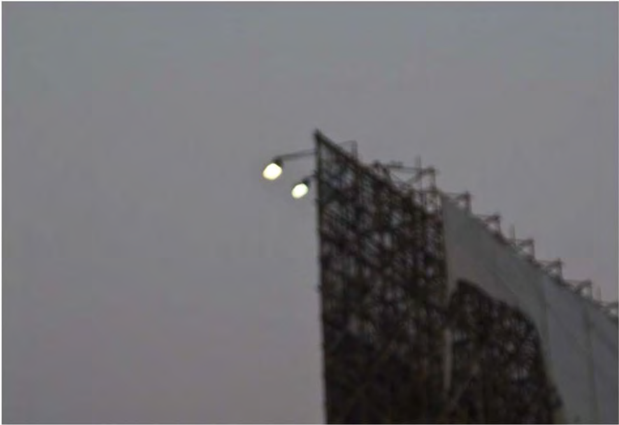
Remember the last night Fotografia/ 2013 60 x80cm