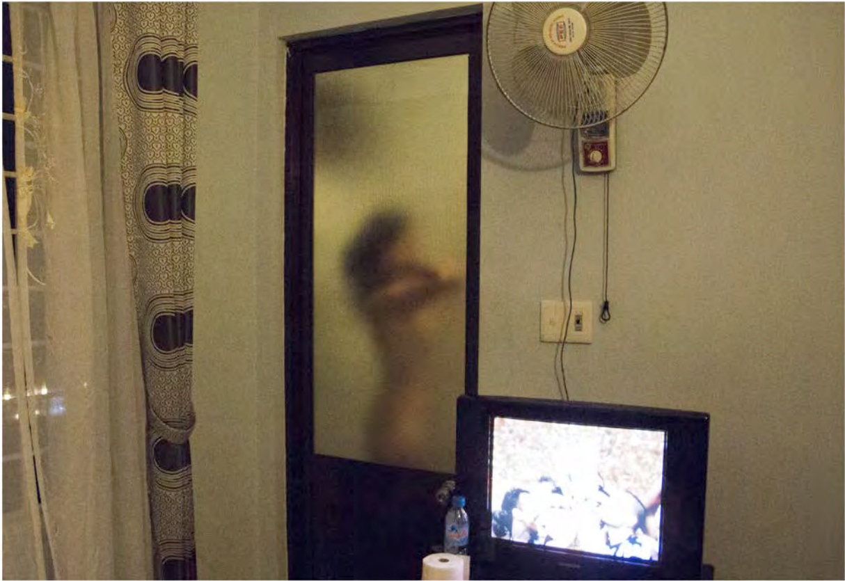
Room IX. Fotografía/ 2013 60x80cm