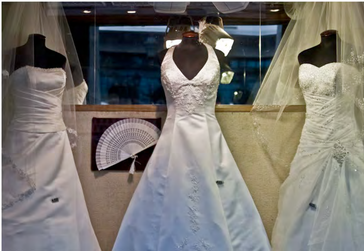
wedding night. Fotografia/ 2012 60x80cm