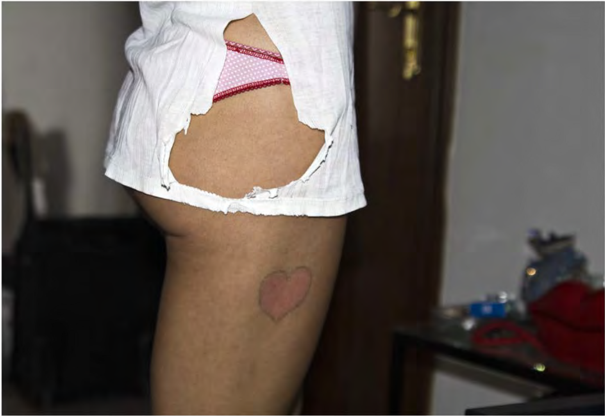
love you Fotografía/ 2012 60 x80cm