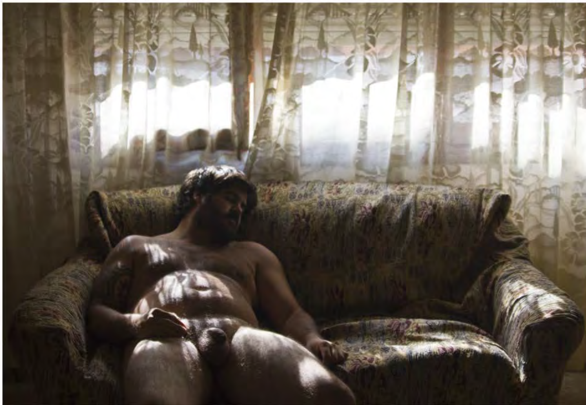
The dream of leo Fotografía/ 2012 60 x80cm