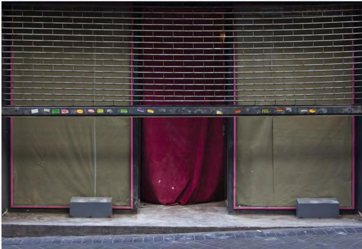
This is the end Fotografía/ 2011 60 x80cm