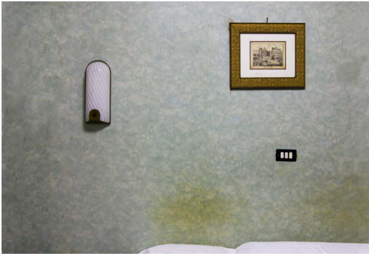
Room IV. Fotografia/ 2012 60x80cm