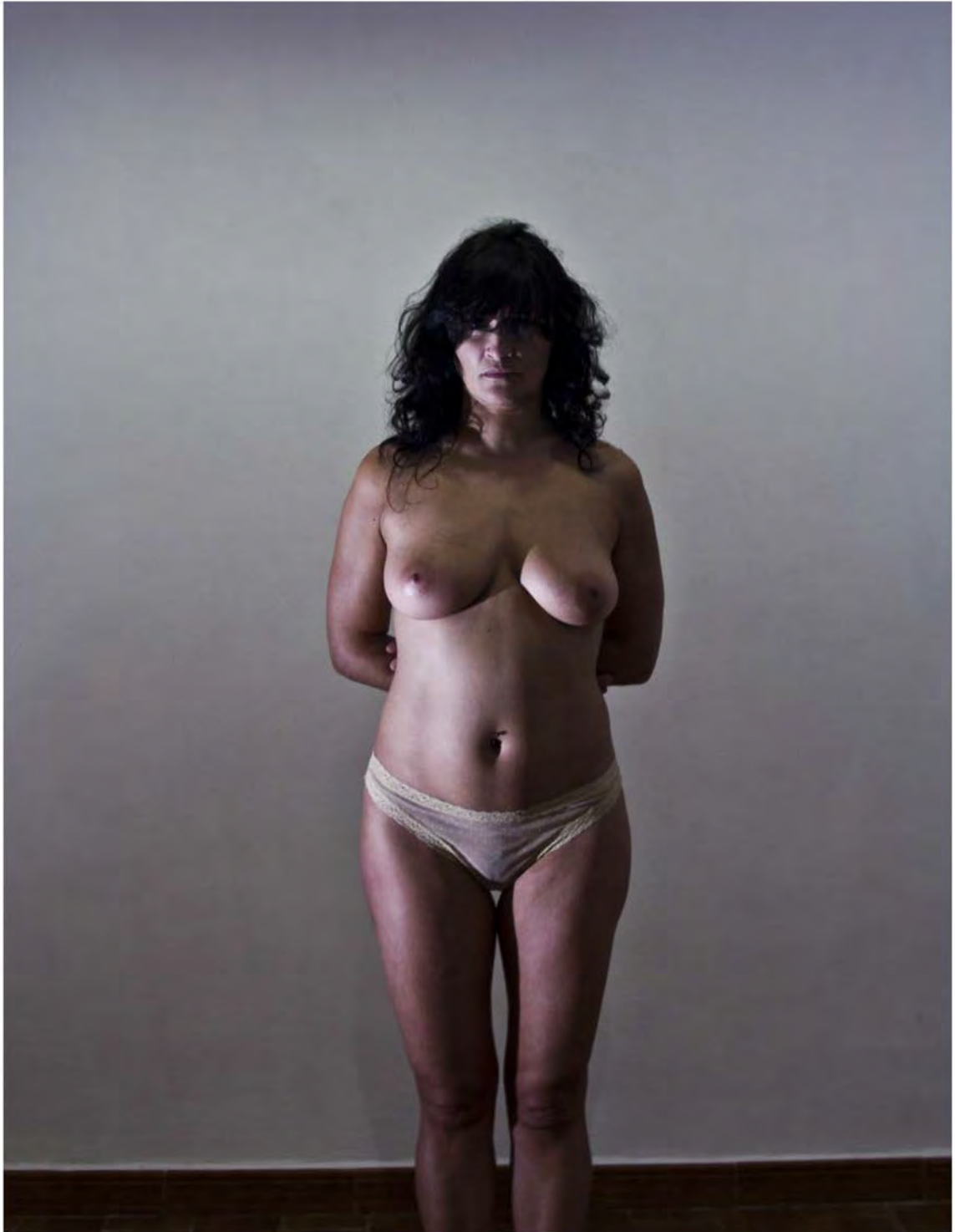
Maria III Fotografía/ 2011 100x125cm