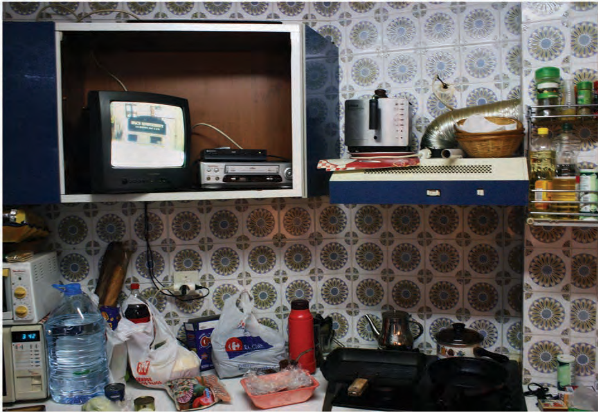
Cooking. Fotografia/ 2011 60x80cm