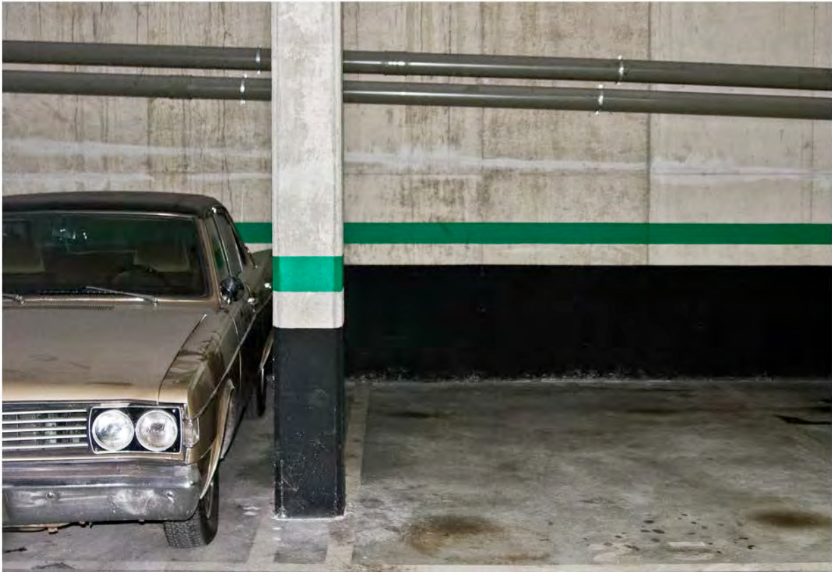
The Car. Fotografia/ 2011 60x80cm