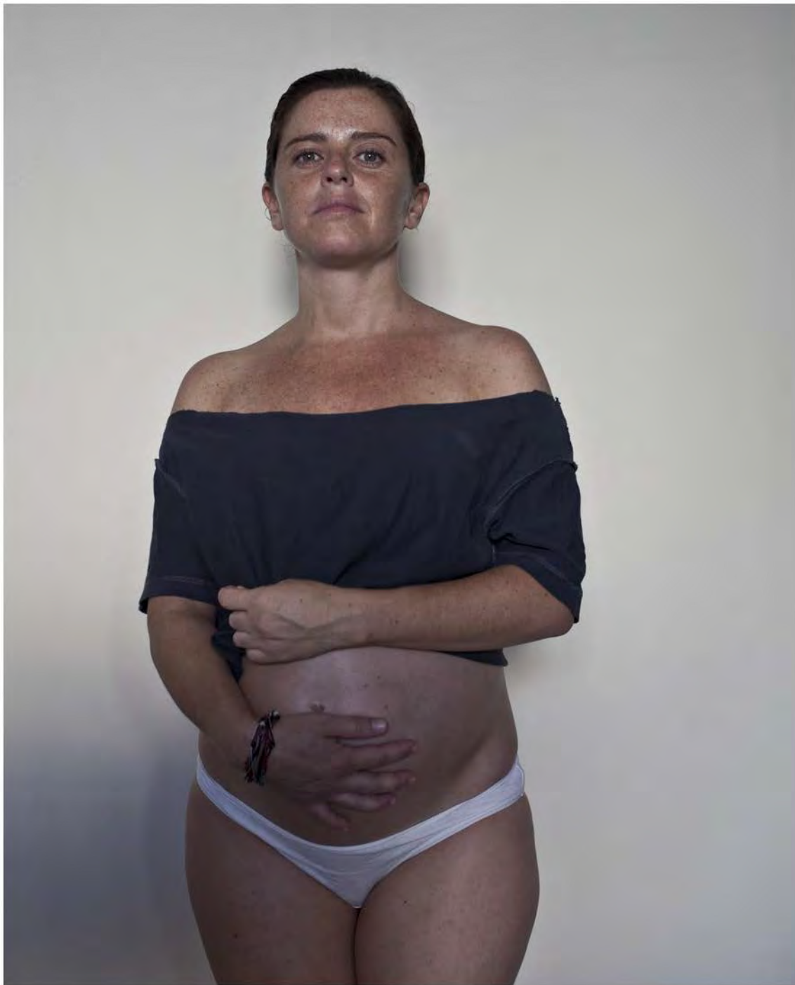
Natalia. Fotografía/ 2013 70x80cm