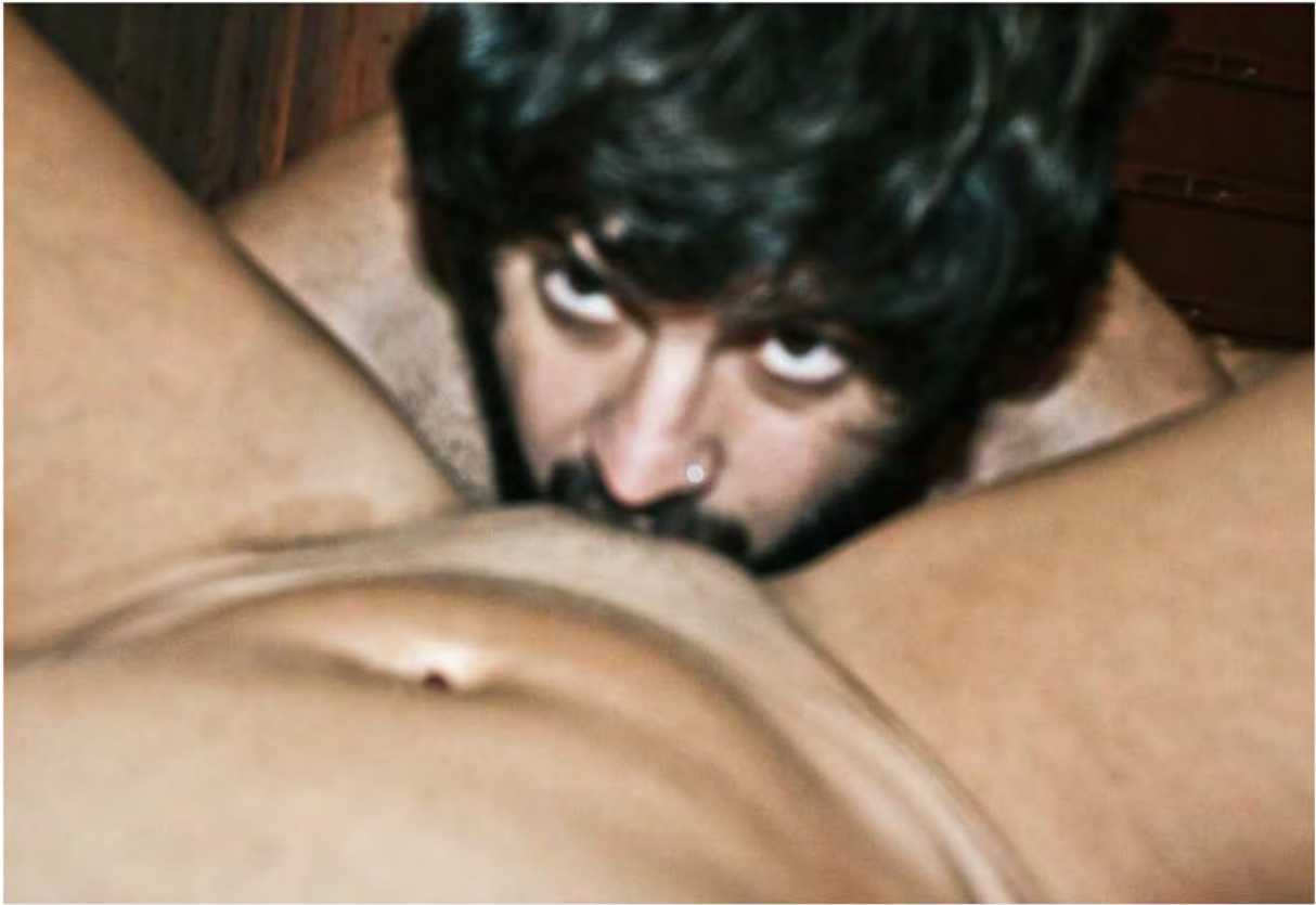
End of the world. Fotografia/ 2012 60x80cm