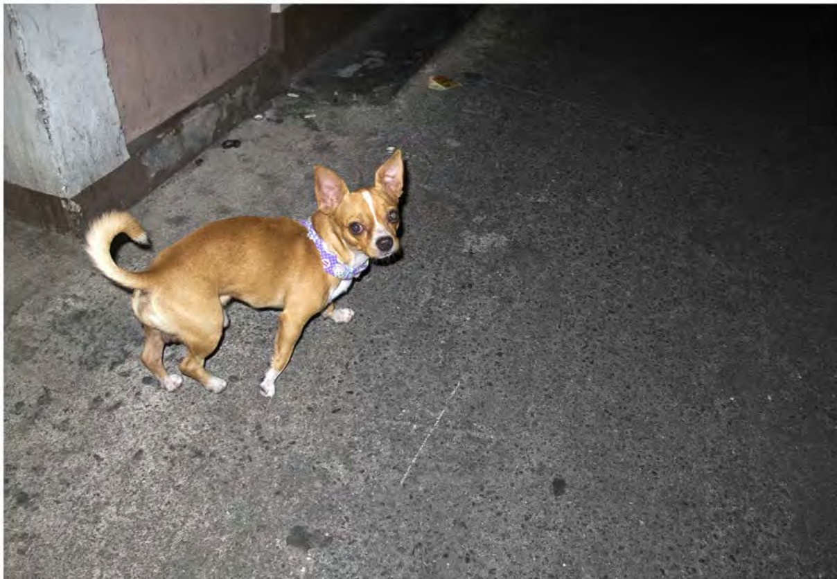
The dog Fotografía/ 2013 60 x80cm