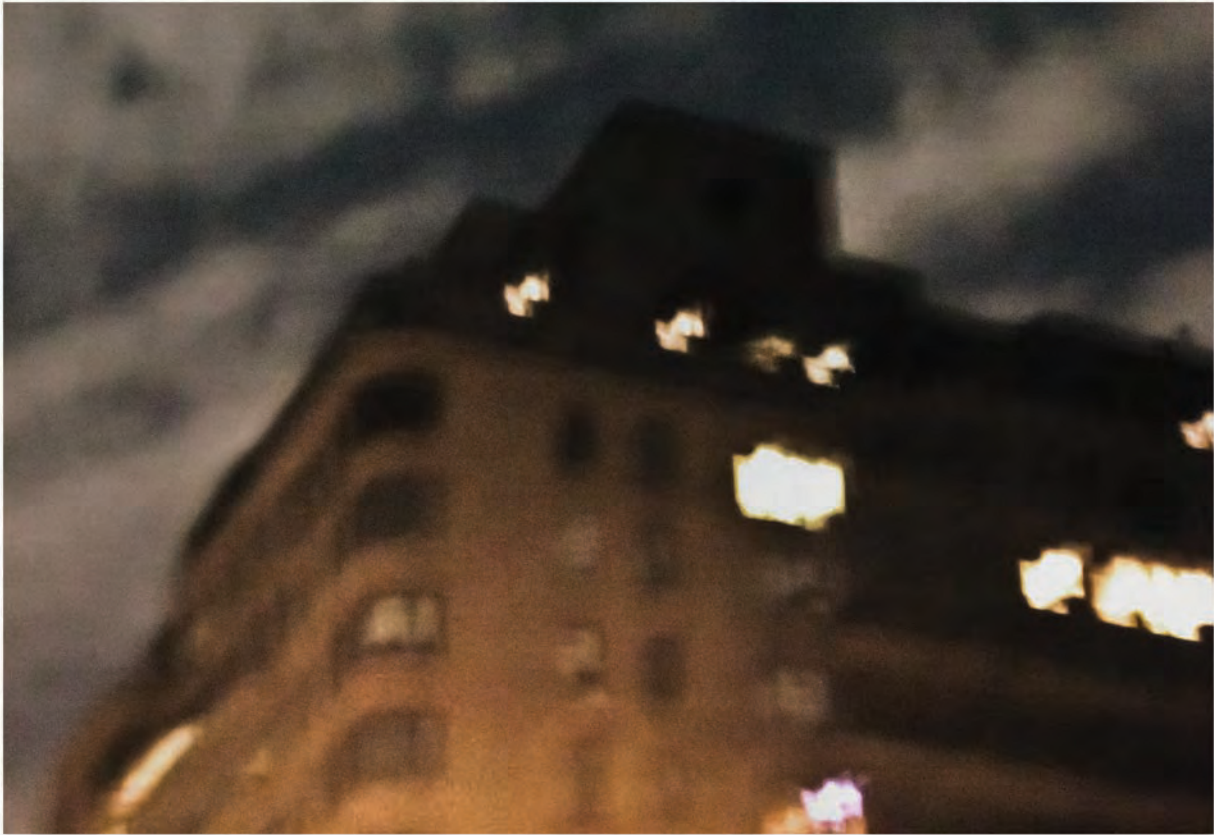
The Corner. Fotografia/ 2012 60x80cm