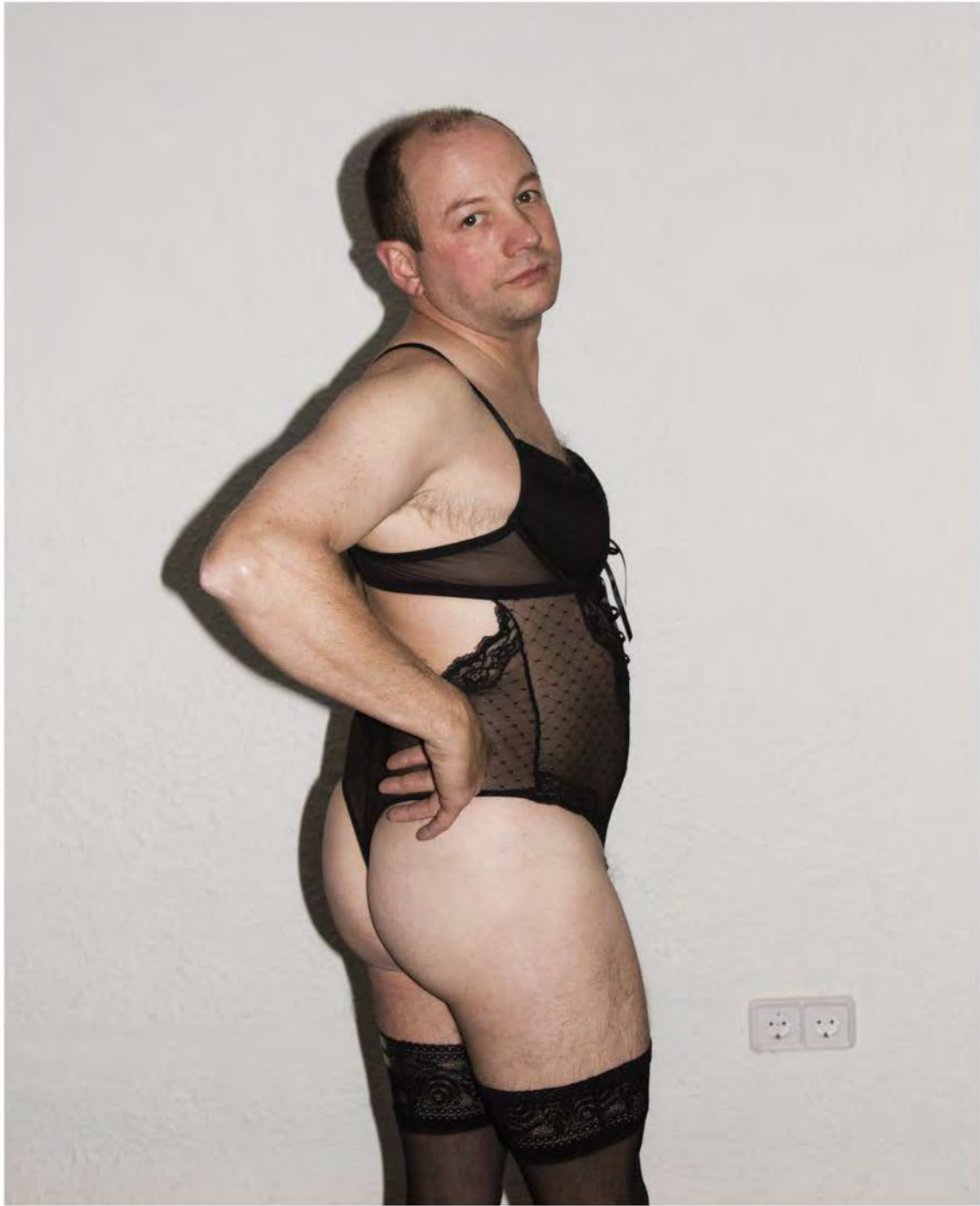
The Uncle jack Fotografía/ 2014 100x125cm