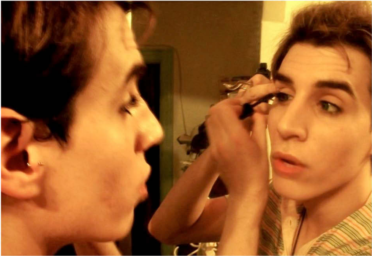
Tommy. Fotografia/ 2012 60x80cm