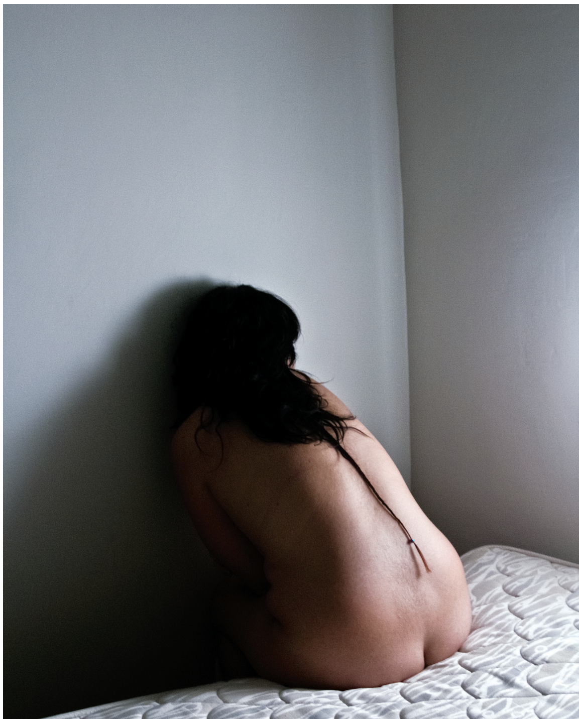
white nighth /2011 - 150 x 125 cm