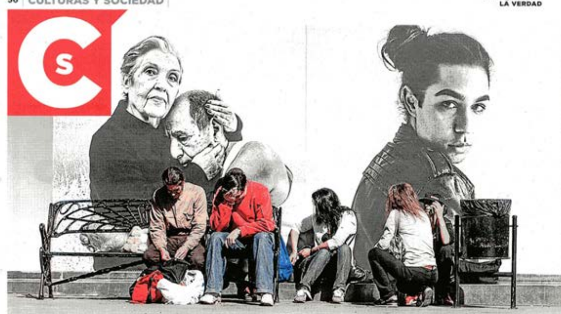
Impresiones en vinilo montadas sobre estructura de cristal de 1100 por 260 centímetros en la plaza del Mercado Central que componen la instalación 'Montañas' del fotógrafo alicantino I

Una 'performance' titulada 'La fiesta de la fotografía Subversiva', en L'Espai el 14 de marzo, la celebración de un 'Street Photo Studio' en la Plaza del Mercado Central el día 28, la realización de un Photobook conjunto en el MACA el día 26 y, las visitas guiadas que proponen los organizadores, junto a los talleres y conferencias que se prolongan durante todo el mes hacen que, lo difícil, sea escapar de la fotografía durante el Photo Alicante.