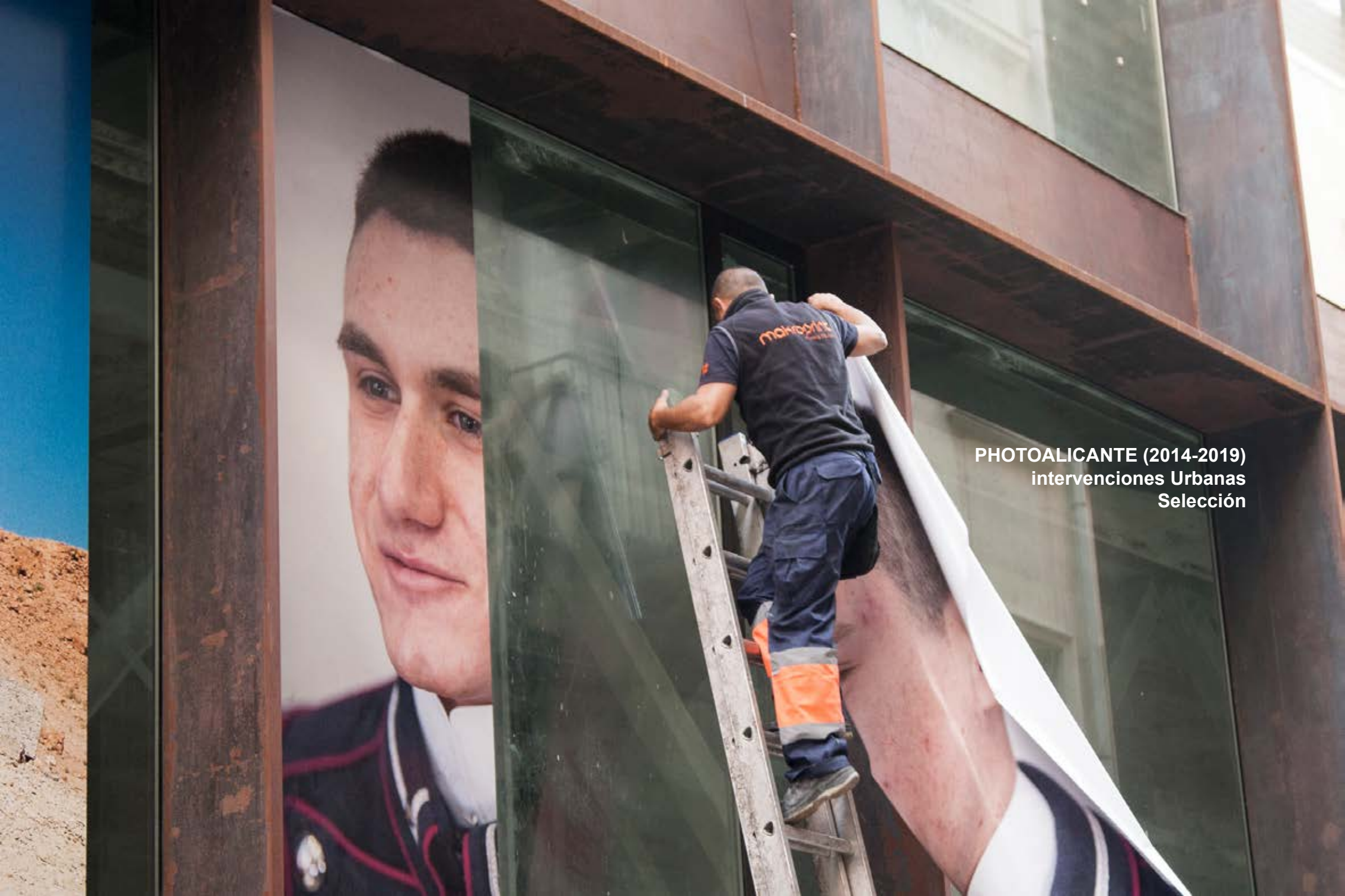
PHOTOALICANTE (2014-2019) intervenciones Urbanas Selección