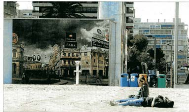
Fotografía de la serie Motel Habana , de Lidmila & Nelson, instalada en la avenida de Niza de la playa de San Juan, SAN JUAN, PUERTO RICO

El festival plantea al espectador contemplar las obras colgadas en siete lugares, desde San Antón hasta la playa