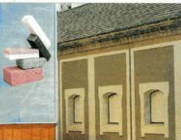
Losting followers since forever , en el jardín de Las Cigarreras, SAN JUAN, PUERTO RICO