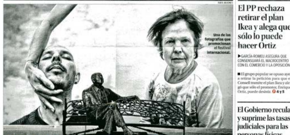
PhotoAlicante toma las calles Imágenes de gran formato del festival internacional de fotografía se instalan en el centro de la ciudad