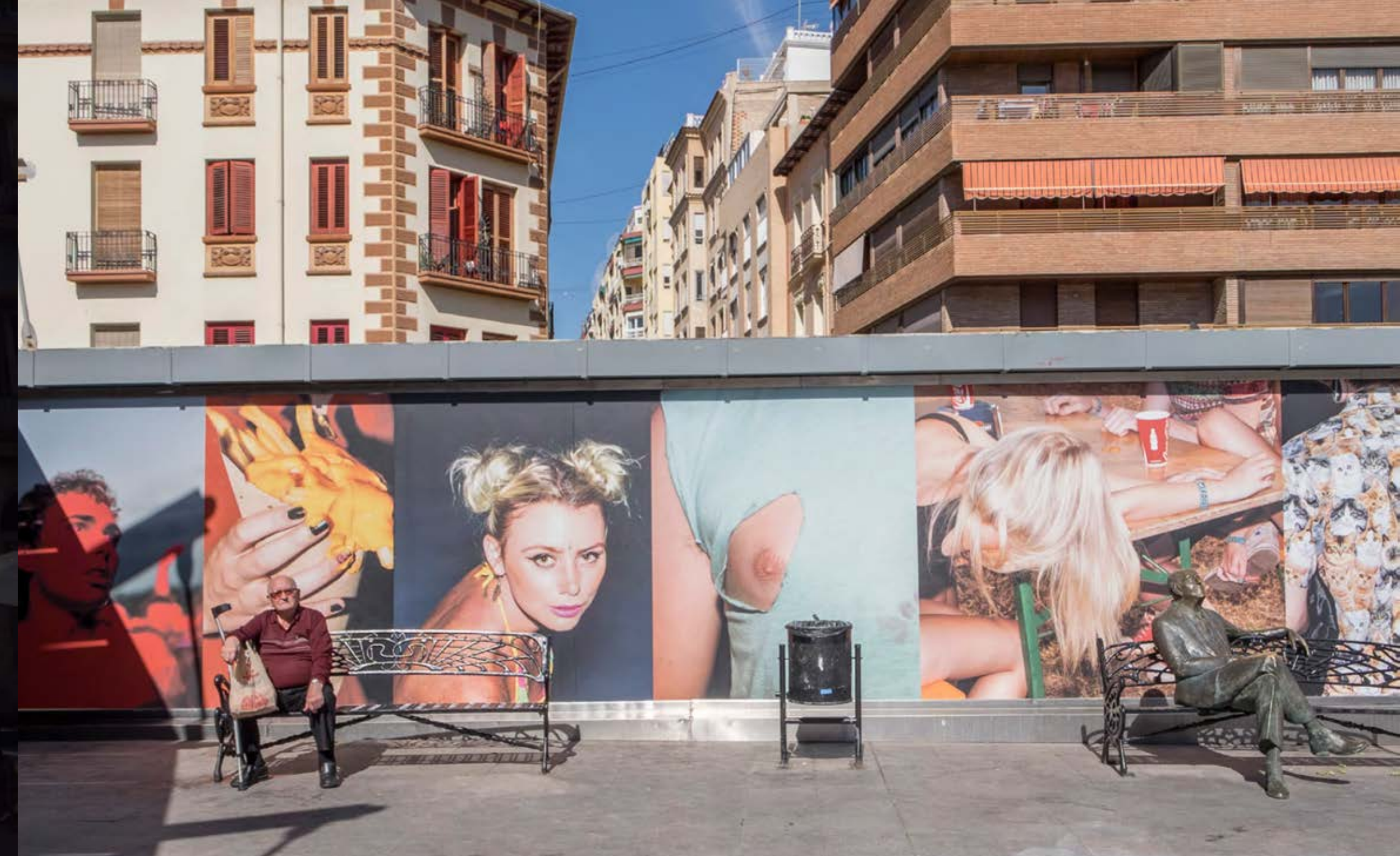
Plaza del mercado Central de Alicante: Marzo de 2016