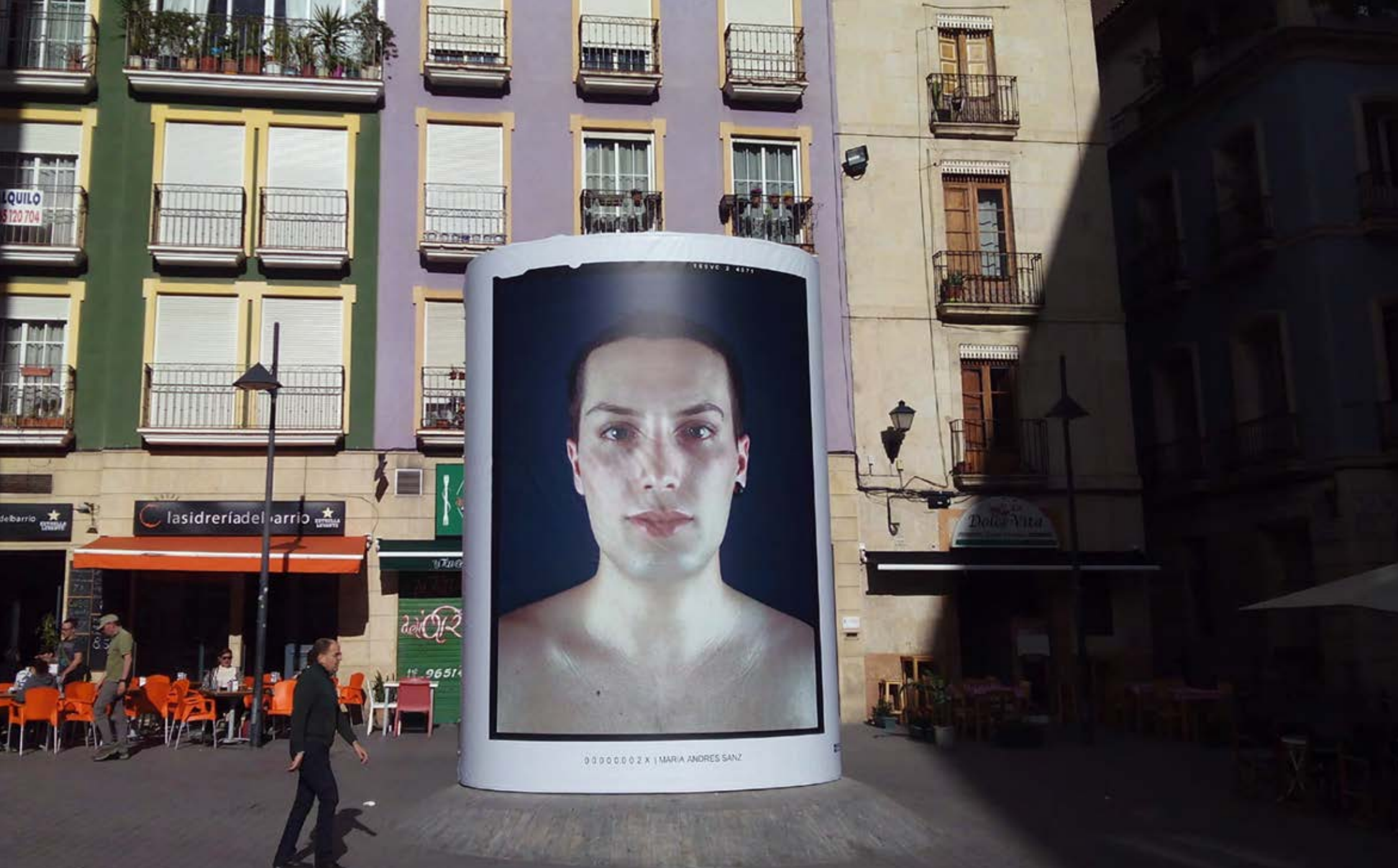
Plaza de San Cristobal: Marzo de 2015