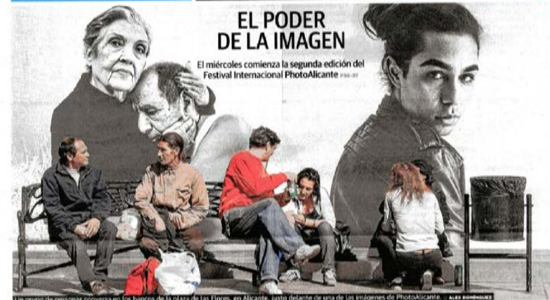
Un grupo de personas conversa en los bancos de la plaza de las Flores, en Alicante, justo delante de una de las imágenes de PhotoAlicante. ALEX DOMÍNGUEZ