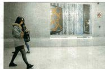
Intervención en la estación del TRAM de Alberto de Pedro, SAN JUAN, PUERTO RICO