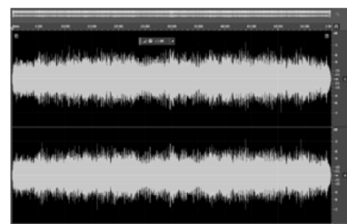
A 9:04 MINUTOS DEL SOL/9:04 MINUTES FROM THE SUN. 2016 VIDEO INSTALACIÓN (PANTALLA TV LED, CONTADOR LED Y AURICULARES)

La obra A 9:04 minutos del sol (9:04 Minutes from the Sun) es un videoarte de 29:59 minutos que explora la vulnerabilidad de la Tierra ante los fenómenos solares, específicamente las llamaradas solares. Utilizando imágenes y sonidos proporcionados por la NASA, la pieza visualiza el tiempo crítico de 9 minutos y 4 segundos que transcurre entre una llamarada solar grave y el posible corte de las telecomunicaciones inalámbricas en la Tierra. Este intervalo representa la frágil ventana de reacción que tenemos antes de que los efectos de una tormenta solar afecten la infraestructura tecnológica global. A través de esta instalación audiovisual inmersiva, la obra invita a reflexionar sobre nuestra dependencia de las tecnologías inalámbricas y la constante exposición a los fenómenos cósmicos que pueden alterar drásticamente nuestra vida cotidiana.