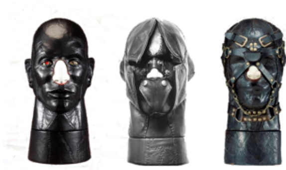
Ilustración 7: Suet, 1977_ Blunt, 1968_TR, 1968. Nancy Grossman. Técnicas mixtas: < https://www.pinterest.es/corkerartist/nancy-grossman/?lp=true >