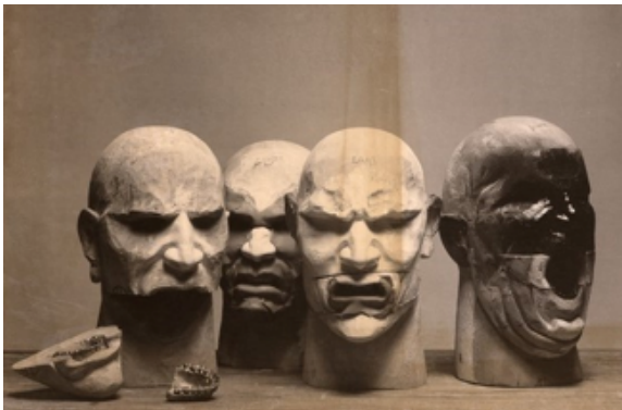
Ilustración 6: Fotografía S/T de Richard Avedon de las cabezas en construcción de Nancy Grossman. 1975.

Las esculturas de Grossman parten de un dibujo previo y de un sentimiento de impotencia y frustración que se concreta en las ataduras, riendas, arneses y bocados que ciñen a las máscaras y que comprimen las emociones y atenazan al deseo. Durante el proceso de creación Grossman esculpe como un cirujano con su escalpelo, haciendo una perfecta disección anatómica del rostro desde la base, el cráneo; las cabezas son talladas en madera, pintadas y pulidas, con prótesis dentales encajadas en sus mandíbulas. En la Ilustración nº 6 vemos el proceso meticuloso de creación de las esculturas. La precisión con la que la artista dota a todas sus figuras con dentaduras, sean visibles o no, nos recuerda que los dientes son el arquetipo psíquico del dolor, una metáfora de impotencia y miedo a la muerte, íntimamente relacionados con las mutilaciones, las puniciones y los pecados de la carne: lujuria y gula.