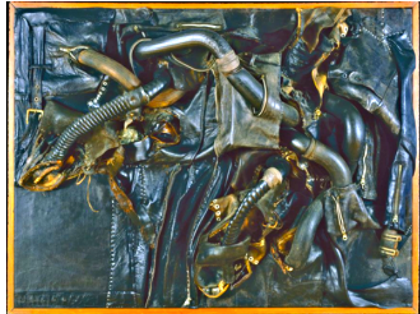
Ilustración 1: Ali Stoker. Ensamblaje de cuero y caucho. Nancy Grossman. 1967.

En la obra Ali Stoker , 1967, vemos un ensamblaje que combina cuero, caucho y metal. La pieza muestra la descripción de un equipo de guerra, o parece como un residuo de un holocausto nuclear en el que se fundió el ser humano y sólo quedan los ineficaces restos protectores. El cuero y las prótesis artificiales de los tubos de respiración de máscaras antigás parecen tráqueas monstruosas de un ser que se ha licuado; todo lo orgánico ha desaparecido, sólo quedan las huellas indestructibles de lo inorgánico. Esta obra recuerda, a nivel formal, a las construcciones de seres orgánicos y metálicos de Giger, a esas mujeres terroríficas que se convierten en el "Alien" de una "especie mortal"