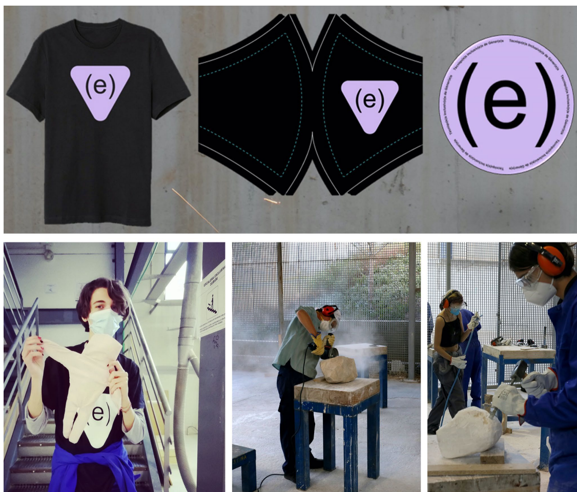
Figura 1. Intervención (e) Tècnicu(e)s Inclusiv(e)s de Gèner(e)s en la Facultad de BBAA de Altea, UMH. Ana grama de imagen corporativa aplicado a productos.

Dada la metodología que se aplicaba al Proyecto de Investigación general de I+D+i, basada en métodos plurales, una combinación de métodos cuantitativos, cualitativos y artísticos, al mismo tiempo se grabó y entrevistó a los estudiantes en base a un cuestionario previo del Proyecto de I+D+i sobre igualdad, discriminación, inclusividad, discapacidad, diversidad sexual, visibilidad y otros aspectos, como si la intervención había cambiado su opinión sobre dichos temas. Estas encuestas se realizaron de forma directa, presencial y online, en la web habilitada a tal efecto, y fue respondido tanto por estudiantes como PDI y PAS y público en general, evaluándose los efectos de la intervención y estableciendo relaciones entre las respuestas de todos los lugares donde se llevó la intervención, estableciéndose como un instrumento para promover actitudes activas para un cambio social.