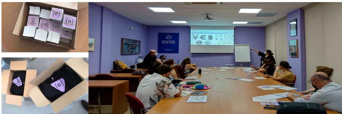
Figura 3. Presentación del Taller de Diseño de Identidad Visual Inclusiva en el Col.legi Major Rector Peset. Valencia.