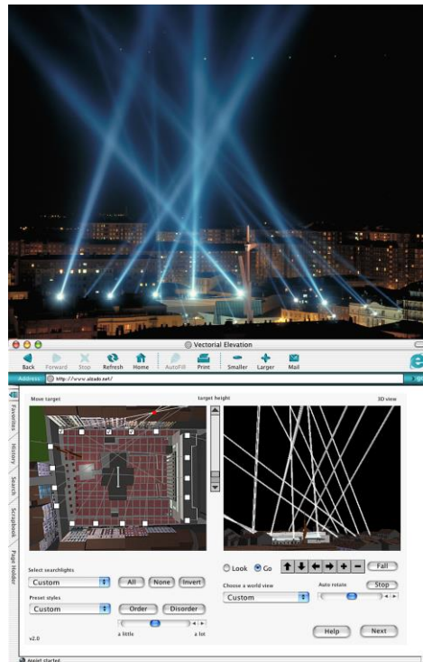
Fig. 3. Alzado Vectorial , 1999. Rafael Lozano-Hemmer. Extraída de la web del autor: http://www.lozano-hemmer.com/vectorial_elevation.php

Otra de las aportaciones fundamentales para la configuración de la ciudad, se la debemos a Marcos Novak, que en su búsqueda de ir más allá en la relación entre la arquitectura y la evolución tecnológica de los años 80, acuñó el término Transarquitectura para referirse a la arquitectura de la transmodernidad, en un intento por proveer una vía de discusión entre la telemática y las posibilidades arquitectónicas que se presentaban. Definición similar a lo que Virilio denominó capa permeable en el entorno urbano, pero con el añadido de la aparición de la red Internet y los avances en la computación. Así, el significado del término de Novak evolucionó hacia una arquitectura interesada en comprender el ciberespacio, su construcción digital por software y datos, y relacionada con los nuevos habitantes, los usuarios o sus avatares.