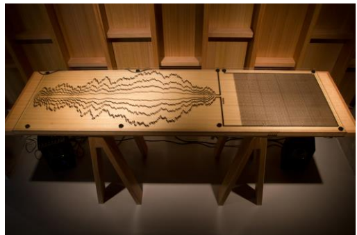
Fig. 8. The SoundWave: Induction drawings . 2012. Haines & Hinterding. http://www.haineshinterding.net/2012/01/01/soundwave-induction-drawings/

También queremos destacar todos aquellos trabajos que hablan sobre los procesos, funcionamiento y características del espectro electromagnético, el comportamiento de las ondas, la propagación de las mismas o sus propiedades, etc. desde un aspecto meramente físico. Con obras como Light bulb, Protrude (Flow) o SoundWave: Induction Drawings .