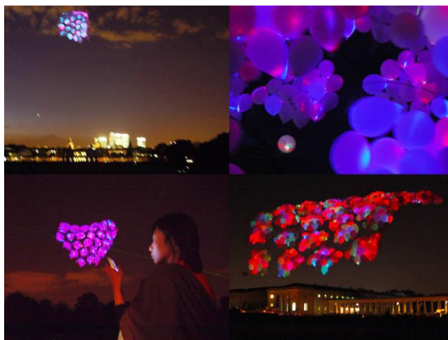
Fig. 5. Sky Ear , 2004. Usman Haque. Extraída de la web del autor: http://www.haque.co.uk/skyear/information.html

Relacionado con los nuevos medios de comunicación (inalámbricos) y con las tecnologías y dispositivos móviles con acceso a Internet, podemos señalar el territorio informacional de André Lemos (Lemos, 2008). Un espacio híbrido, aumentado, compuesto por flujos, donde lo real y lo virtual se cruzan, y donde múltiples espacios locales se mezclan cuando nos adherimos a la red (en movilidad), interconectando los lugares desde donde consumimos y producimos información. Una realidad, que no se puede separar del ciberespacio, puesto que al estar conectados permanentemente, no podemos separar lo online de lo offline . Este autor señala que lo que define a las nuevas redes es la capacidad de los usuarios de producir contenidos en movilidad (hiperlocalización de la información), consumiendo, produciendo e intercambiando información en forma de datos, mientras transitan, caminan o viajan por las ciudades, o entre ellas.