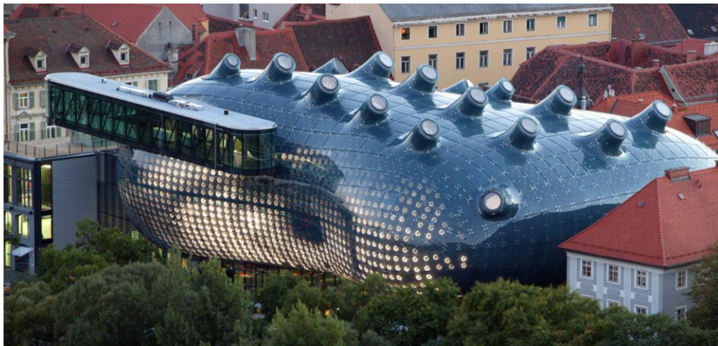
Fig. 4. Bix Electronic Skin en Graz, Austria.

miento configuradas a tiempo real, como el Bix Electronic Skin en Graz (Austria), la Galleria Hall West, en Seul (Korea) o la fachada digital del Medialab Prado en Madrid (España), entre otros muchos.