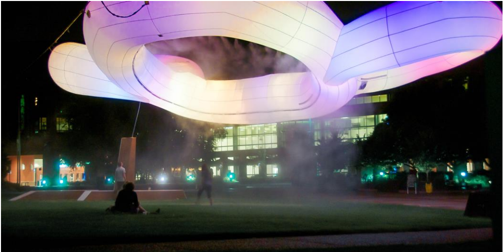
Fig. 1. Mimmi , 2014. Urbain Drc .

trucción o lectura de la obras con sus propios dispositivos, ya que en ocasiones los datos producidos por sus terminales crearán la obra, y en otras, los necesitarán para visualizar y revelar o completar las piezas de los artistas. Un ejemplo de ello es la obra Mimmi (2014), que reaccionaba con cambios de color según el estado anímico de la ciudad, en base a la información volcada por los ciudadanos de la misma vía Twitter.