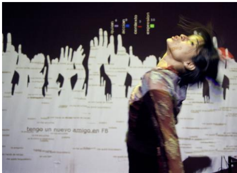
Fig. 7. Before the Beep , 2011. Kònic thtr. http://koniclab.info/es/?project=before-the-beep-2011/

Por otro lado, recogemos aquellas obras que reflexionan sobre la comunicación inalámbrica teniendo conciencia del espacio hertziano, del espectro radioeléctrico utilizado, y que se centran en los mecanismos, usos y posibilidades de la propia tecnología, desde perspectivas comunicacionales y sociales, más bien neutras o positivas, como en Befote the beep, rome to tripoli o Nearness .