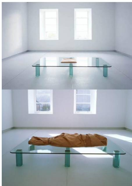
Fig. 9. Shroud/Chrysalis , 2000. Catherine Richards. http://www.fondation-langlois.org/html/e/page.php?NumPage=162

del ciudadano como en: Nodo móvil , Infocalypse Now! , AllFm Tallin , Estonoesinternet , Wifi.Bedouin , Porta2030 , etc; prácticas que nos alertan de los peligros de las radiaciones electromagnéticas: Skrunda Signal , Latvian Electromagnetic pollution , Spectrum Survey , Tempest , etc; piezas que nos protegen de los efectos de las radiaciones: Shroud/Chrysalis y Telepathy ; e intervenciones que tratan la privacidad y el control de dicho espacio: Life: A user's Manual , X.pose , Spam Tower , Yellow chair , etc.