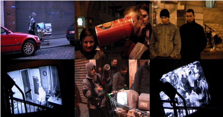
Fig. 2. Life a user's manual , 2003. Michelle Teran.

ciones artísticas, precisamente lo vemos con un sentido activista en la obra de Michelle Teran, life a user's manual (2003), quien equipada con un antena de 2,4Ghz y televisores de tubo, captaba las señales de las cámaras inalámbricas de videovigilancia domésticas en recorridos por las ciudades, y las mostraba en video a tiempo real, comprobando que los límites de la realidad física, no coinciden con los del espacio hertziano.