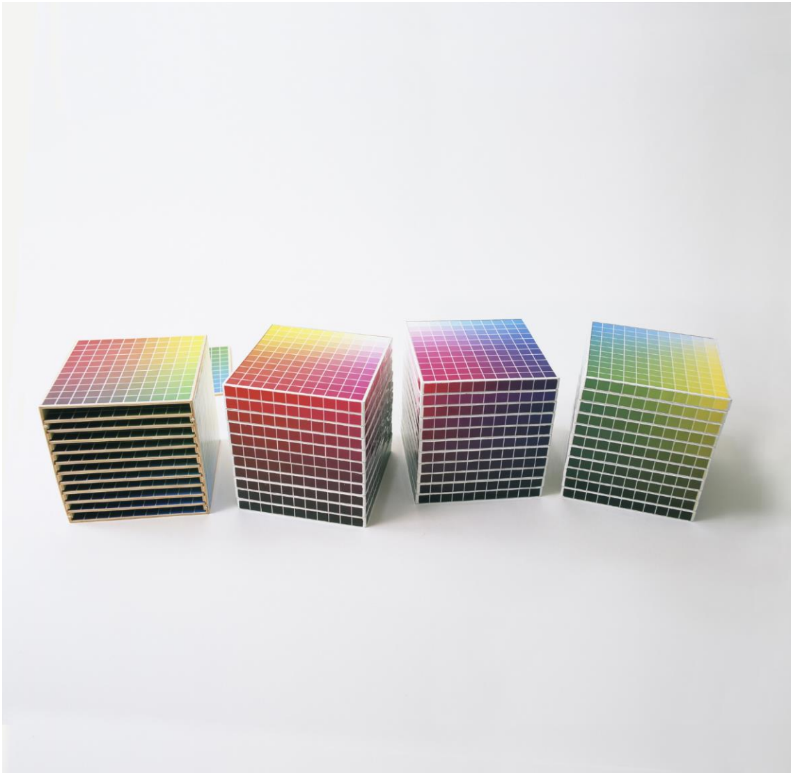
Cuatro despliegues tridimensionales realizados a partir del tratado del color de Harald Küppers. 2006.