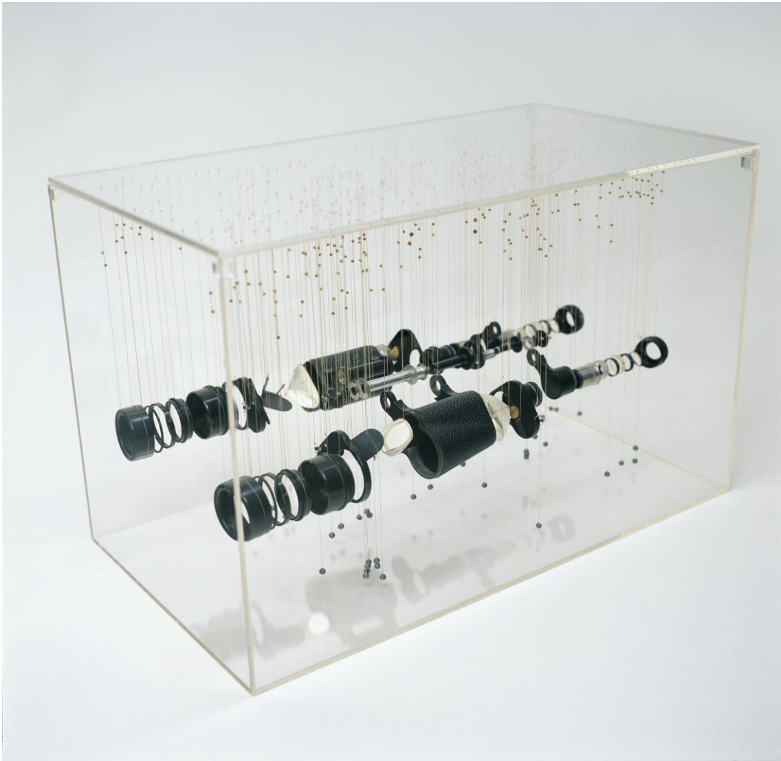
Binoculares prismáticos. 2006.