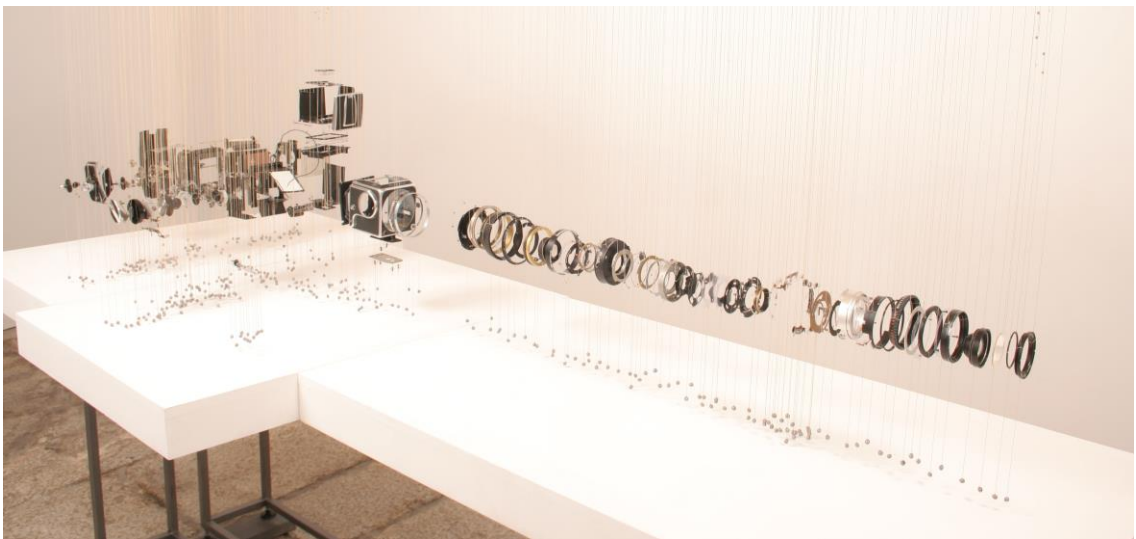
Hasselblad 500 C. 2006.