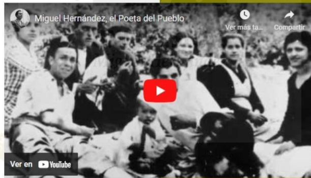
Imagen diapositiva 4.