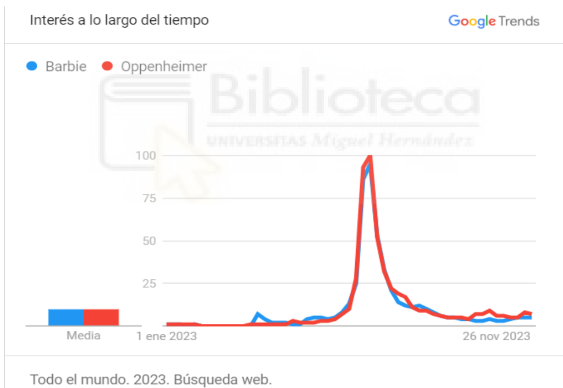
Figura 2. Estadística de búsqueda en todo el mundo de la película Barbie y de Oppenheimer .

Oppenheimer presenta una estética más sobria y sofisticada sobre el padre de la bomba atómica. En cambio, Barbie trata la muñeca más famosa, delgada, rubia, color rosa, etc. Pero los cines han sabido aprovechar este fenómeno ofreciendo al público dobles sesiones para ver ambos largometrajes.