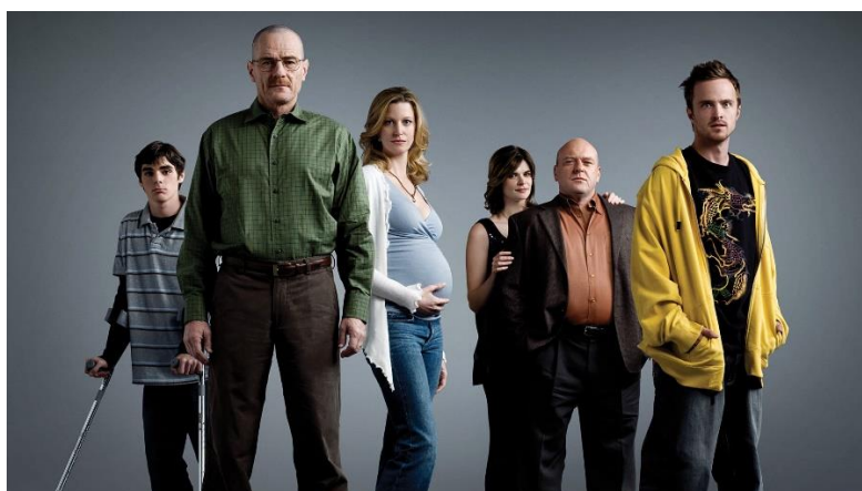
Figura 5: Imagen de la serie Breaking Bad.