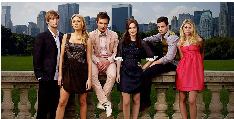
Figura 12: De izquierda a derecha; Nate, Serena, Chuck, Blair, Dan y Jenny en Gossip Girl.