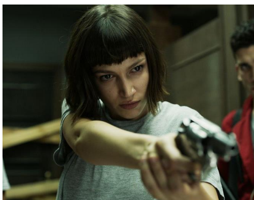
Figura 10: Tokio en La Casa de Papel .

Su nombre real es Silene Oliveira (interpretada por Úrsula Corberó), pero adopta el alias de Tokio para ocultar su identidad. Tokio es una joven que se une al grupo de atracadores liderado por el Profesor, después de perder a su novio en un robo fallido. Con tan solo esta primera escena se adelanta el tipo de relación que gestarán a lo largo de la serie el Profesor y Tokio, cuyo pelo de corta melena con un corto flequillo hace una clara alusión a Portman en su debut cinematográfico a los 13 años en The Professional (1994) donde Mathilda, la protagonista, entabla una relación de mentor-aprendiz con un sicario (Jean Reno) que vive en su edificio en el que fue asesinada su familia.