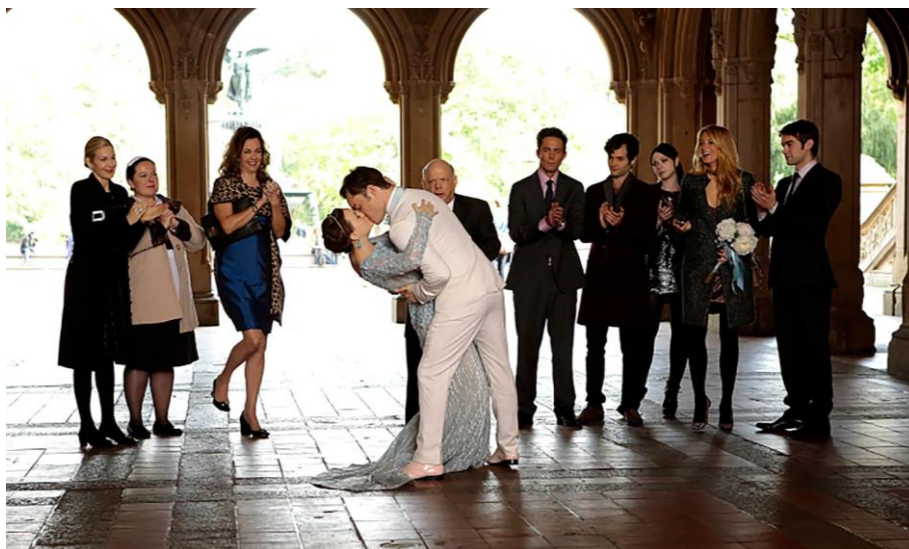
Figura 45: Chuck y Blair se casan, episodio 10.