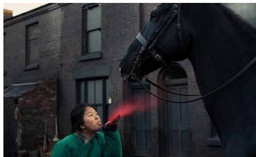
Figura 2: La chica de la ‘buena ventura’ bendiciendo el caballo de Tommy Shelby en los Peaky Blinders.

Thomas Michael Shelby, o más conocido en la serie como Tommy Shelby, es encarnado por el actor Cillian Murphy. Esta obra de Knight despliega un escenario de los años treinta en el que la ley del más fuerte, en este caso las bandas criminales, imperan en la ciudad de Birmingham, con el consentimiento de un cuerpo policial corrupto. Se recrea así un espacio habitual en el que conviven el crimen, las drogas y el machismo (Seal, 2022). En dicho escenario, para Long (2017), Peaky Blinders dota a sus personajes de una profunda complejidad psicológica y humanidad mientras se enfrentan a las secuelas de la guerra y las limitaciones y oportunidades de su entorno. La primera vez que Tommy sale en escena, no pasa desapercibido su inteligencia ni sus intenciones de romper los esquemas de lo establecido. A pesar de que en un clan gitano de la época el que manda sobre la familia es el mayor, en este caso es el segundo, Tommy. En esta primera escena, en la que ya se presumen algunas de las creencias gitanas, Tommy se presenta a lomos de un caballo negro mientras que la gente sale corriendo, lo cual ya indica la importancia y el respeto que impone Tommy. Este lleva el caballo a una chica que dice ‘la buena ventura’ (suerte) para que lo bendiga aprovechando que hay testigos a los que le indica el nombre del caballo y el día que corre para que apuesten por él.