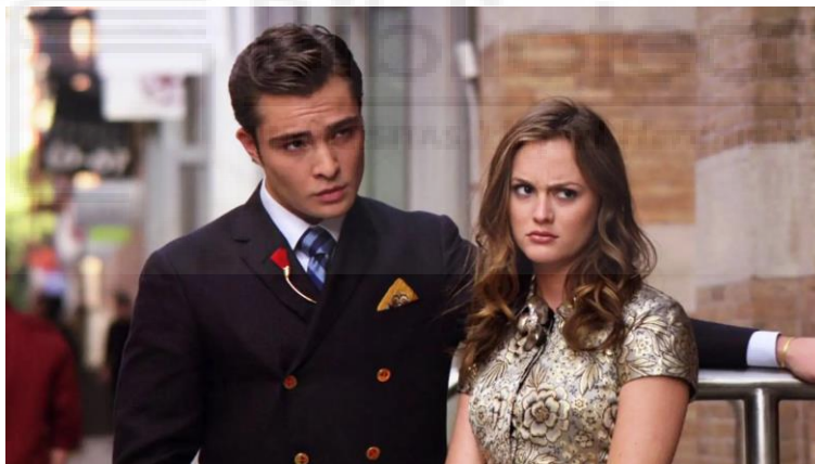
Figura 25: Cambio de look y peinado de Chuck en la temporada 3, episodio 1.