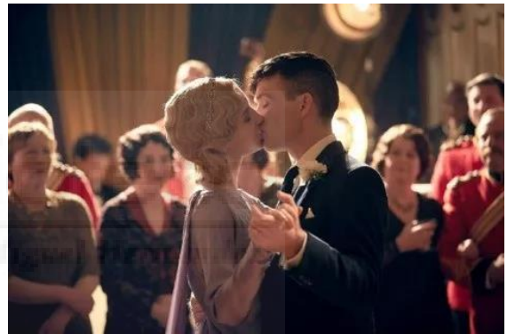
Figura 4: Tommy Shelby en su boda con Grace en Peaky Blinders .