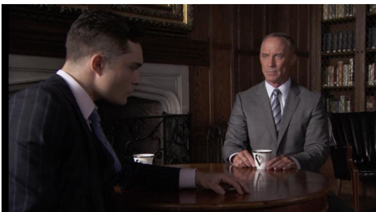
Figura 37: Chuck descubre que su padre está vivo, episodio 22.