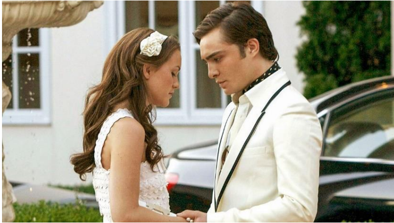
Figura 21: Cuando Blair le pide que admita que la quiere y él no puede, en el episodio 1.