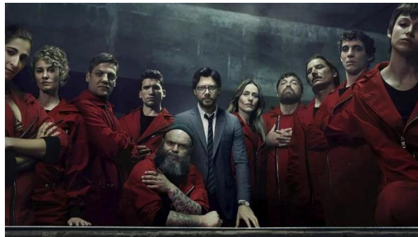
Figura 9: Imagen de la serie.

es el hombre misterioso conocido como ‘el Profesor’. Para llevar a cabo el ambicioso plan de imprimir 2.400 millones de euros sin disparar a nadie, el Profesor recluta a un equipo de ocho personas con ciertas aptitudes necesarias para el atraco y con una vida en la que no tengan nada que perder. Estas personas con nombres de ciudades preparan el plan durante cinco meses hasta el día señalado en el que se encierra en esta durante once días, en los que tienen que lidiar con las fuerzas policiales del Estado y con 67 rehenes. Esta serie ha sido testigo de su éxito internacional, dejando también iconos populares como uno de los miembros del equipo, Tokio.