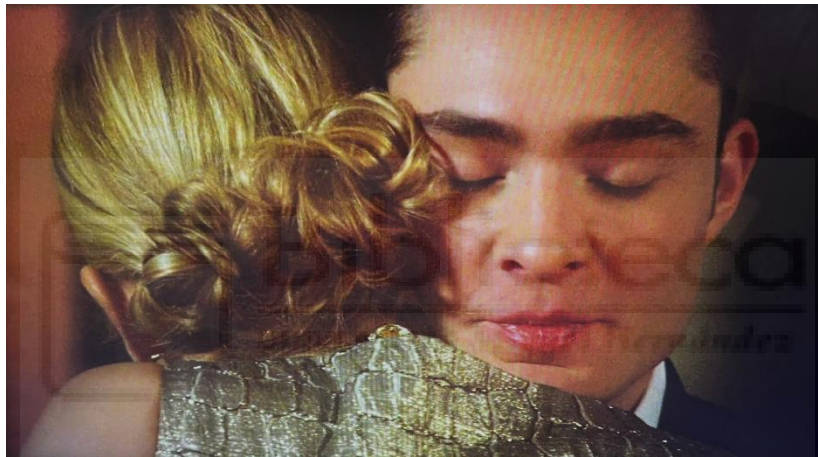
Figura 28: La relación madre e hijo que tienen Chuck y Lily, episodio 20.