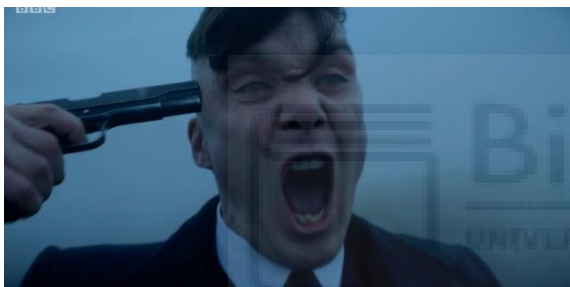
Figura 3: Tommy Shelby en Peaky Blinders .

Tommy Shelby es un personaje redondo lleno de matices y entramados, tanto a nivel conductual como mental. A nivel psicológico, el hecho de haber sido veterano de la primera guerra mundial le ha marcado como persona y a menudo, este protagoniza momentos de debilidad en el que se presentan sus traumas. Estos momentos vulnerables es lo que le hace ser más persona frente a los momentos en los que se muestra un Shelby frío y sin escrúpulos. Por estos matices, Tommy Shelby es un personaje contrastado lleno de realidades que se contraponen y circunstancias que hacen que se comporte de distintas maneras y muy diferentes entre sí; gánster, contrabandista, padre, asesino, amante, familiar...El personaje redondo y contrastado de Tommy Shelby se va moldeando y modificando a medida que le ocurren circunstancias que, aunque no cambian su manera de pensar ni de manejar las situaciones, en muchas ocasiones le llevan a la locura. Sus traumas de la guerra, el asesinato de su mujer (de la que no planeaba enamorarse), el consumo de opiáceos, la muerte de su hija...son circunstancias que a pesar de que nunca deje de pensar en ganar dinero para su familia se convierte en una obsesión y hacen que se vuelva loco de poder, primero por alcanzarlo y luego por sufrirlo.