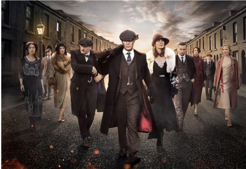
Figura 1: Tommy Shelby rodeado de su familia en la serie Peaky Blinders.