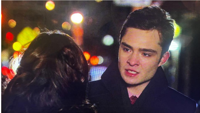
Figura 27: Cuando Chuck descubre que ella no es su madre en el episodio 16.