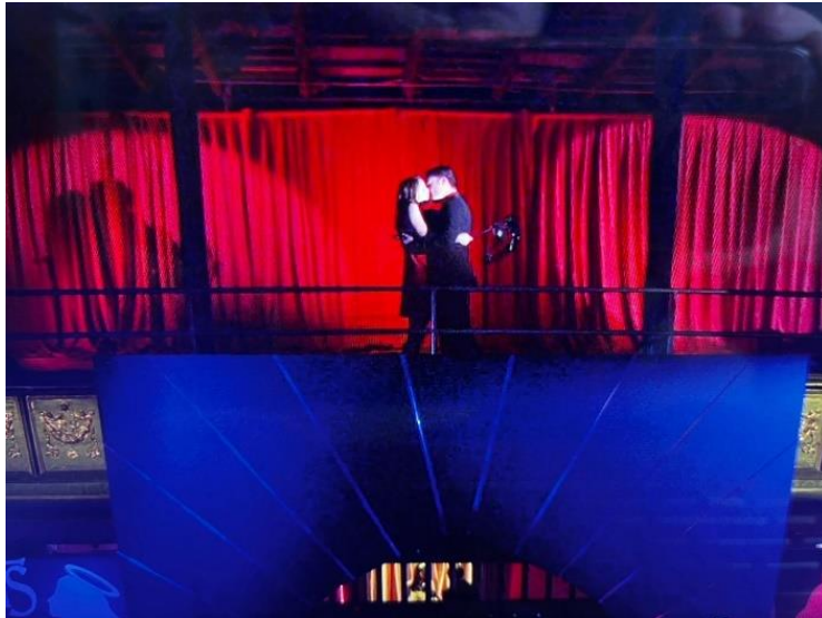
Figura 33: Chuck y Blair cuando les tienden una trampa y deciden hacer público su relación, episodio 9.