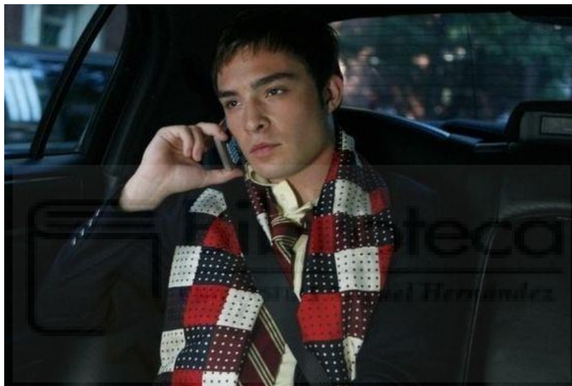
Figura 13: Chuck Bass en la primera temporada con su bufanda recurrente.

Chuck Bass es un personaje icónico en Gossip Girl . Chuck es un joven moreno, con ojos marrones y siempre con una mirada muy profunda. Su apariencia elegante y su porte seguro de sí mismo lo hacen destacar frente al resto de personajes cada vez que entra en acción. Su elegancia puede derivar de su gusto por la moda o de sus trajes a medida, pañuelos y chalecos con su sello distintivo. Estamos ante un personaje que ya se hace diferenciar por las prendas de ropa que, aunque elegantes, en su mayoría de veces son extravagantes. Sin embargo, este tipo de ropa y el pelo alocado le acompañan durante las temporadas en las que Chuck disfruta de la buena música, los cócteles y las fiestas exclusivas, porque su vida nocturna es tan glamurosa como su guardarropa. En esta fase, Chuck se muestra como un personaje cruel, egoísta y sin escrúpulos.