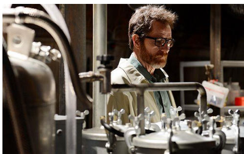
Figura 7: Walter White en el último episodio de la última temporada.

Finalmente, en el último episodio de la última temporada Walter tiene un acto de redención salvando a Jesse de los hombres que le tenían cautivo, pero no es suficiente para borrar todos los crímenes cometidos. Incluso su propio socio, Jesse, huye en coche sin él lo cual es una señal de que ni sus amigos ni familiares permanecen al lado de la persona en la que se ha convertido. En este último episodio, Walter termina desplomado a causa de una herida de bala en su laboratorio, su imperio de la metanfetamina, con la policía llegando de fondo (lo cual deja la duda al espectador de si sobrevive o no). Este final puede interpretarse como una justicia poética para el hombre que pasó de ser un profesor simpático a un poderoso narcotraficante, conocido como Heisenberg, en un viaje donde desafía las nociones convencionales del bien y del mal.