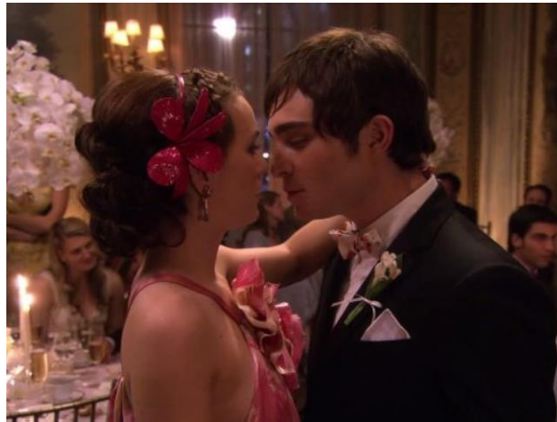
Figura 16: Chuck y Blair en uno de sus primeros besos.

de sus altibajos y rivalidades, su conexión es profunda y apasionada de principio a fin. Blair es la piedra angular del cambio de actitud de Chuck.