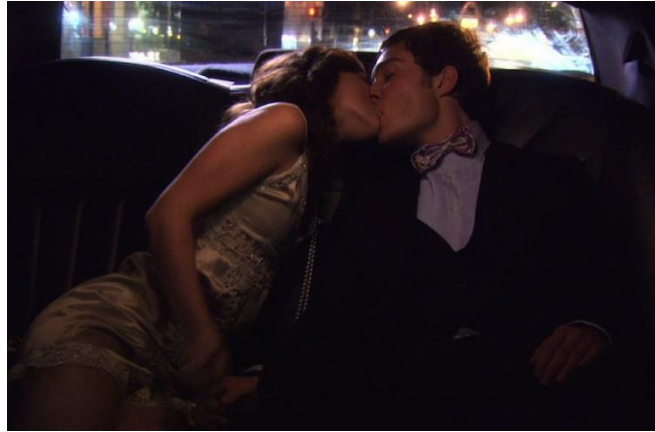
Figura 20: La primera vez que Blair y Chuck se acuestan, en el episodio 7.