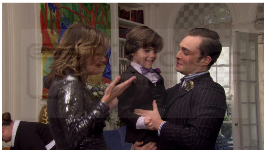
Figura 46: Chuck y Blair tienen un hijo unos años después, episodio 10.