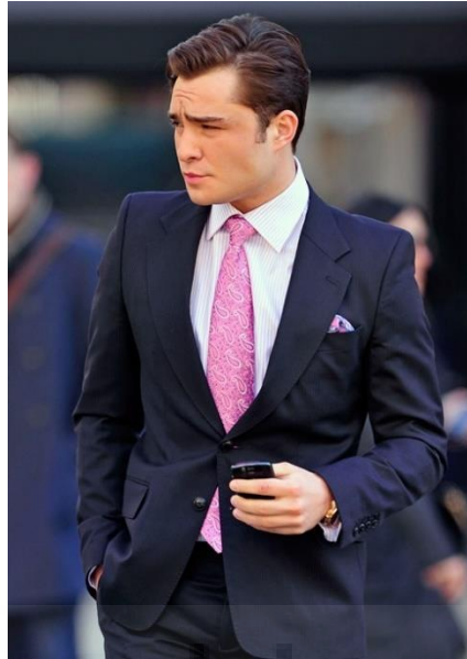
Figura 15: Chuck Bass con su nueva apariencia física a partir de la tercera temporada.

Pero cuando su personalidad se transforma, se puede apreciar un cambio de ropa, en el que ya no se observa su típica bufanda ni esas prendas extravagantes. Con una personalidad más madura, empieza a vestir con trajes menos llamativos (aunque con su toque personal en pajaritas y pañuelos) y otro corte de pelo más peinado.