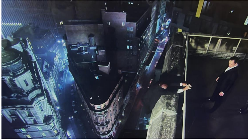
Figura 42: El padre de Chuck se precipita al vacío y este no le ayuda, episodio 9.