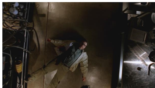
Figura 8: Walter White en el último episodio de la última temporada.