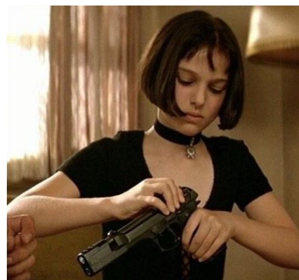
Figura 11: Mathilda en The Professional .