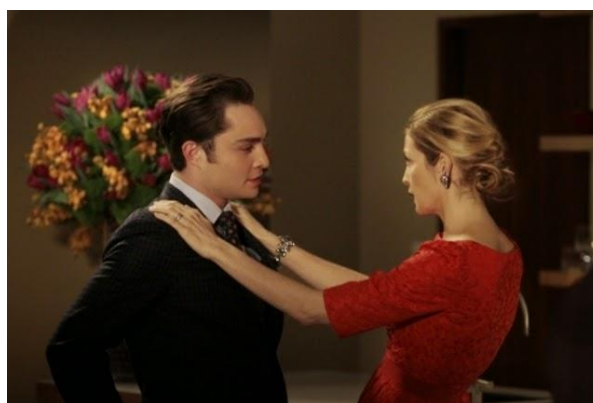
Figura 17: Chuck y Lily en Gossip Girl.

A medida que avanza la serie, Chuck que no conocía lo que era tener una familia de verdad, muestra un lado más suave y sensible, dejándose querer a pesar de lo que su padre le había inculcado. Cuando Lily le ayuda a impedir que el tío de Chuck le robe todos sus negocios heredados por su padre, se da cuenta que Lily no le quería por el compromiso con su padre y que de verdad le aprecia y le quiere ayudar. Se da cuenta que realmente no está solo y se empieza a preocupar por su familia adoptiva, incluyendo a Lily, Eric y Serena.