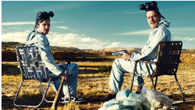
Figura 6: Jesse Pinkman y Walter White en Breaking Bad .

en un mundo inmoral e ilegal del que no hay vuelta atrás, o del que tampoco pretende salir.