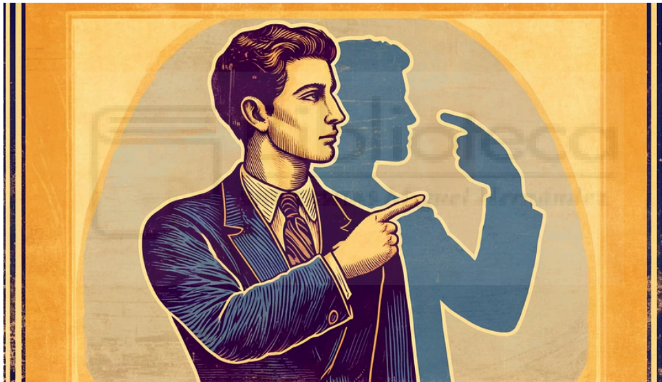
Figura 10: Representación de que el mayor enemigo de un adicto es él mismo.

Bárbara Ruiz , psicóloga general sanitaria, aporta que: “el consumo de pornografía a edades tempranas puede interferir en el desarrollo emocional de los adolescentes y puede llevar a la desensibilización y la búsqueda de contenido cada vez más extremo” . Además, explica que el acceso fácil y temprano a la pornografía mainstream (que tiene un elevado porcentaje de violencia) puede llevar a una concepción distorsionada de las relaciones sexuales y la intimidad, donde la violencia y la falta de consentimiento son comunes. “Los adolescentes que consumen pornografía con frecuencia tienden a replicar lo que ven, normalizando así conductas sexuales de riesgo y violentas” . Esto además, influye significativamente en las relaciones de pareja de los jóvenes con mayor consumo y normalización entre los hombres.