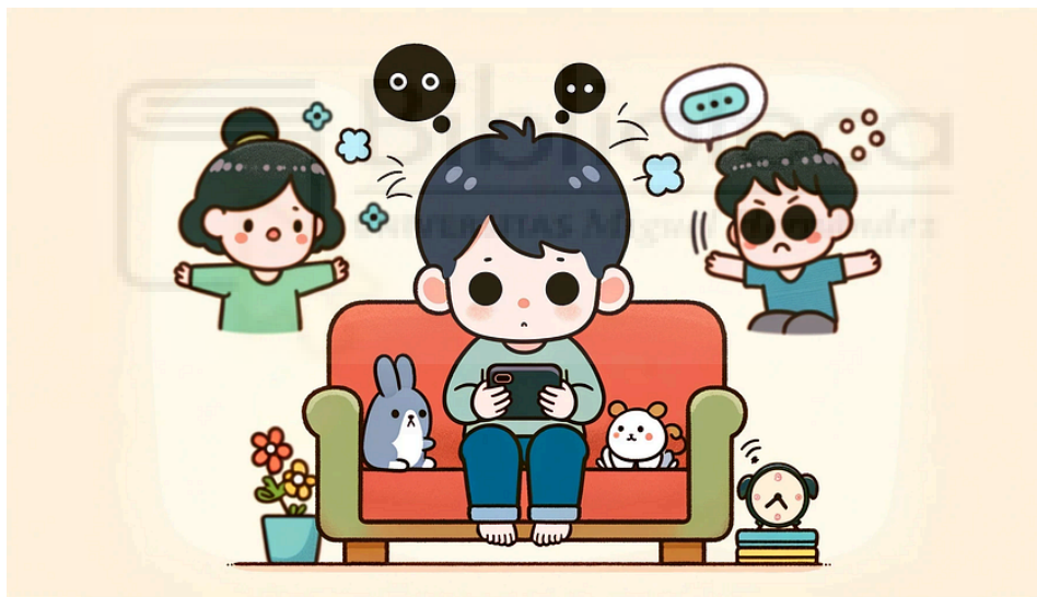
Figura 8: Ilustración representativa de la pérdida de control por el uso de RR.SS.