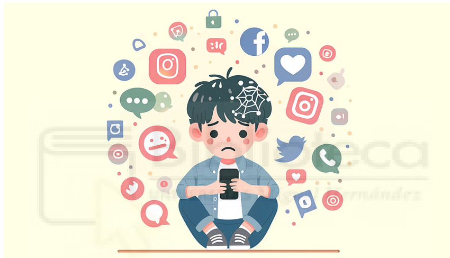
Figura 7: Ilustración sobre el impacto del uso excesivo de las RR.SS en la salud mental de los adolescentes.

“Darle un móvil a un niño de 8 años es como darle también una pistola. Si no sabes usarlo, puede ser muy peligroso”, señala Daniel Lloret psicólogo experto en conductas adictivas