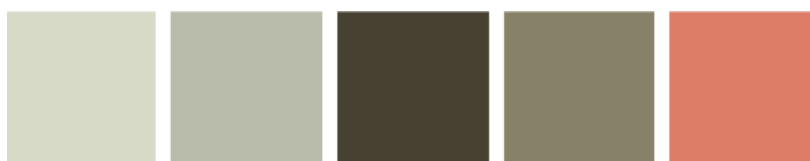
Paleta de colores Hasta el Último Hombre (2016)