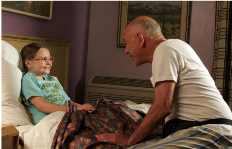
Little Miss Sunshine (Valerie Faris, Jonathan Dayton, 2006)

Especialmente en las escenas que involucran al abuelo Edwin, quien lucha contra la depresión y el fracaso en su vida. El subtono azul de estas escenas también puede asociarse con la sensación de estar perdido o desconectado, reflejando los desafíos emocionales que enfrenta el personaje.