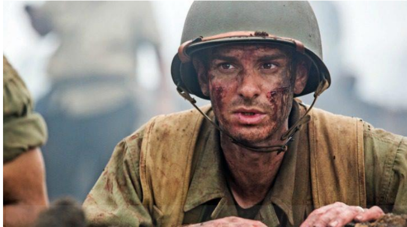
Hasta el Último Hombre (Mel Gibson, 2016)

Por último, el rojo se utiliza de manera destacada en la película para representar la violencia y el sacrificio asociados con la guerra. La sangre derramada en combate se presenta en un tono rojo intenso y vívido, subrayando el horror del conflicto. Asimismo, el ambiente de tonos rojizos que rodea este tipo de escenas puede simbolizar el sacrificio personal y la valentía de los soldados que luchan por la causa y por proteger a sus compañeros.