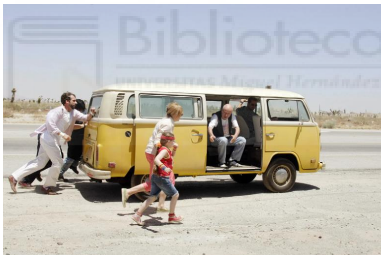
Little Miss Sunshine (Valerie Faris, Jonathan Dayton, 2006)

El color amarillo se destaca como uno de los principales a lo largo de la película, utilizándose como un símbolo de esperanza y unión para la familia Hoover. El viejo furgón Volkswagen amarillo que utilizan para viajar juntos hacia el concurso de belleza de Little Miss Sunshine se convierte en un ícono de su unidad y solidaridad, a pesar de las dificultades que enfrentan. Este color también refleja la determinación de la familia para alcanzar sus sueños y apoyarse mutuamente en el proceso.