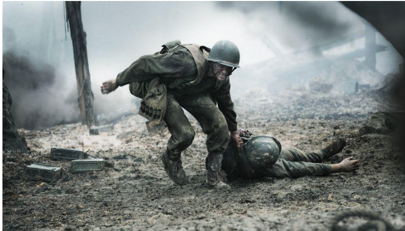
Hasta el Último Hombre (Mel Gibson, 2016)

marrón, evocando un ambiente sombrío y opresivo. Estos colores reflejan la brutalidad y desolación de la guerra, sumergiendo al espectador en la desesperación y el caos del campo de batalla. Los tonos apagados y terrosos hacen que el horror y la devastación sean más palpables, subrayando la atmósfera de muerte y destrucción.