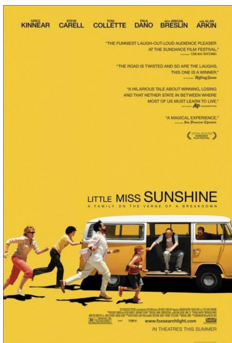
Cartel Little Miss Sunshine (Valerie Faris, Jonathan Dayton, 2006)