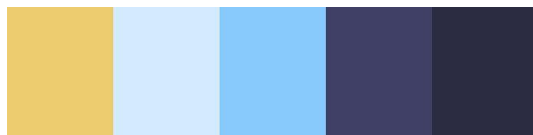
Paleta de colores Bluey (2018)