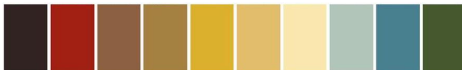
Paleta de colores Little Miss Sunshine (2006)