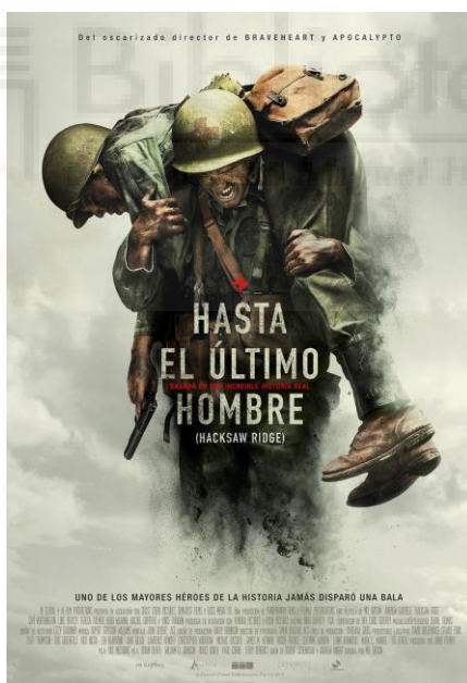
Cartel Hasta el Último Hombre (Mel Gibson, 2016)