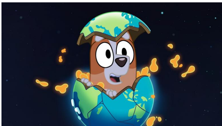
Bluey (Joe Brumm, 2018), Capítulo 'A dormir' - Temporada 2, episodio 26