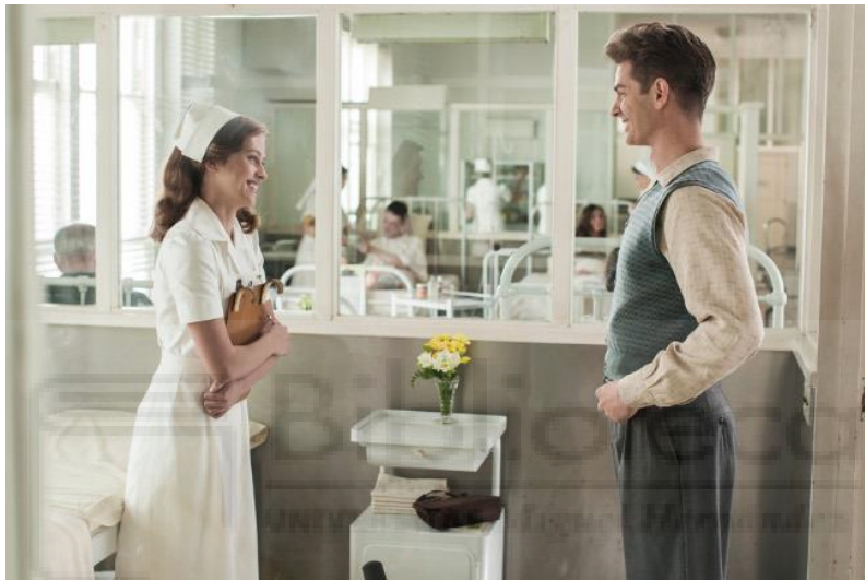
Hasta el Último Hombre (Mel Gibson, 2016)

Además, en este filme, las escenas de amor entre Desmond Doss y su esposa, Dorothy Schutte, proporcionan un contrapunto emocional a la intensidad y brutalidad de la guerra. Estos momentos no sólo exploran el vínculo romántico entre los dos personajes, sino que también destacan la importancia del amor y el apoyo emocional en medio de circunstancias extremas. Las escenas de amor están impregnadas de calidez y ternura, y se caracterizan por una paleta de colores suaves y luminosos , en contraste con los tonos más oscuros y sombríos que dominan las escenas de batalla, como ya se ha mencionado.