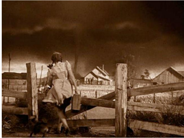
El Mago de Oz (Victor Fleming, 1939)