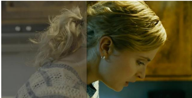
Color grading o corrección de color en una pieza.

tomado de ejemplo para visualizar el antes y el después del tratamiento del color de una pieza audiovisual.