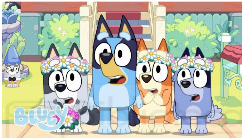
Bluey (Joe Brumm, 2018)

La primera razón de la elección del color azul es que el personaje está inspirado en los “blueys”, una raza de perros ganaderos australianos que se da en las antípodas y que se conocen con ese término por el tono de su pelo.