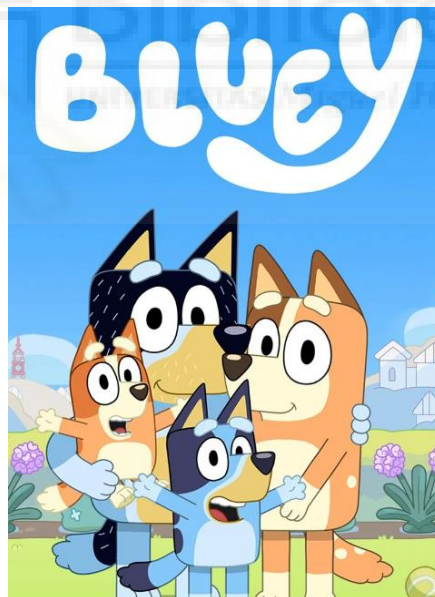
Cartel Bluey (Joe Brumm, 2018)