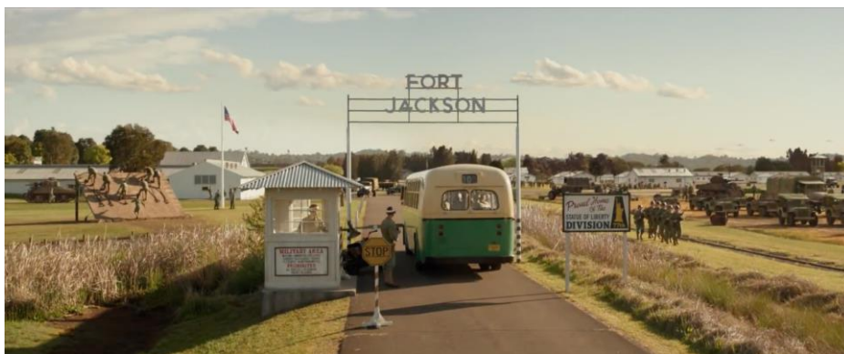
Hasta el Último Hombre (Mel Gibson, 2016)

Sin embargo, las escenas que retratan la vida de Desmond Doss fuera de la guerra están imbuidas de colores más cálidos y brillantes, como verdes y azules. Por ejemplo, los flashbacks a la vida de Doss en su hogar rural en Virginia están llenos de verdes exuberantes y cielos azules claros, simbolizando su conexión con la naturaleza y sus valores pacíficos.