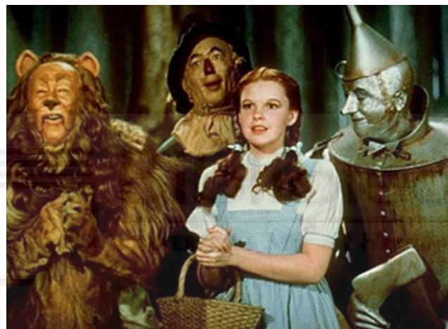
El Mago de Oz (Victor Fleming, 1939)