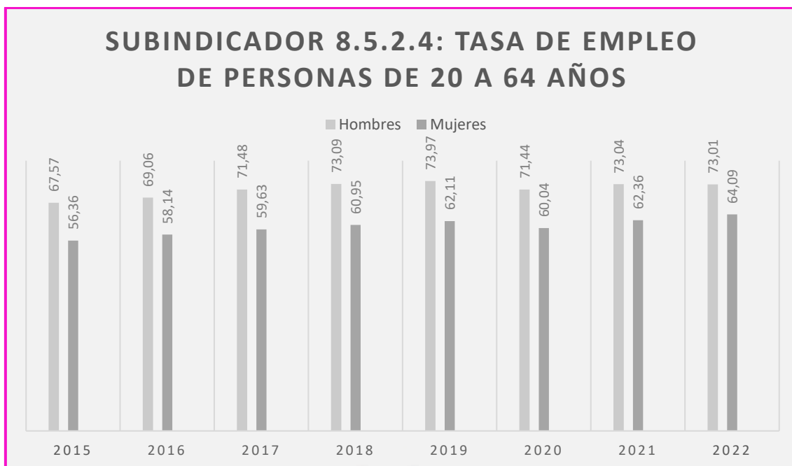
Gráfica 2: Elaboración propia a partir de información del INE (Tasa empleo).

A continuación, se muestra una gráfica del Instituto Nacional de Estadística de la Tasa de Empleo de personas de 20 a 64 años (Hombres y Mujeres) desde el año 2016 al 2022. Se observa que la tasa de actividad de los hombres supera a la de las mujeres.