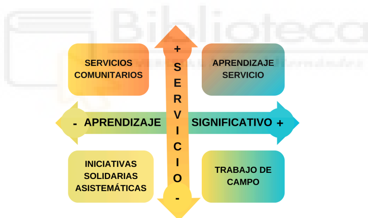
Imagen 2: categorías de aprendizaje-servicio. De elaboración propia

Los proyectos de ApS son muy versátiles pero existen 4 tipos según el grado de aprendizaje y servicio que abarque . La forma en la que se preste más aprendizaje y menos servicio y viceversa, es lo que nos da estas 4 categorías (imagen 2).