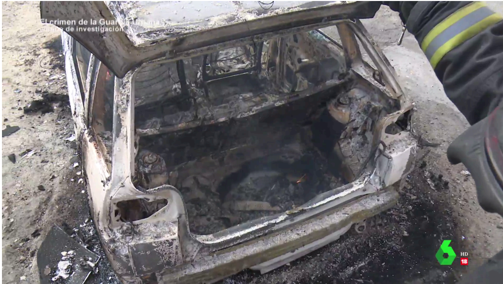
Imágenes oficiales del coche calcinado.