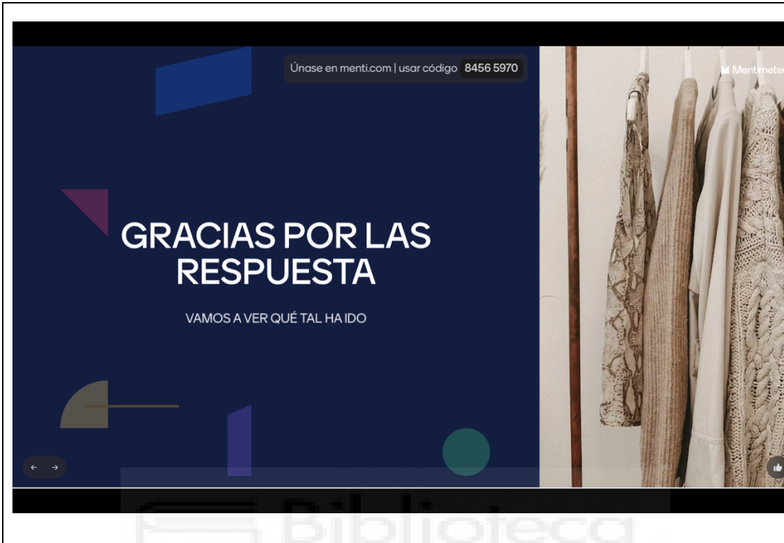
Fuente: Tabla 12 de elaboración propia.