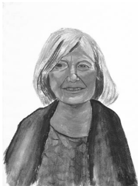
Vidas no contadas. 40 x 30 x 1,5 cm. 2024. Fig.2