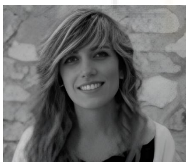
Fotografías. Fig. 8

“Pinto porque es una forma de expresar sentimientos y sensaciones. Y al pintar siento placer.