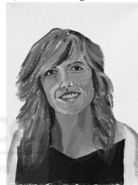
Vidas no contadas. 24 x 18,5 x 1,5 cm. 2024. Fig.8