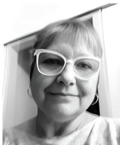
Fotografías. Fig. 3

“No pinto, sino que hago trabajo textil. Me encanta hacerlo sin necesidad ninguna.