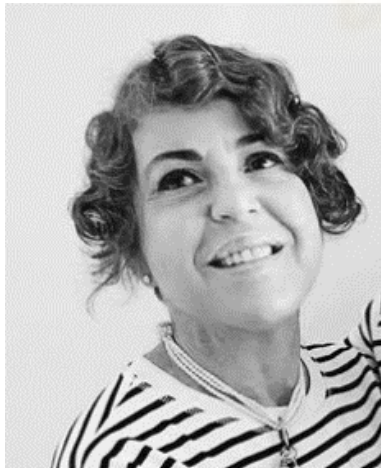
Fotografías. Fig. 6

“Adoro la pintura desde un punto de vista formal lo que me impulsa a generar arte en la misma. Actualmente siento desasosiego porque no consigo lo que quiero con esta disciplina, pero es edificante y forma parte del proceso.