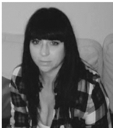
Fotografías. Fig. 7

“Me encanta pintar. Se me pasan las horas sin darme cuenta y siento mucha paz.