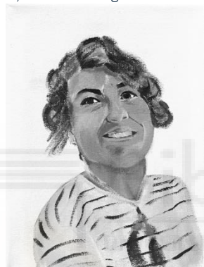
Vidas no contadas. 24 x 18,5 x 1,5 cm. 2024. Fig.6