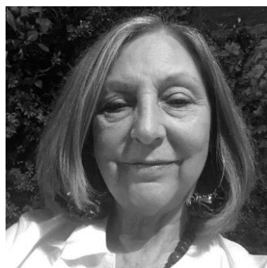
Fotografías. Fig. 4

“Me gusta pintar. Me sumerjo en mi mundo.