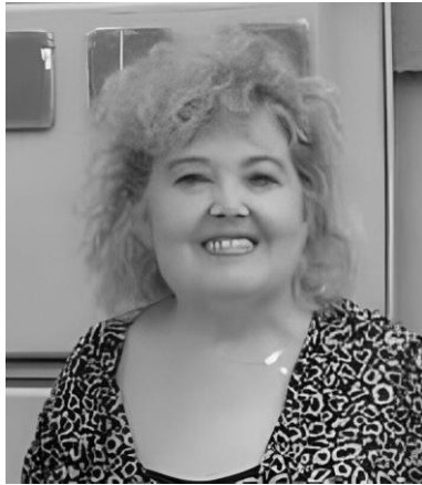
Fotografías. Fig. 5

“Para mí el arte es una maravilla de ver ...y un hobby. El arte es un don que se nace con él.