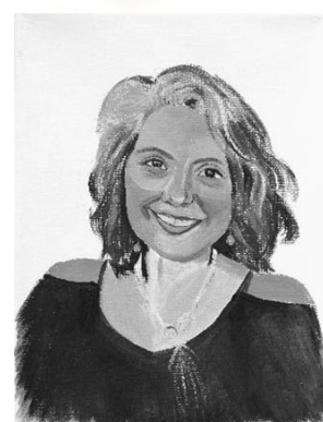
Vidas no contadas. 24 x 18,5 x 1,5 cm. 2024. Fig.10