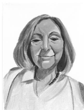
Vidas no contadas. 24 x 18,5 x 1,5 cm. 2024. Fig.4