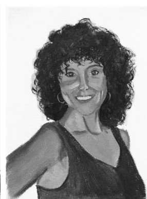
Vidas no contadas. 24 x 18,5 x 1,5 cm. 2024. Fig.11