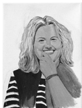
Vidas no contadas. 24 x 18,5 x 1,5 cm. 2024. Fig.13