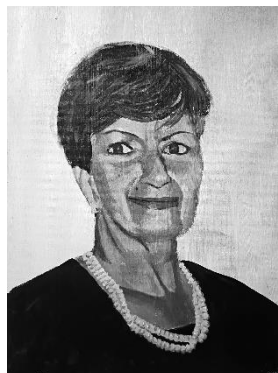
Vidas no contadas. 40 x 30 x 1,5 cm. 2024. Fig.1

En vez de utilizar fotografías de las artistas, se ha optado por pintar en lienzo utilizando acrílico blanco y negro, un retrato de cada una de ellas, como forma de honrar su pasión por el arte y la pintura.