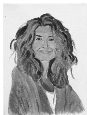
Vidas no contadas. 24 x 18,5 x 1,5 cm. 2024. Fig.9