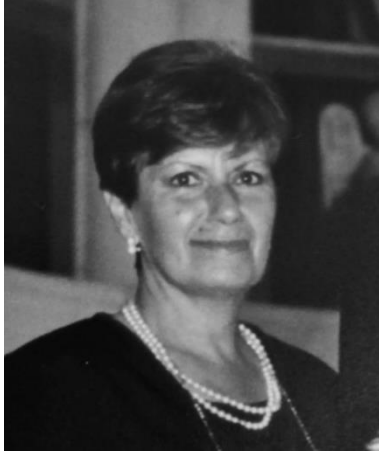
Fotografías. Fig. 1

Mi abuela fue mi inspiración y gran referente en el mundo de la pintura. Aunque falleció teniendo yo diez años, ver sus cuadros por toda mi casa y en las casas de mis tíos me hizo sentir una gran atracción por el arte y a pintar como ella. Gracias a mi abuela me inicié en el mundo de las Bellas Artes y este trabajo se lo dedico a ella y a todas las mujeres que pintan por pasión.