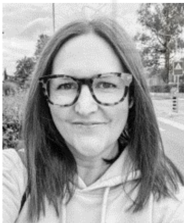
Fotografías. Fig. 14

“He empezado por el dibujo, lo hago porque soy profesora y tengo que dar la asignatura de artes en inglés, y me gustaría aprender a dibujar mejor para poder enseñar mejor a los niños, a parte también de gustarme e interesarme. Además, el arte es un arma muy potente para enseñar y transmitir ideas a los niños. Al pintar no siento liberación, me fuerzo a romper mis miedos y utilizarlo como reto.