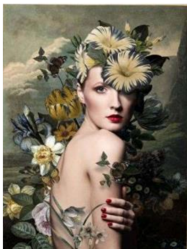
The narrow-leaved Kalmia Collage digital sobre aluminio, 100 x 75 cm, 2020

Teresa Cucala, artista especializada en collage, trabaja la figura femenina en su obra inspirada en la fotografía de moda antigua donde busca elementos de época para componer su obra.