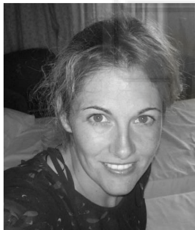
Fotografías. Fig. 12

“El arte es una forma de evadirse de las obligaciones del día a día, poner el cerebro en modo relax y fluir.