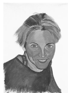
Vidas no contadas. 24 x 18,5 x 1,5 cm. 2024. Fig.12