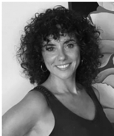
Fotografías. Fig. 11

“Pinto porque me hace feliz. Porque me sirve para expresar lo que siento.