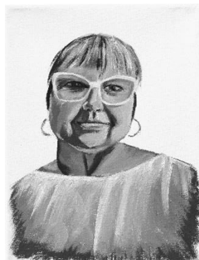
Vidas no contadas. 24 x 18,5 x 1,5 cm. 2024. Fig.3