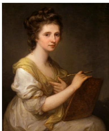
Angelica Kauffmann Óleo sobre lienzo, 73,7 cm x 61 cm (1770-1775)

Fue una pintora suiza del siglo XVIII que alcanzó gran éxito en una época en la que era inusual para las mujeres ser reconocidas como artistas profesionales.