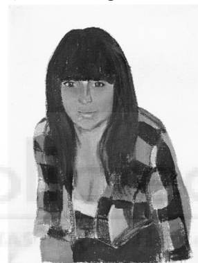
Vidas no contadas. 24 x 18,5 x 1,5 cm. 2024. Fig.7