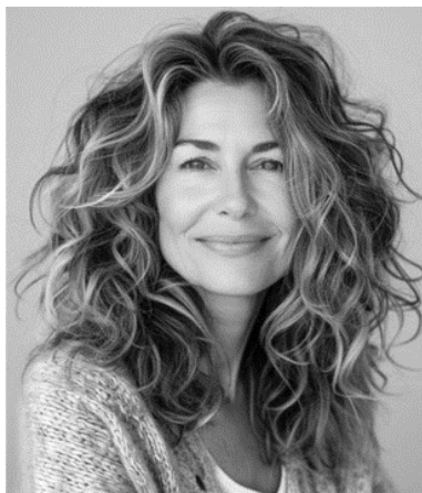
Fotografías. Fig. 9

“Pintar y dibujar me hace sentir bien, es como una meditación y un reto. Siento paz, me enfoco en mi trabajo y a veces me enfado porque no me sale bien, es una meditación y estoy presente en lo que estoy haciendo.