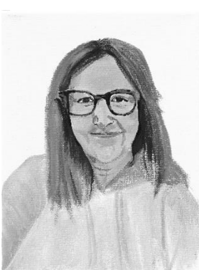
Vidas no contadas. 24 x 18,5 x 1,5 cm. 2024. Fig.14