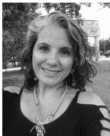
Fotografías. Fig. 10

“Pintar es muy relajante y un sentimiento muy bonito y me encanta. A veces es difícil, pero también es relajante.