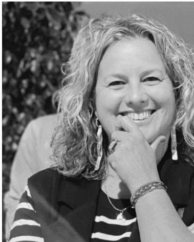
Fotografías. Fig. 13

“Pinto por aprender. Me desconecta del momento.