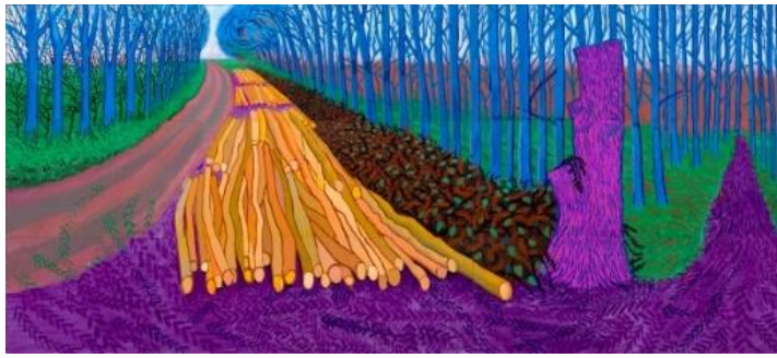
Fig.1: David Hockney Madera de invierno , (2009) Óleo sobre 15 lienzos lienzos.108*240cm.

Malika Favre ha sido mi referente en cuanto al diseño. Tintas planas, simplicidad en la paleta cromática y también la manera en la que cómo trabaja con el positivo y negativo de los colores. Sus diseños siguen un mismo patrón, que lo encuentro muy atractivo a la hora de realizar los bocetos. En esta línea incluyo a Tom Haugomat. A diferencia de Malika, su estilo es más delicado y su paleta de color no es tan reducida. Ha trabajado para libros, cortometrajes y también en revistas como Malika. Esto me ayuda bastante a la hora de ilustrar con texto acompañado.