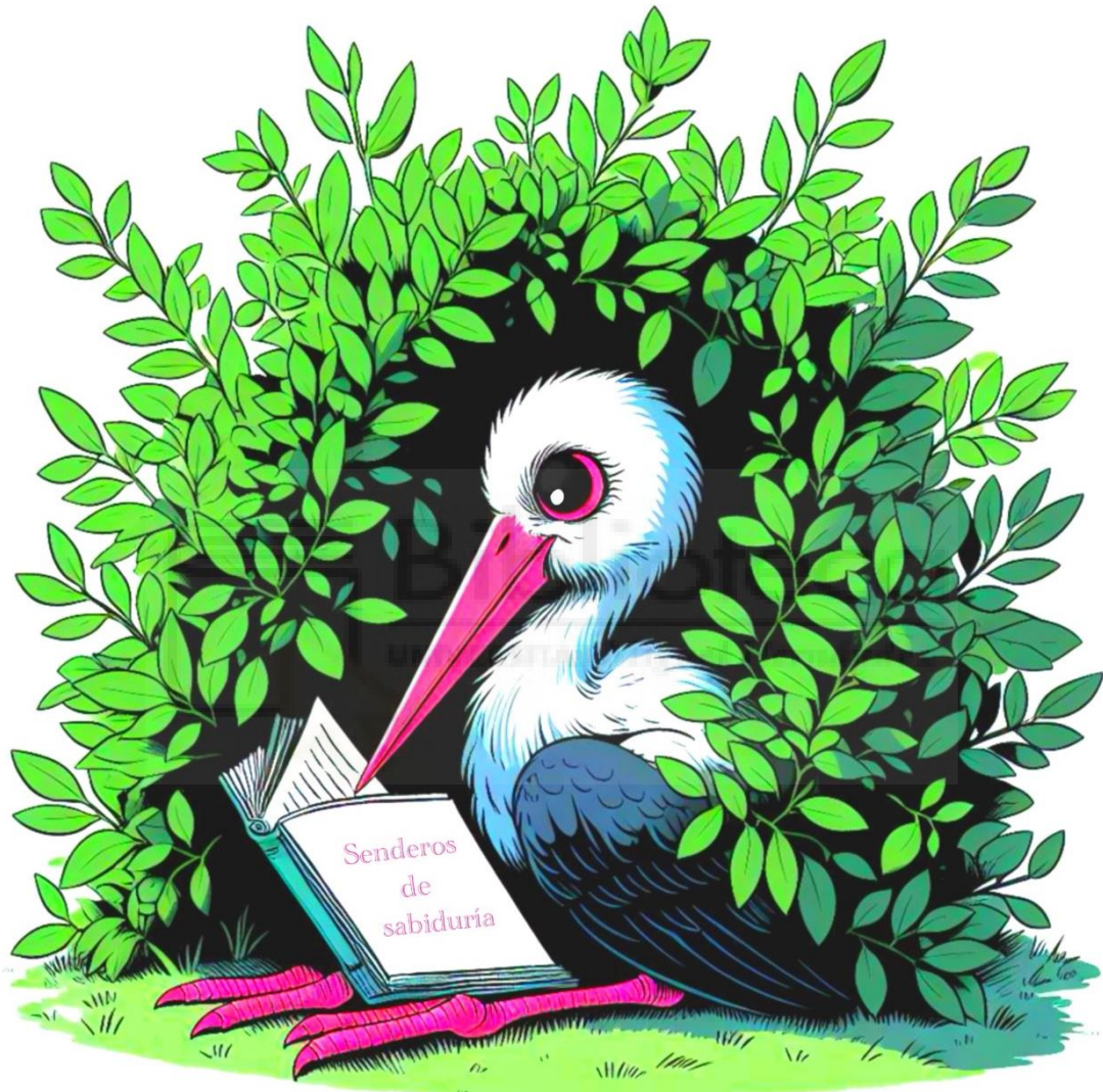
Fig. 11: Aria a color. Ilustración digital Procreate. 300ppp A5.