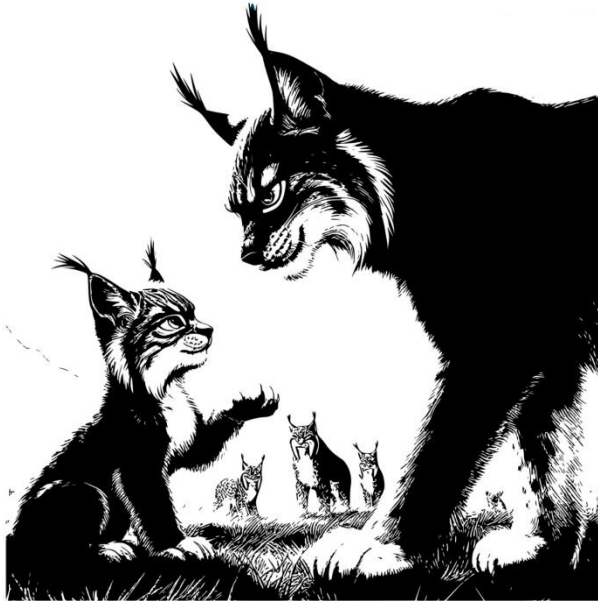
Fig.6: Boceto lince ibérico, Sasha.

En este boceto, el protagonista que es el de la izquierda, se enfrenta a su hermano mayor, Azrael. De fondo el resto de su especie. Grandes manchas negras en primer plano para contrastar.