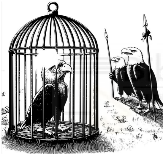
Fig. 7: Águila imperial/perdicera Enjaulada, Nerón.

En este boceto, el protagonista que es el de la izquierda, se enfrenta a su hermano mayor, Azrael. De fondo el resto de su especie. Grandes manchas negras en primer plano para contrastar.