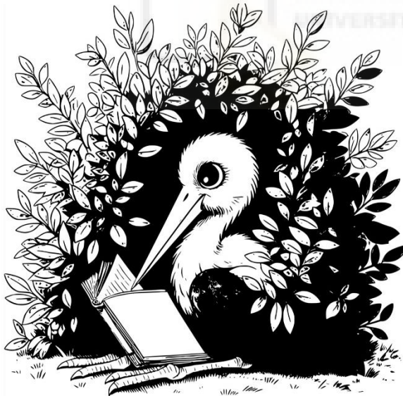
Fig.5: Boceto cigüeña negra, Aria.

A continuación incluyo los demás personajes del libro.