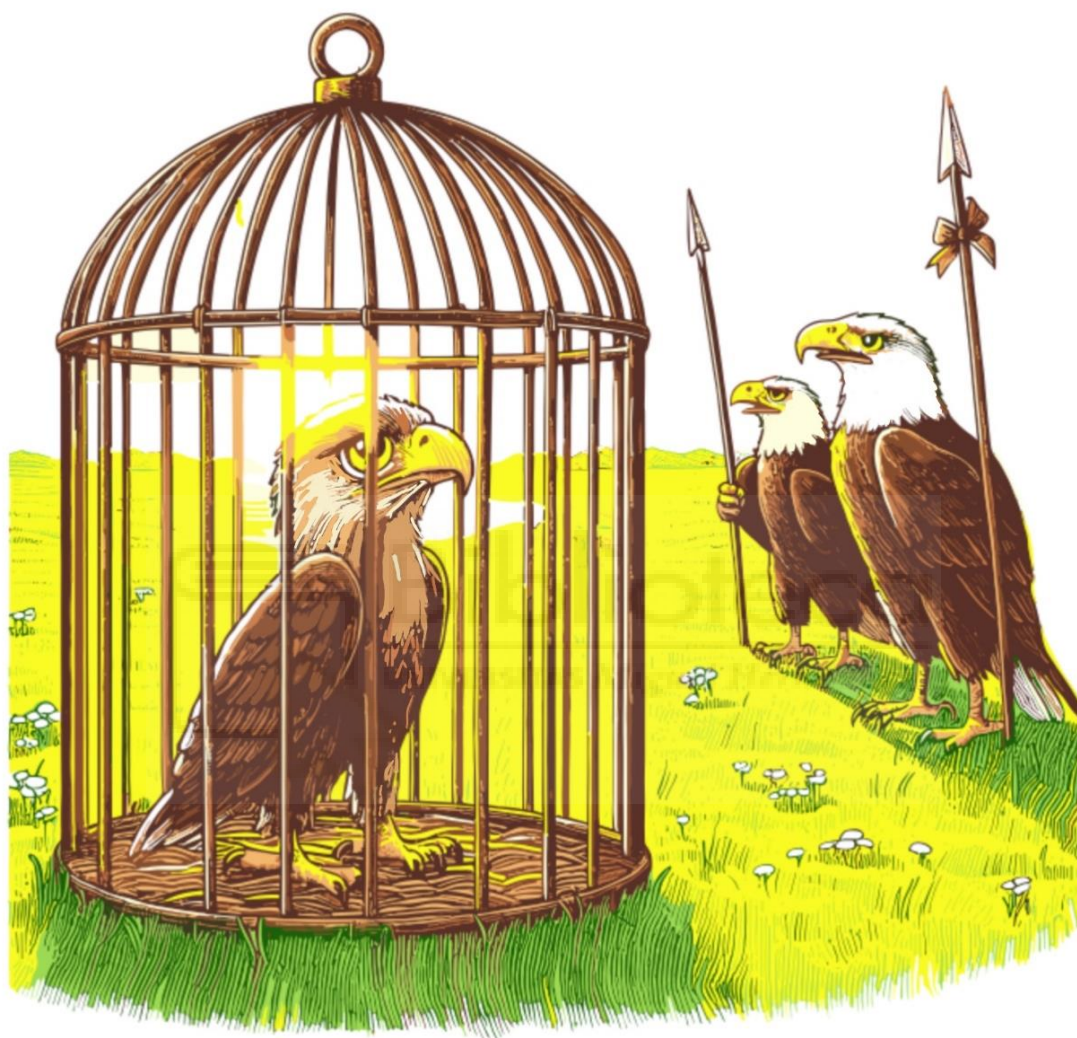
Fig. 13: Nerón a color. Ilustración digital Procreate. 300ppp A5.