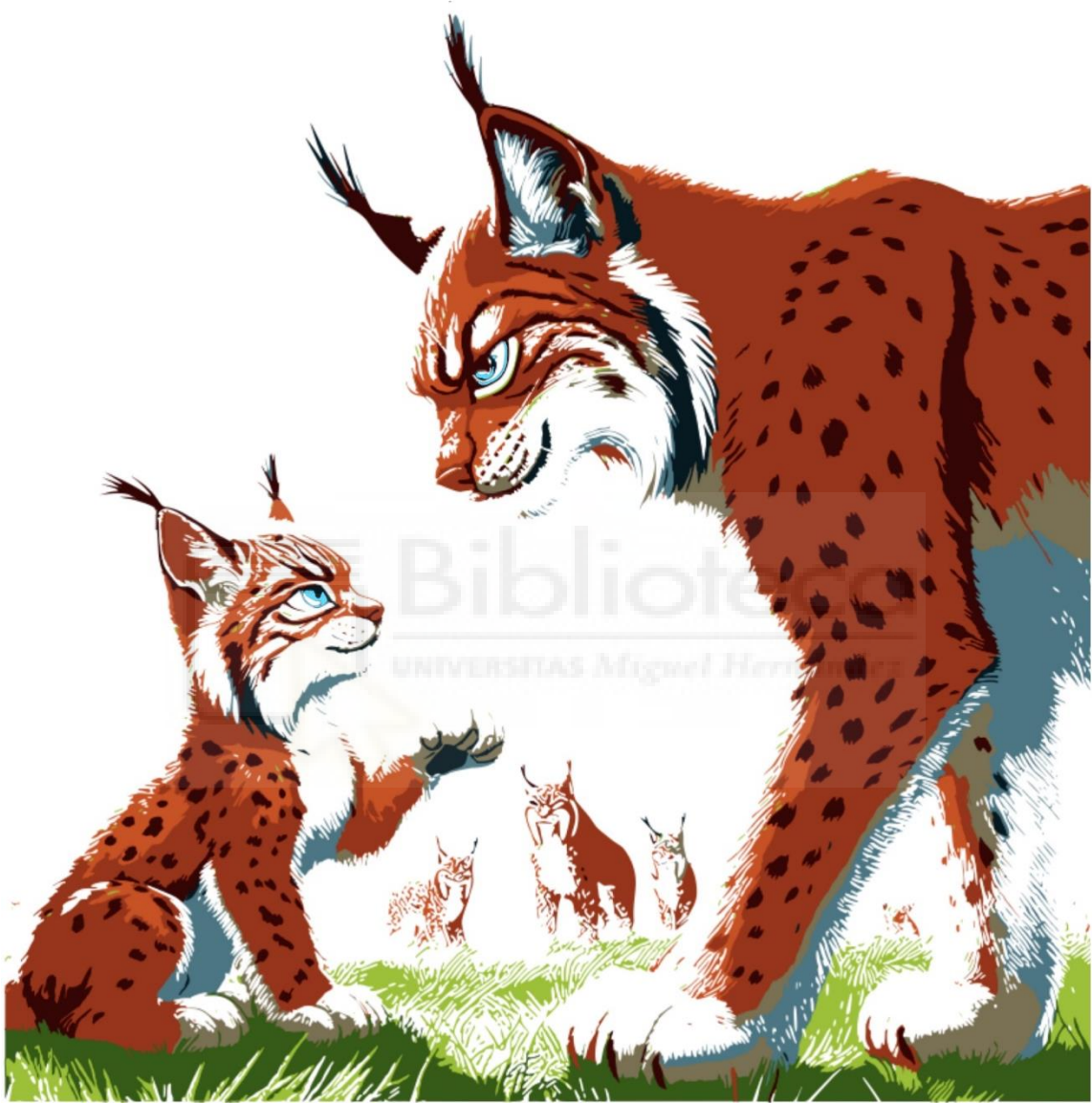
Fig. 12: Sasha a color. Ilustración digital Procreate. 300ppp A5.