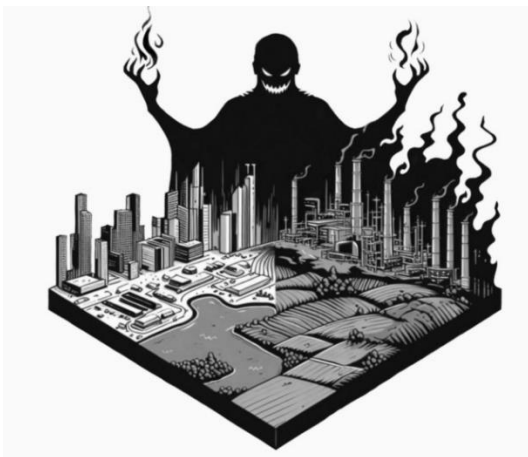
Fig. 8: Portada libro

En el último boceto, Nerón está enjaulado por robar y hacer que las águilas perdiceras e imperiales estén enfrentadas. Las 2 águilas de al lado, son los guardias de cada bando. El nombre del águila enjaulada no se revela hasta el Capítulo 2.