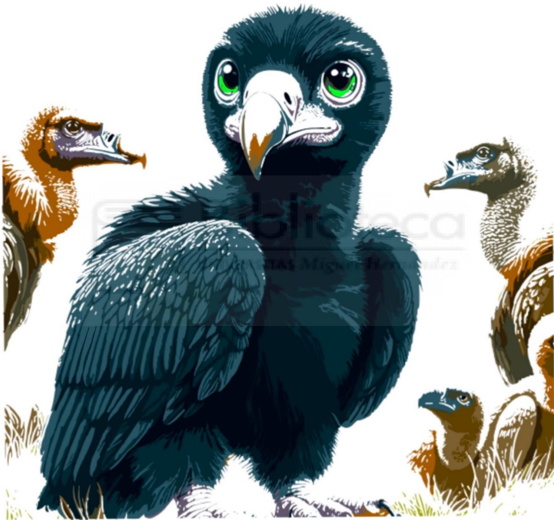
Fig. 10: Zefiro a color, ilustración digital, Procreate. A5 300ppp.