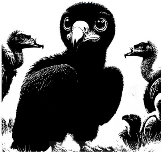
Fig.4: Boceto buitre negro, Zefiro

Comienzo redactando el libro mientras lo compagino con las ilustraciones de los personajes. Cada personaje quise mostrar principalmente su personalidad. El boceto a continuación es el buitre negro, es el más pequeño de su especie y el único que ha desarrollado el buen sentido de la visión y olfato.