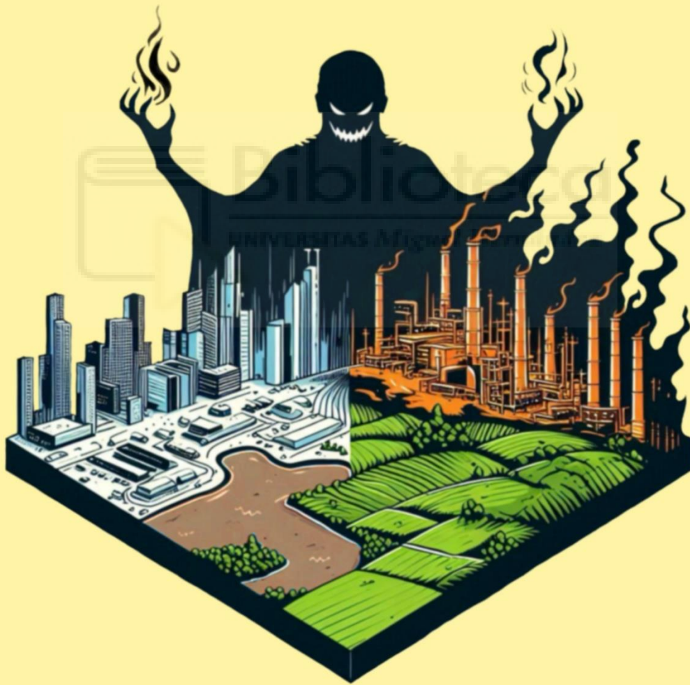
Fig. 9: Portada del libro a color. Ilustración digital, Pcreate. Tamaño A5, 300PPP.