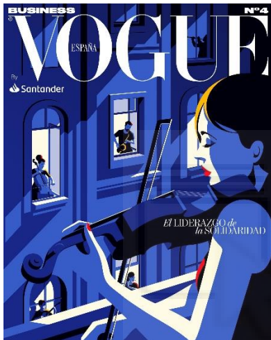
Fig.2: Malika Favre Portada de Vogue España , (2020) Ilustración digital. Dimensión variable.

Malika Favre ha sido mi referente en cuanto al diseño. Tintas planas, simplicidad en la paleta cromática y también la manera en la que cómo trabaja con el positivo y negativo de los colores. Sus diseños siguen un mismo patrón, que lo encuentro muy atractivo a la hora de realizar los bocetos. En esta línea incluyo a Tom Haugomat. A diferencia de Malika, su estilo es más delicado y su paleta de color no es tan reducida. Ha trabajado para libros, cortometrajes y también en revistas como Malika. Esto me ayuda bastante a la hora de ilustrar con texto acompañado.