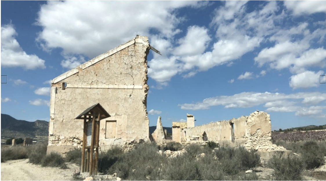
Imagen 2. Fábrica de la sal, Salinas.