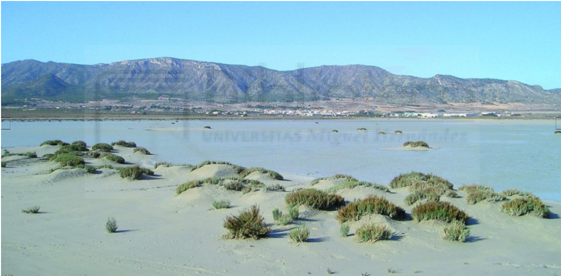
Imagen 3. Las salinas, Salinas.

Para las lecturas, se elegirán fragmentos de la obra y diálogos con los que puedan interactuar los participantes en las performances que se organicen. Al finalizar la ruta, se procederá a extraer los conocimientos, habilidades y competencias que se desprenden de la situación de aprendizaje efectuada. Cada integrante del grupo ha de plasmar por escrito una memoria que resuma su experiencia personal y responder a un breve cuestionario diseñado por los docentes de las asignaturas que forman parte de la actividad. En las sesiones presenciales siguientes, en el salón habitual de clases, se discutirán y analizarán las diversas opiniones emitidas.