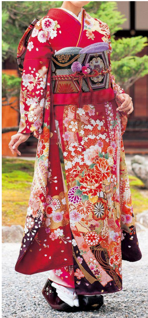
Fig. 1. kimono tradicional

En nuestro diseño podemos observar la influencia del estampado floral, y la del cuello con doblete, tan típico en kimonos y yukatas .