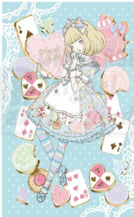
Fig. 2. Ejemplo de “Angelic Pretty”