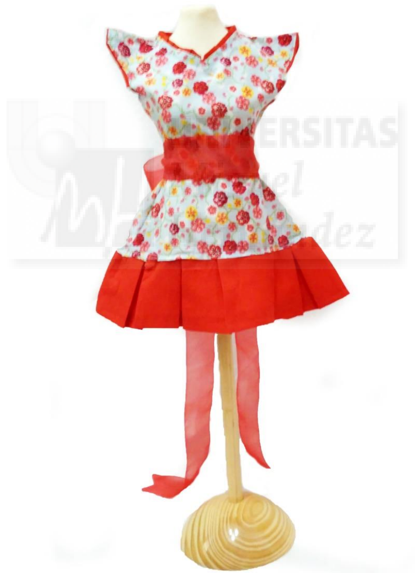
Fig.7. Vestido finalizado.

Empezamos por un estudio de la moda oriental desde sus inicios, y decidimos volcarnos en Japón porque sus colores y formas nos parecían más llamativos, característicos y por tanto más fácilmente reconocibles con una fusión con la moda europea.