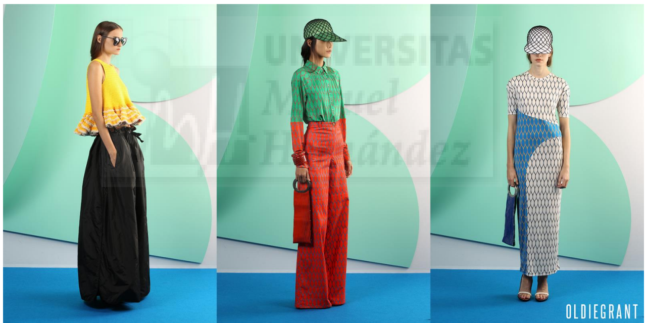
Fig. 3. Ejemplo de diseños de Kenzo

Aunque la firma ha sido absorbida por la empresa LVMH y, por lo tanto, su estilo ha cambiado mucho, en sus inicios fue fuente de inspiración para muchos otros diseñadores, e incluso hoy en día, es normal recurrir a ellos como referente.