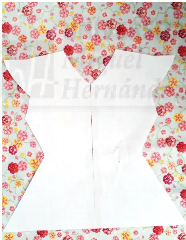
Fig. 5. Patrón ya recortado para marcarlo en la tela.

El paso siguiente fue crear el patrón del vestido que habíamos diseñado. Se decidió que se haría ha escapa por los altos costes de la tela. Ya que el presupuesto era bajo.