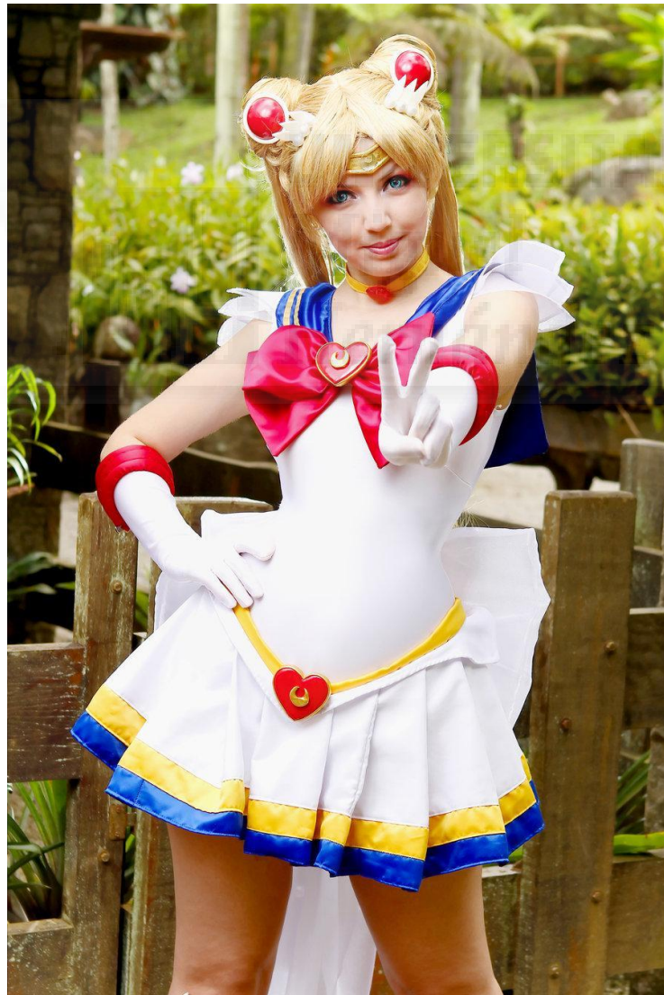
Fig. 4. Cosplayer de la icónica serie japonesa “Sailor Moon”.

El cosplay llegó con mucha fuerza a Europa con la aparición de los mangas y animes que se empezaron a emitir en televisión a partir de la época de los 80's. Como particularidad en España se arraigó mucho más en Catalunya que en el resto del país, debido a la gran emisión de animes por parte del canal catalán K3.