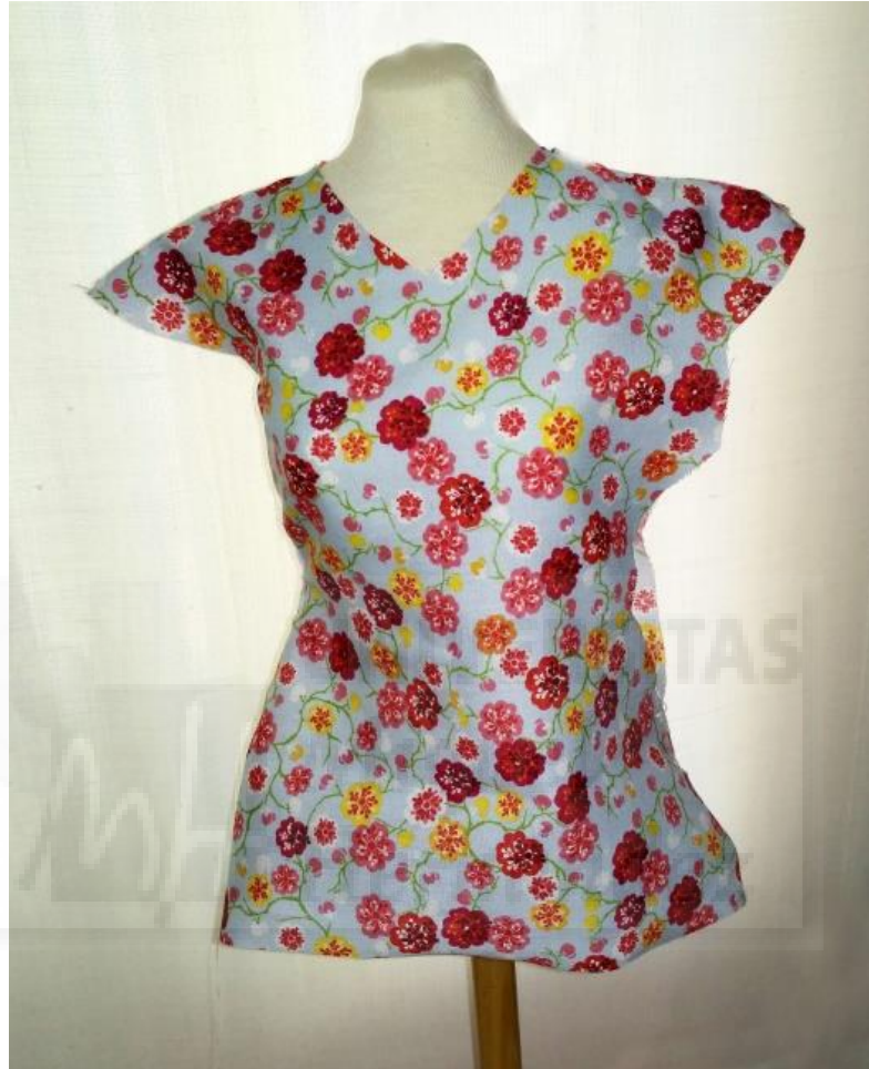
Fig. 6. Vestido en proceso de construcción.

A continuación recortamos el patrón en la tela y nos dispusimos a coserlo, siguiendo las normas básicas de la costura. Primero embastamos para asegurarnos de que era correcto y finalmente pasamos a repuntar con la máquina de coser.