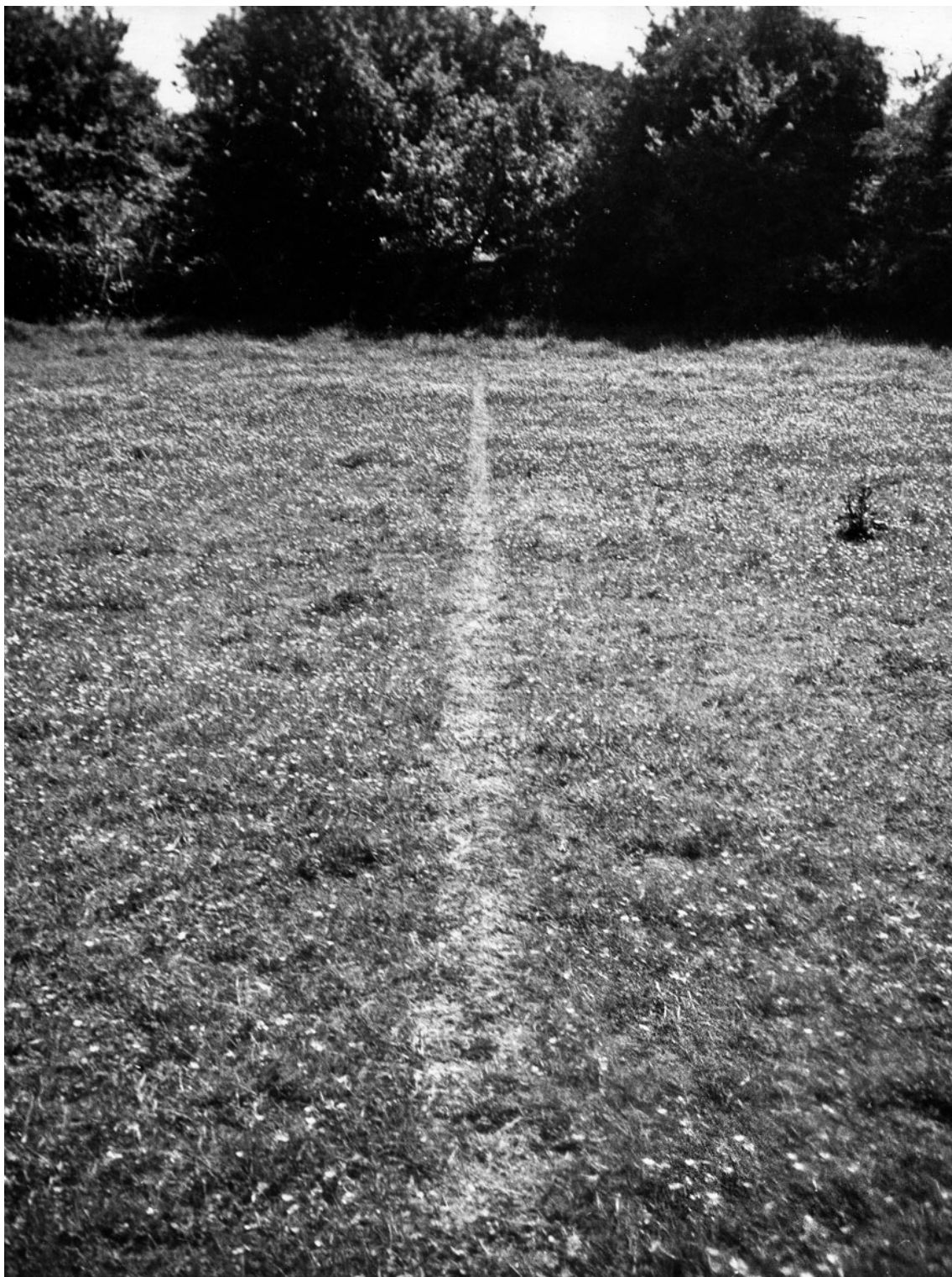
Fig. 2. Richard Long, Línea hecha al caminar , 1967, Land Art, Medidas variables.

Y como referente temático tomamos a Long en tanto a su concepción de la obra de arte como el acto y la experiencia del mismo, aunque comparta importancia con Andre en tanto que haremos uso de sus métodos tanto formales, como de pensamiento para desarrollar el conjunto del proyecto.