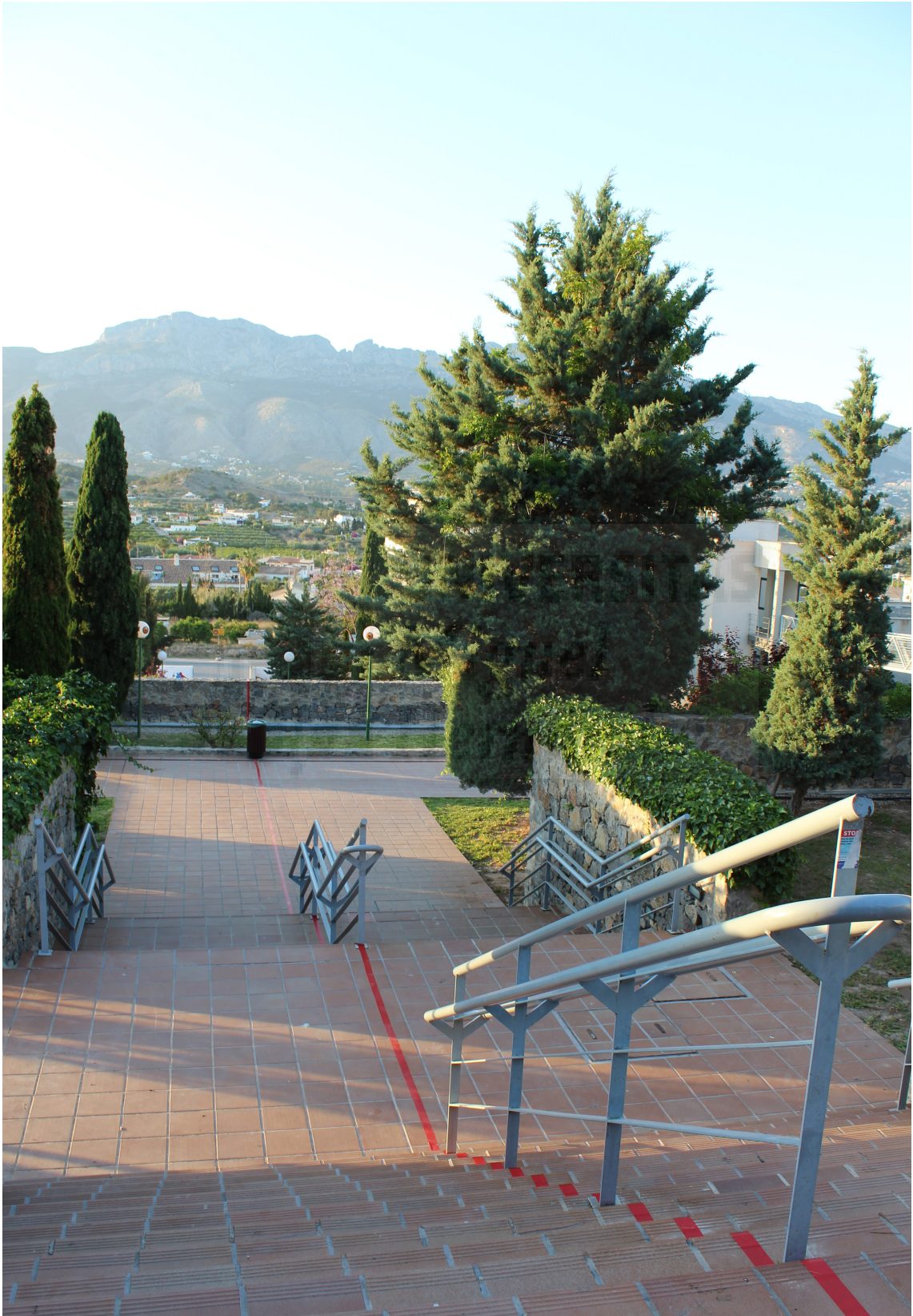
Fig. 8. Miguel Ángel Perelló Juan, Sin Título , 2016, Intervención, Medidas variables.