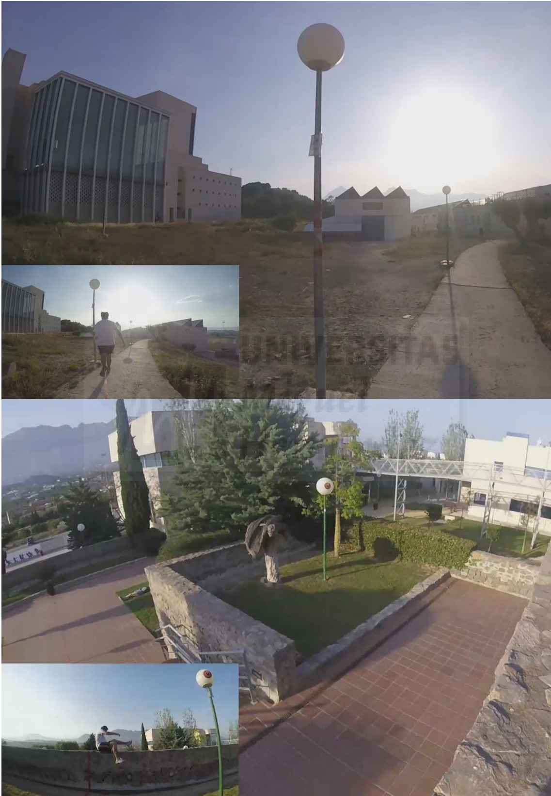
Fig. 9. Miguel Ángel Perelló Juan, Sin Título , 2016, Performance, 00:02:14.