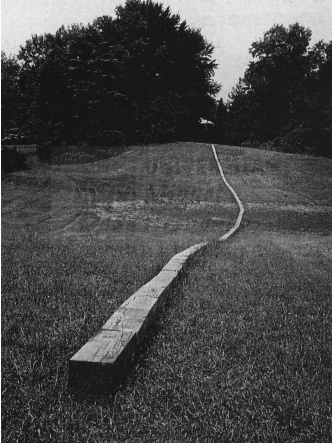
Fig.1. Carl Andre, Secant , 1977, Land art, Madera de pino, 30x30x90cm (Cada pieza)

Tomamos como referente visual a Andre en tanto a su uso de distintos materiales para recubrir el suelo y trazar en él un camino.