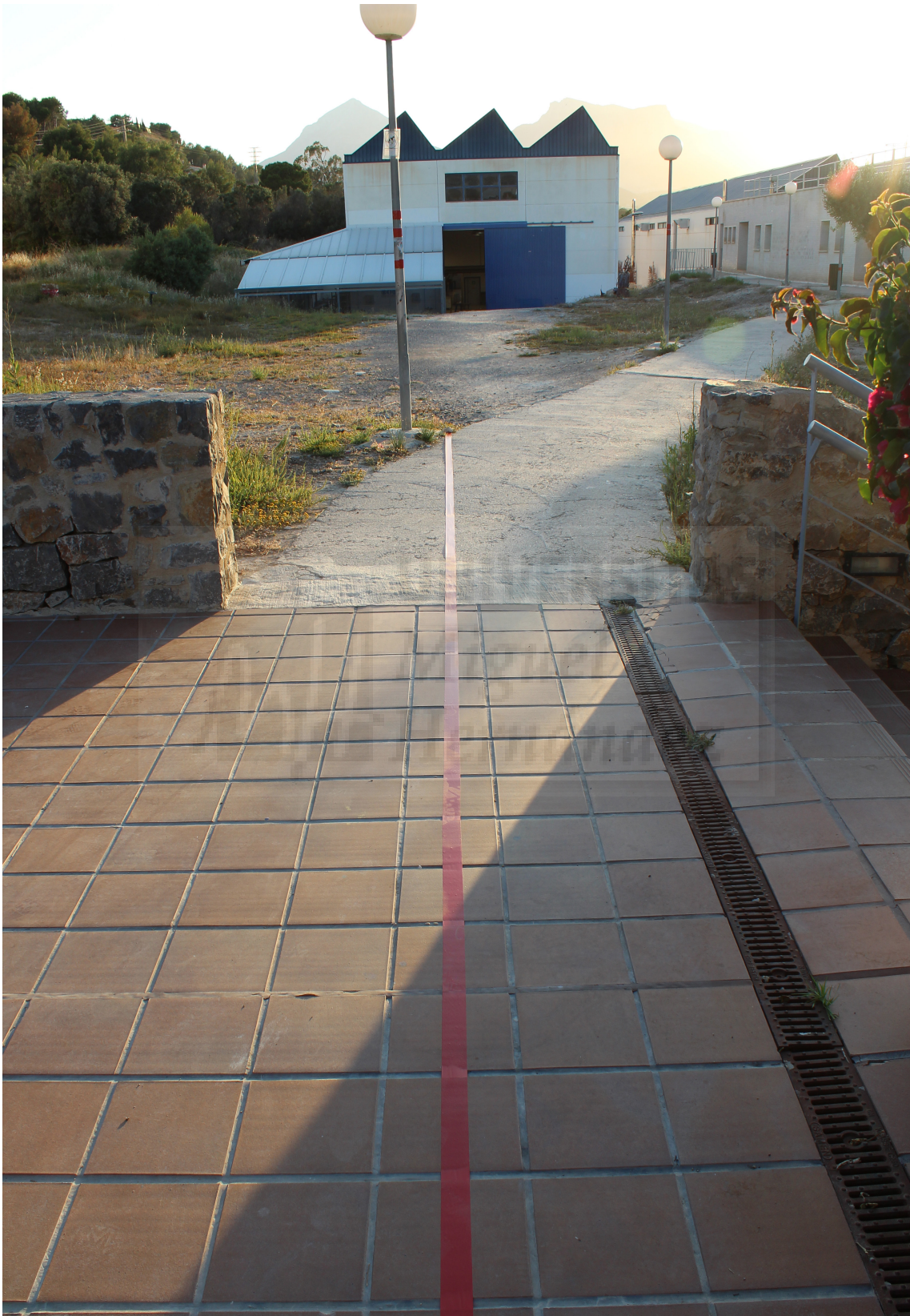
Fig. 7. Miguel Ángel Perelló Juan, Sin Título , 2016, Intervención, Medidas variables.