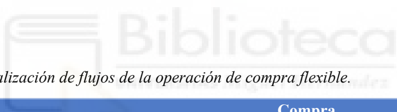
Tabla 4: Actualización de flujos de la operación de compra flexible.