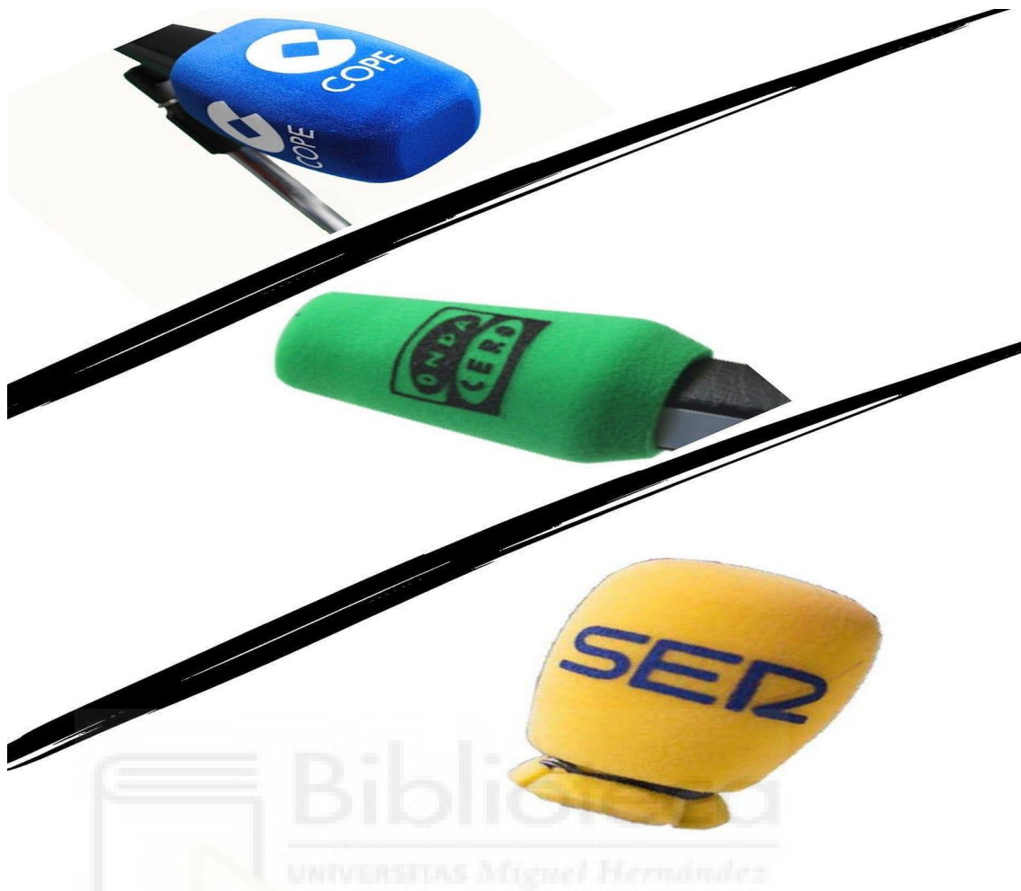
Micrófonos de SER, COPE y Onda Cero, principales cadenas radiofónicas

Los periódicos deportivos tradicionales como Marca o AS, los cuales se encuentran sumergidos en una transformación hacia lo digital, también dispusieron todos los medios a su alcance para acercar a sus seguidores la última hora sobre el Mundial en una cobertura 360°.