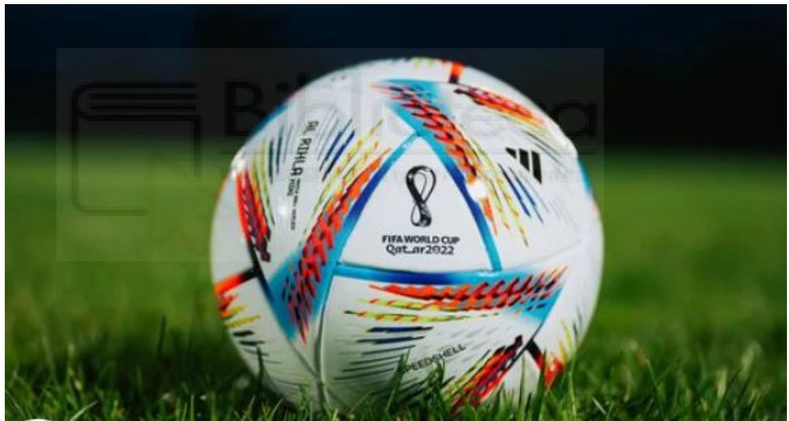
Balón de Adidas del Mundial de Catar 2022

Carambolas de la vida, la final del Mundial de Catar enfrentó a las dos estrellas actuales del PSG: Messi y Kylian Mbappé. El caso 'Qatargate' salió a pedir de boca para los interesados. Estados Unidos, principal rival en la candidatura y, por tanto, mayor damnificado, fue elegido posteriormente junto con Canadá y México para albergar la Copa del Mundo 2026.