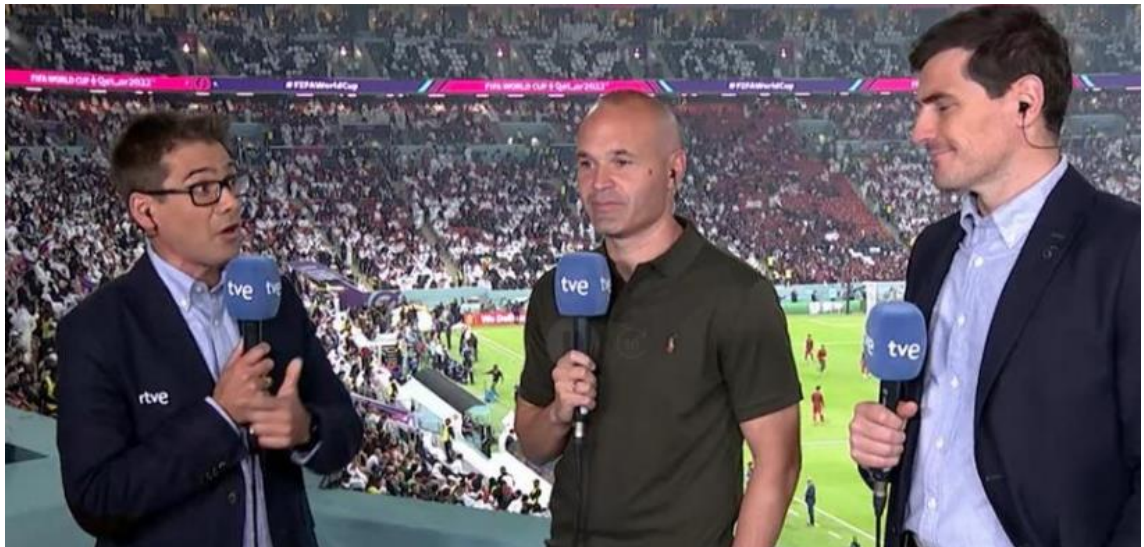
Arsenio Cañada (izquierda), Andrés Iniesta (centro) e Iker Casillas (derecha), durante la retransmisión de un encuentro de la Selección Española en el Mundial de Catar

Las radios también tuvieron que hacer un despliegue nunca antes visto para informar de la manera más escrupulosa posible de todo lo que acontecía en Catar, y para ello prima la organización.