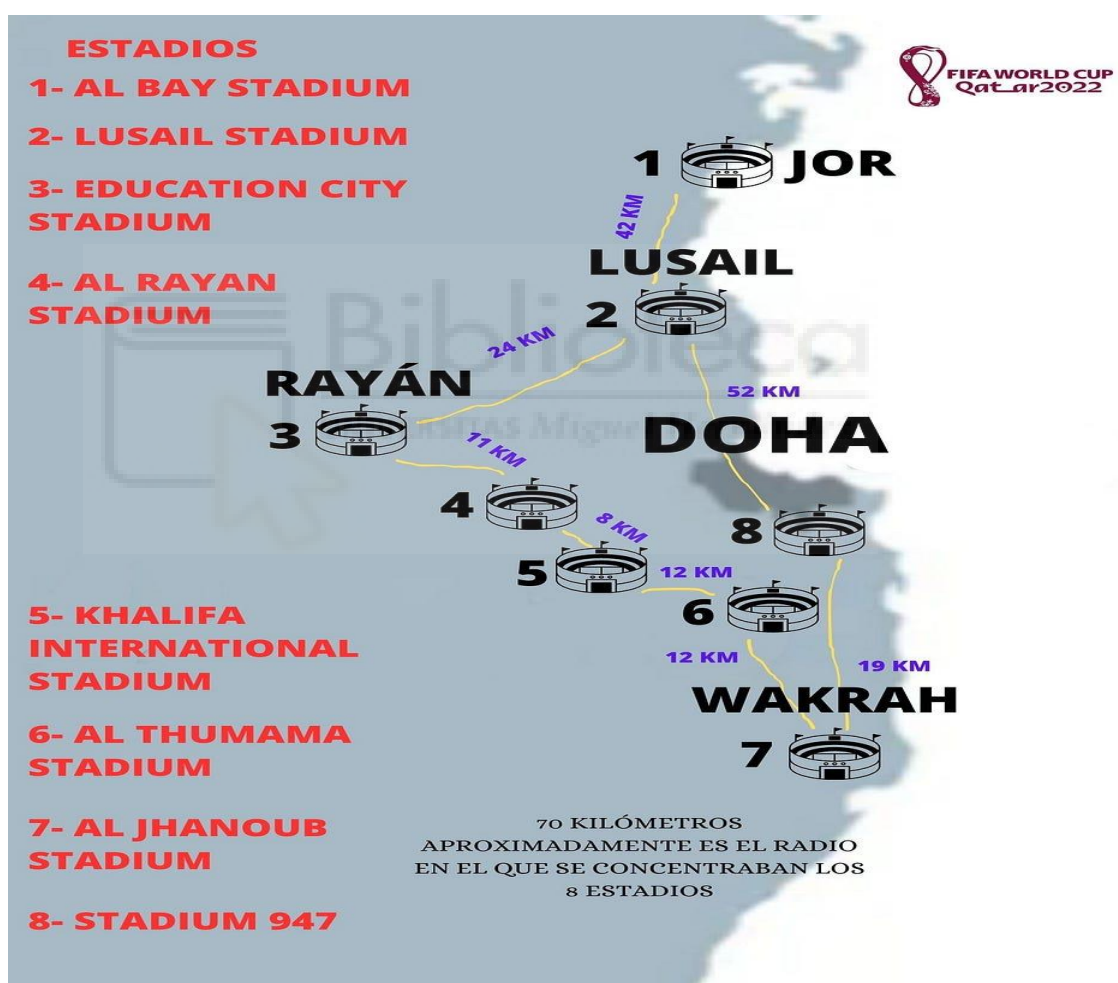
Mapa distancia estadios Mundial Catar 2022