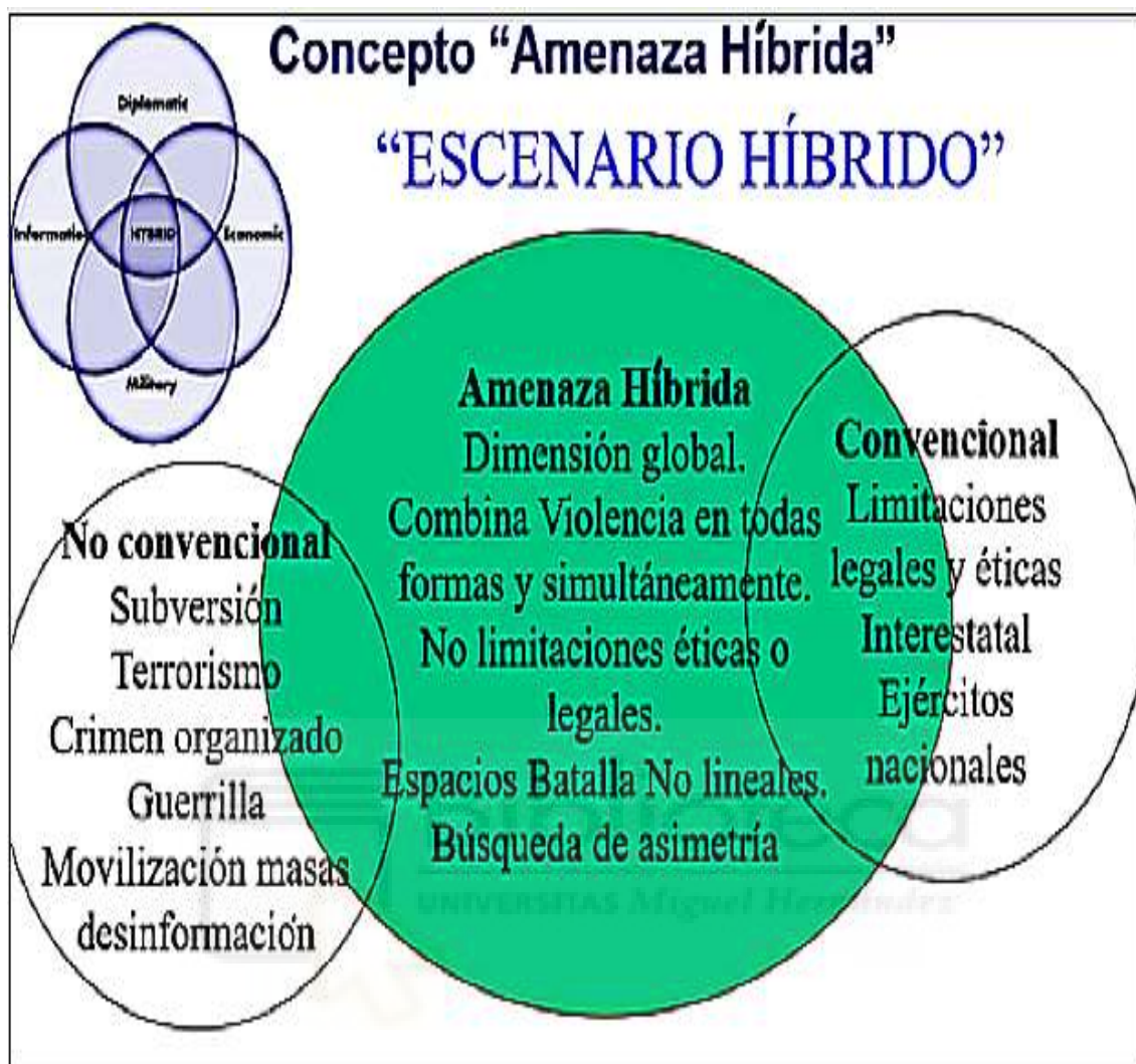
Ilustración 1 - Concepto de amenaza híbrida, elementos del escenario.