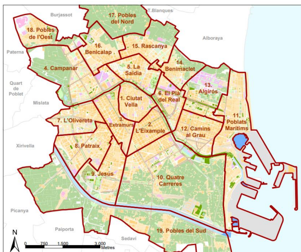
Ilustración 3. División territorial de la ciudad de Valencia.

Como se puede apreciar de los datos arriba aportados, la población de origen extranjero en Valencia tiene una gran representación en la ciudad, siendo más de un 20% de la población censada y distribuyéndose por todos los distritos de la ciudad.