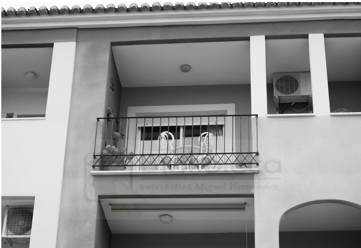
14, 2022. Fotografía digital B/N. 42 x 29,7 cm c/u