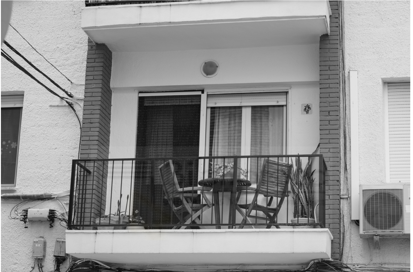
6, 2022. Fotografia digital B/N. 42 x 29,7 cm c/u