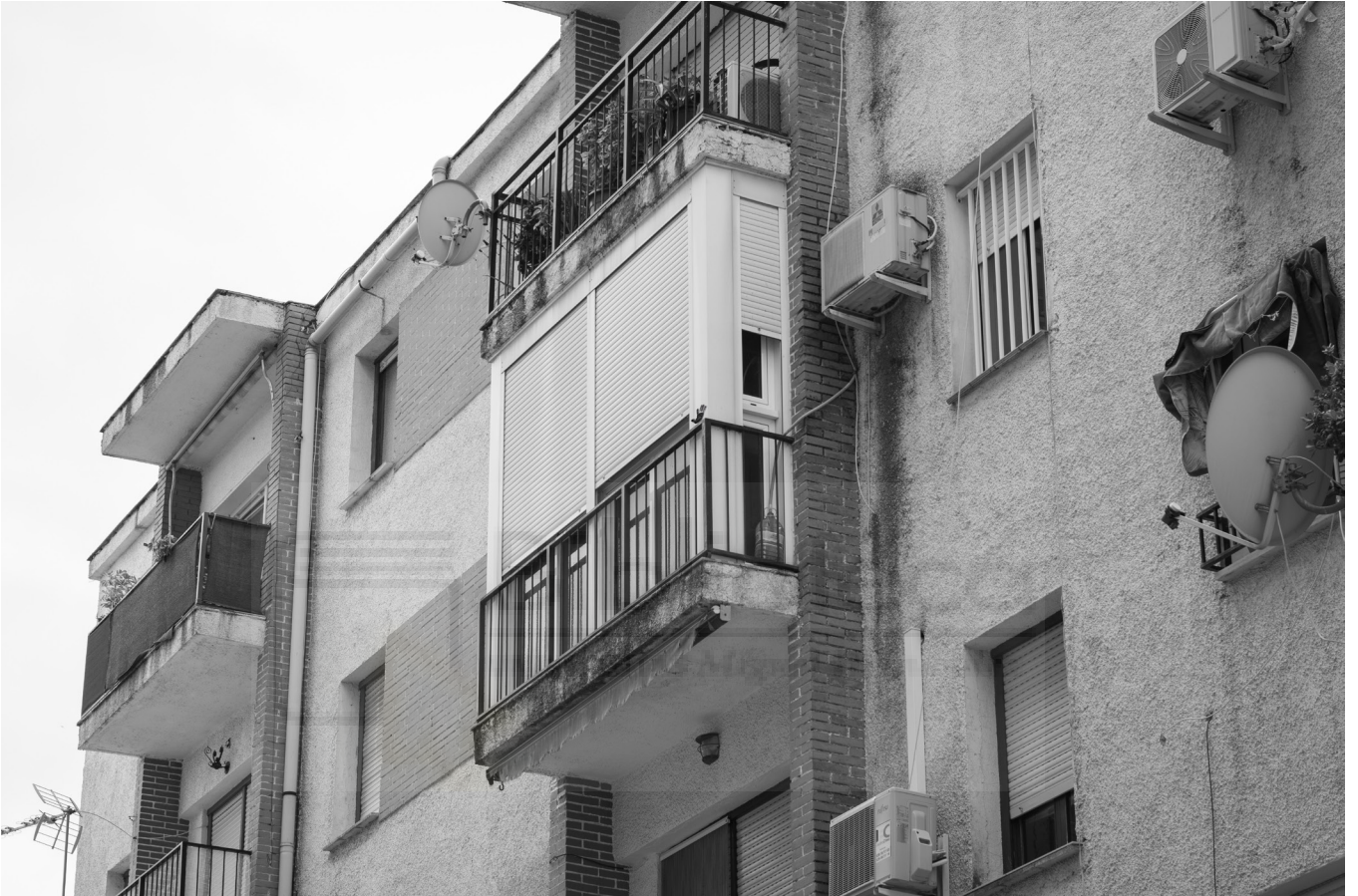
7, 2022. Fotografia digital B/N. 42 x 29,7 cm c/u