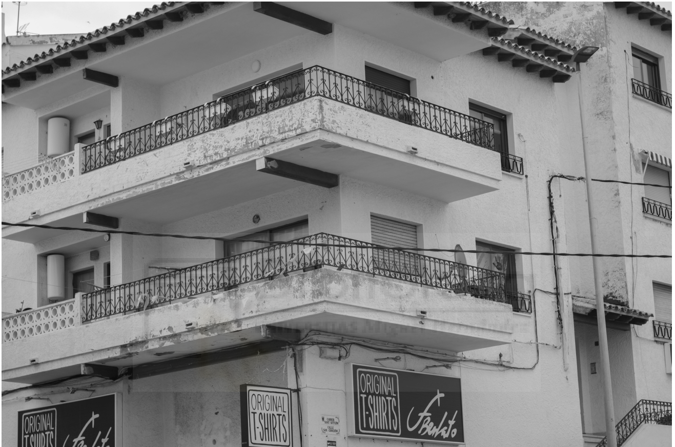
2, 2022. Fotografia digital B/N. 42 x 29,7 cm c/u