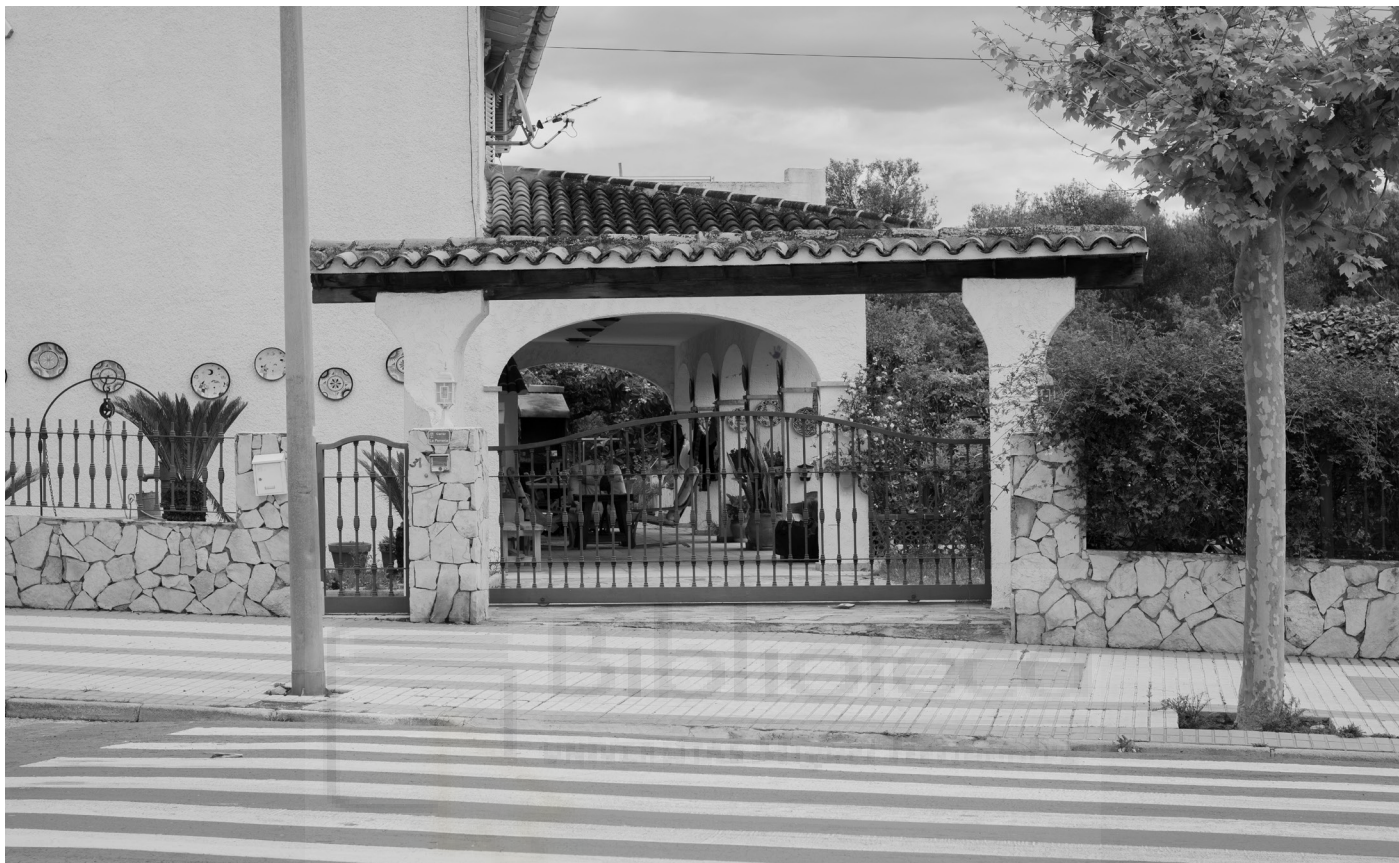
13, 2022. Fotografía digital B/N. 42 x 29,7 cm c/u