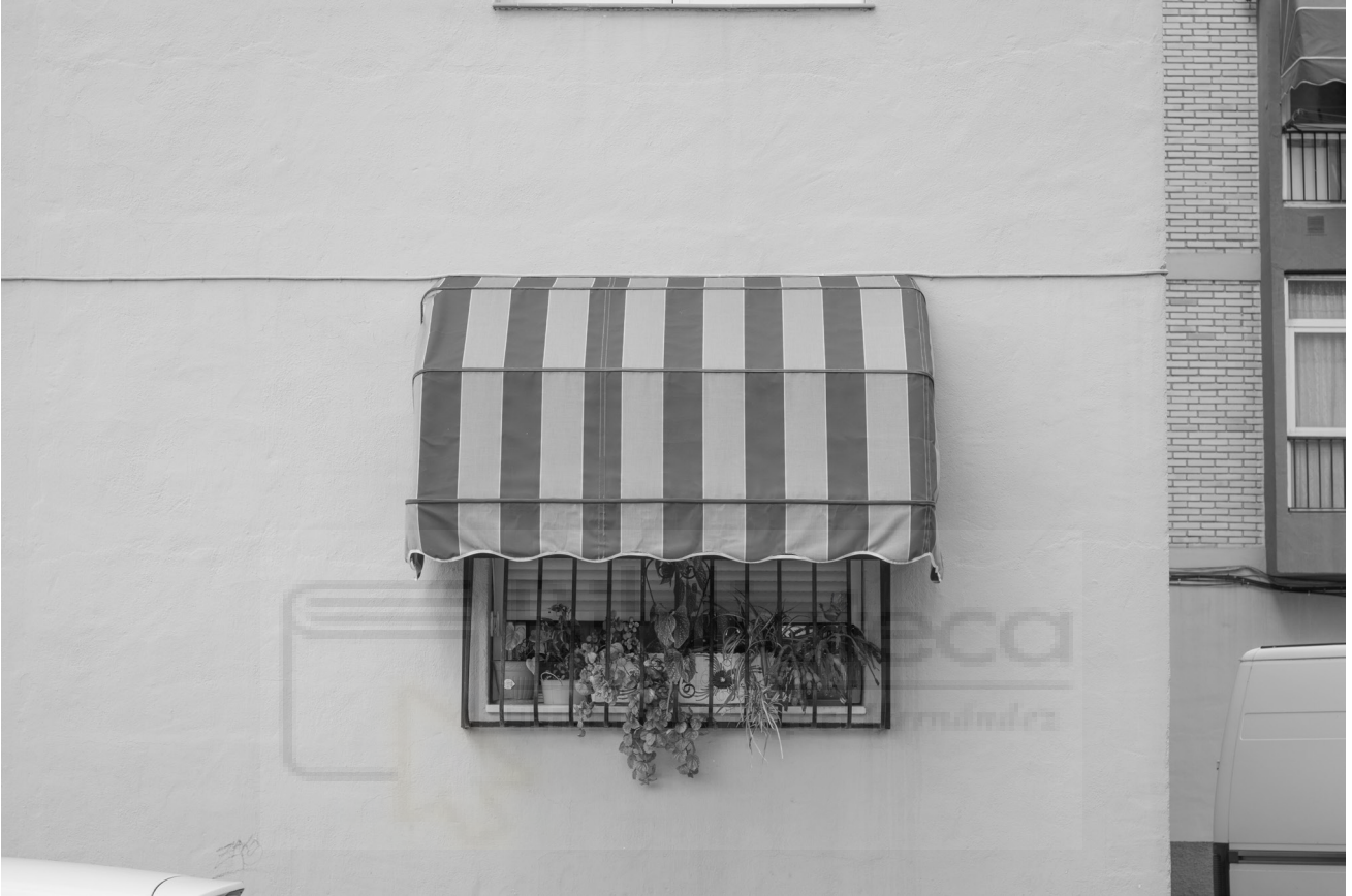
10, 2022. Fotografía digital B/N. 42 x 29,7 cm c/u