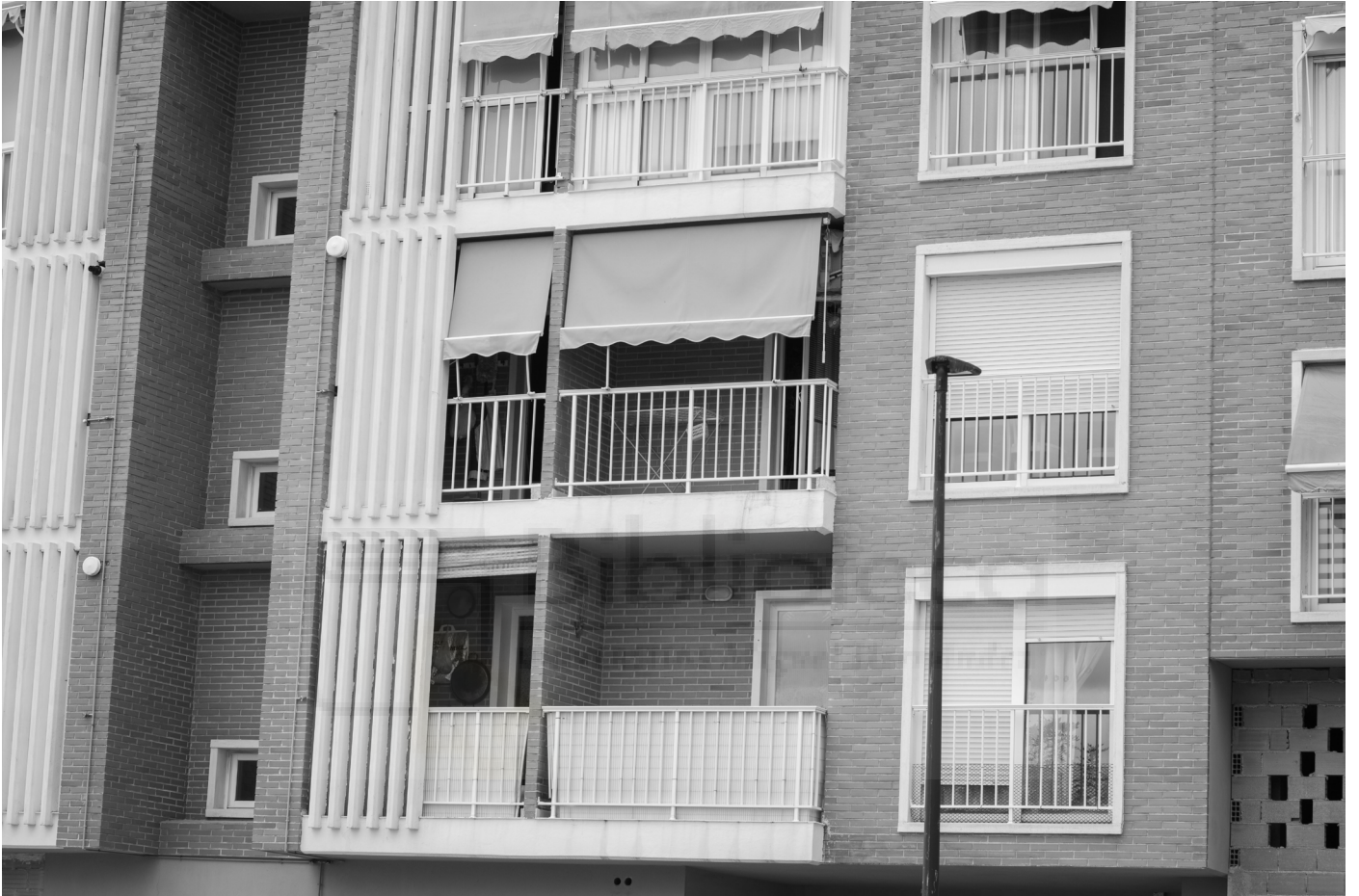
5, 2022. Fotografia digital B/N. 42 x 29,7 cm c/u