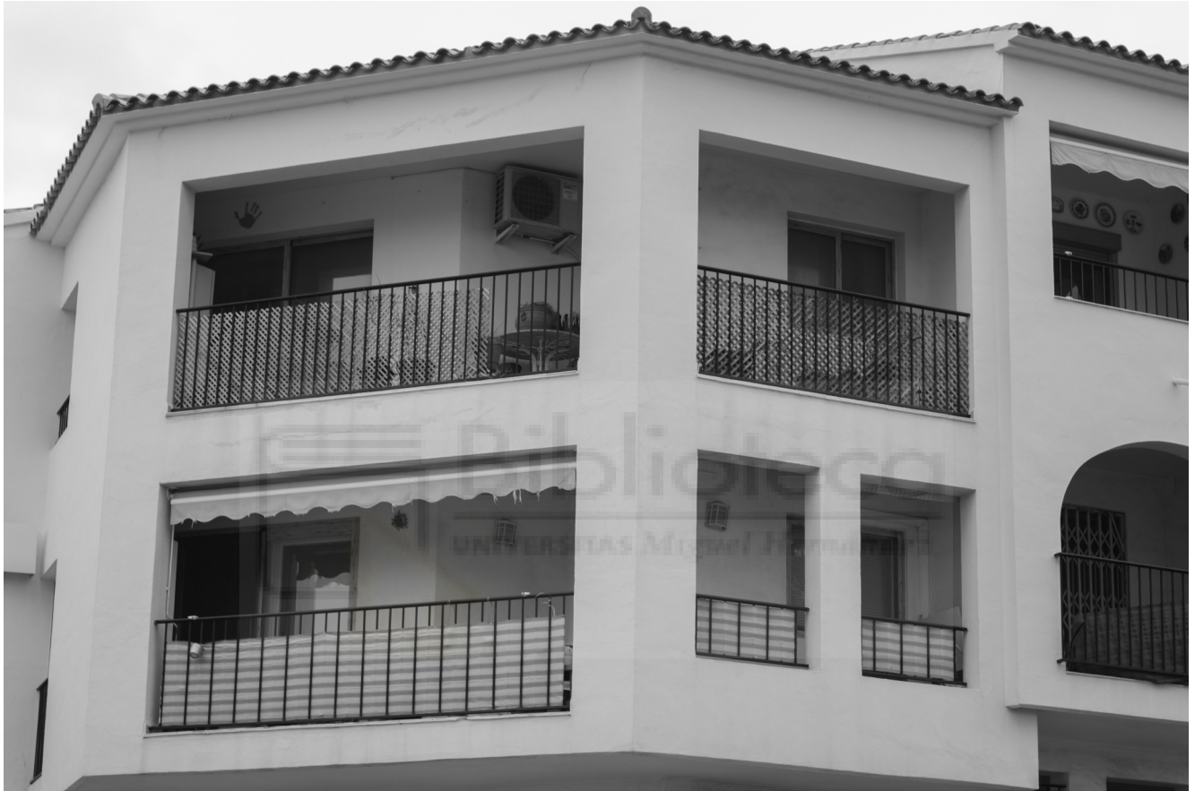
1, 2022. Fotografía digital B/N. 42 x 29,7 cm c/u