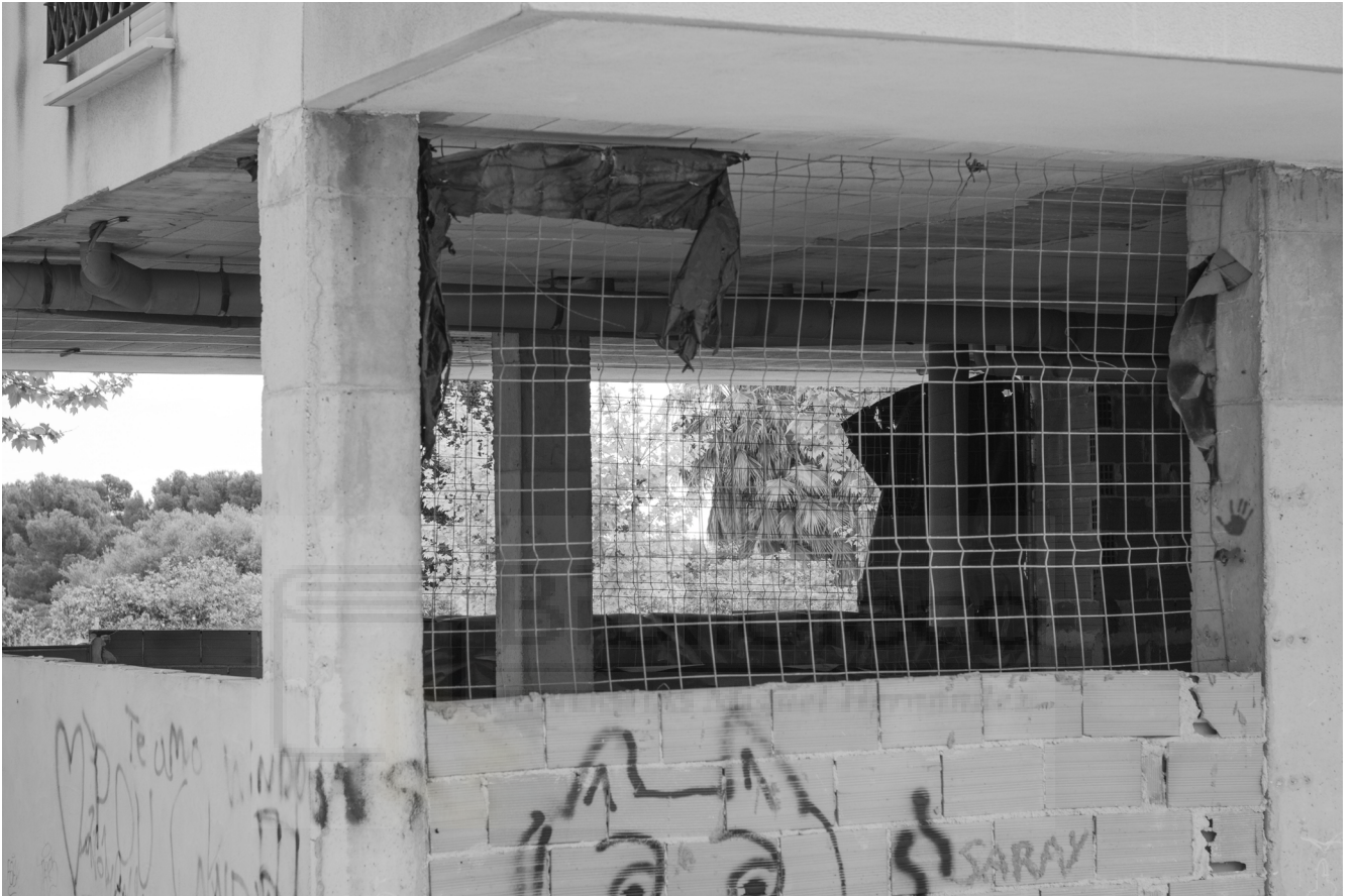
9, 2022. Fotografía digital B/N. 42 x 29,7 cm c/u