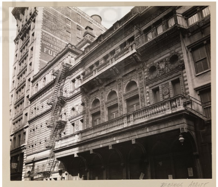
Fifth Avenue Theatre, 28th Street Facade, 1938