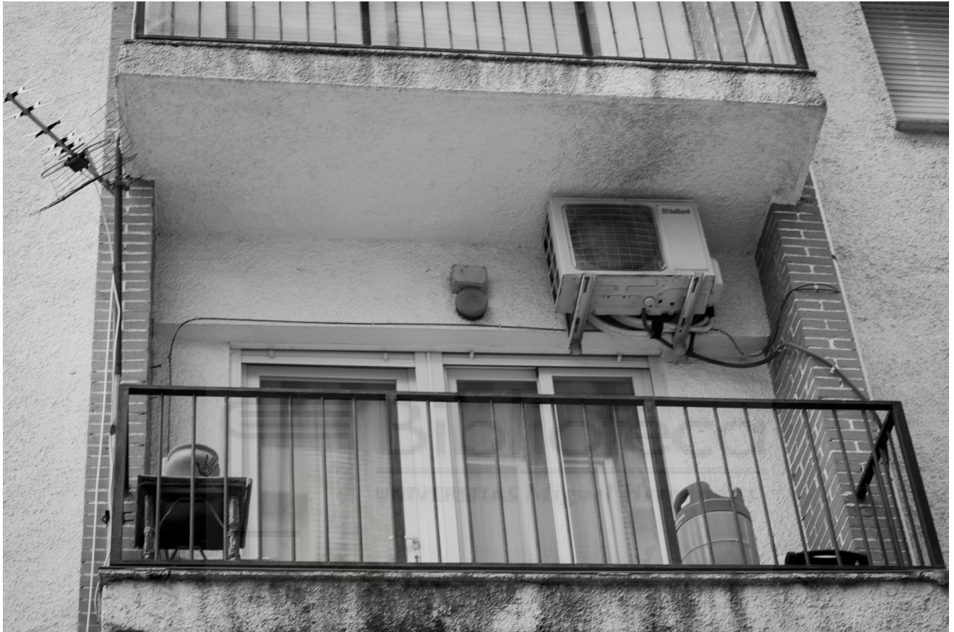
8, 2022. Fotografía digital B/N. 42 x 29,7 cm c/u