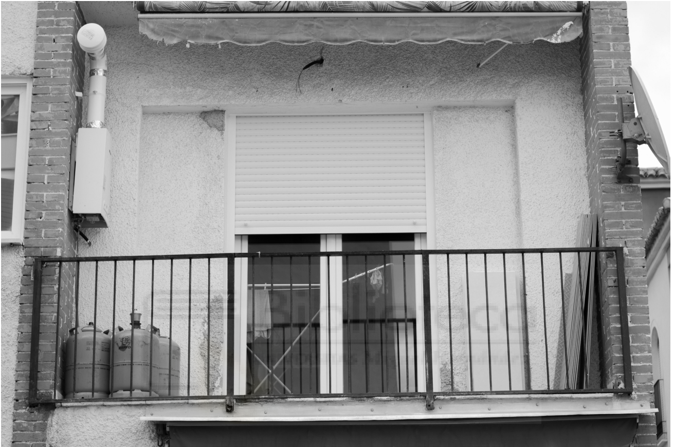
11, 2022. Fotografía digital B/N. 42 x 29,7 cm c/u