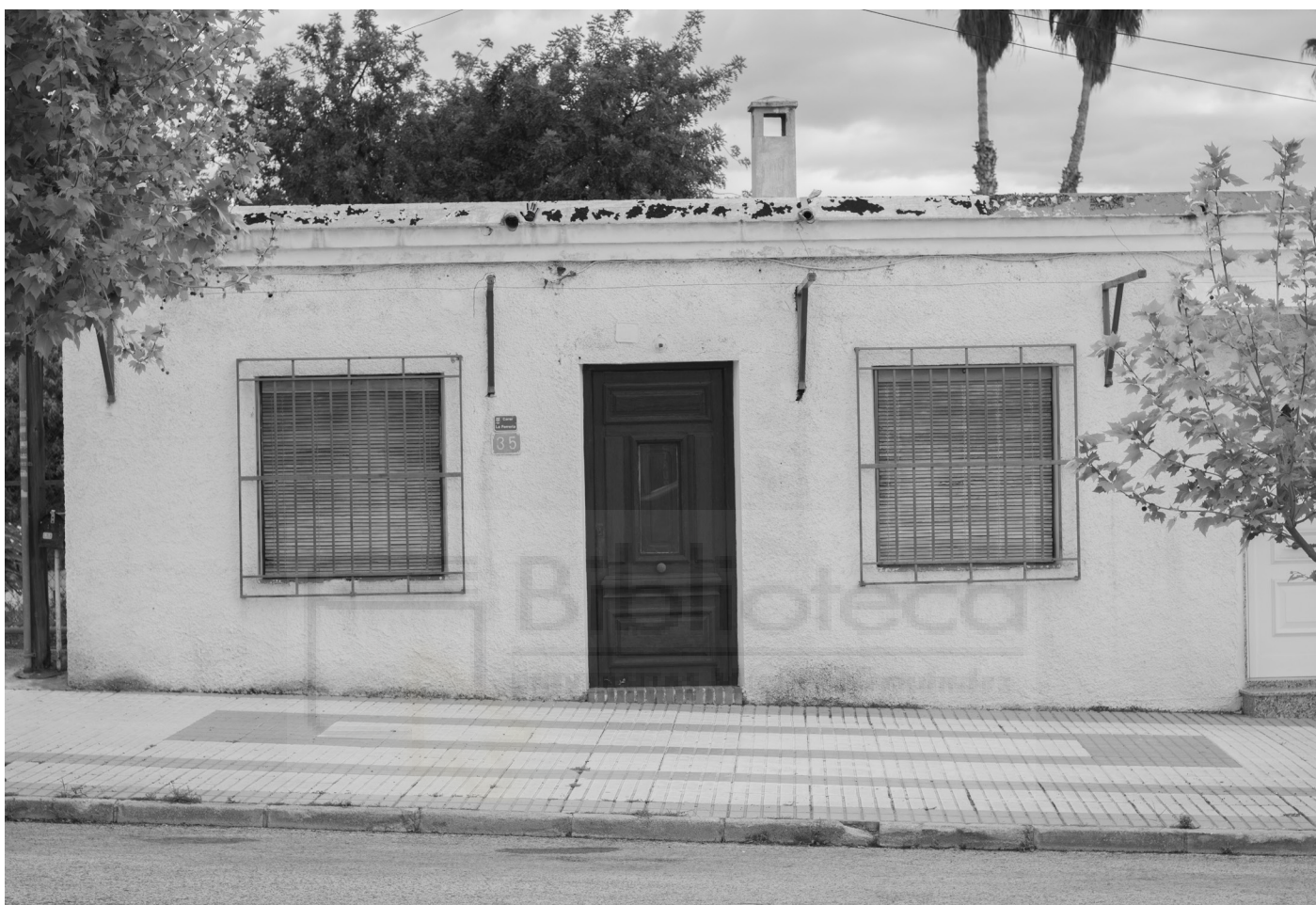
15, 2022. Fotografía digital B/N. 42 x 29,7 cm c/u