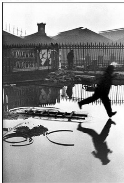
Behind the Gare Saint-Lazare, 1932