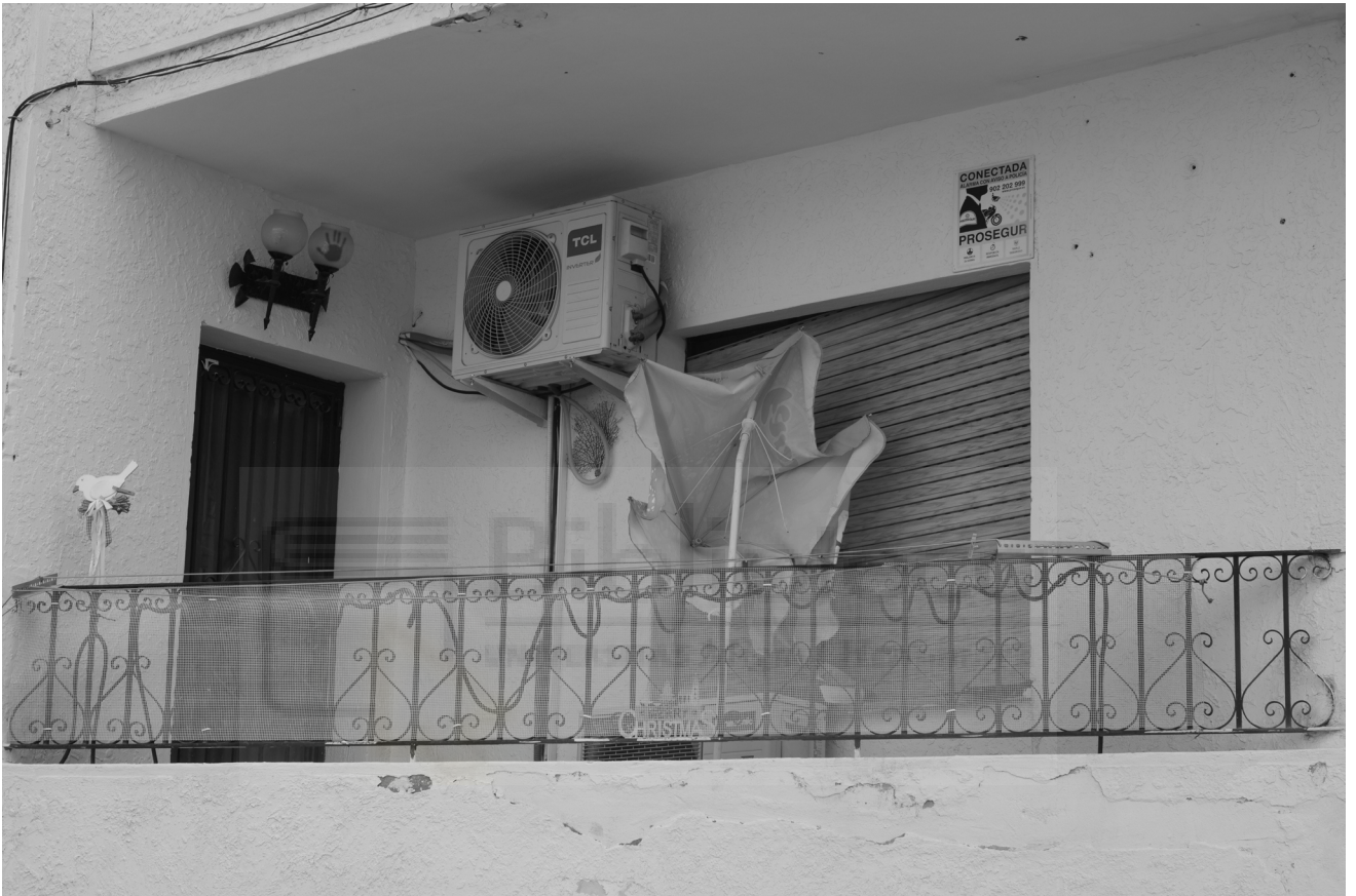
3, 2022. Fotografía digital B/N. 42 x 29,7 cm c/u