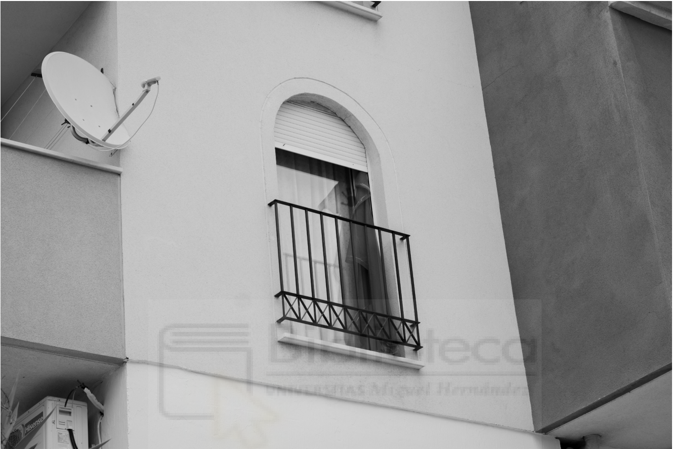
12, 2022. Fotografía digital B/N. 42 x 29,7 cm c/u