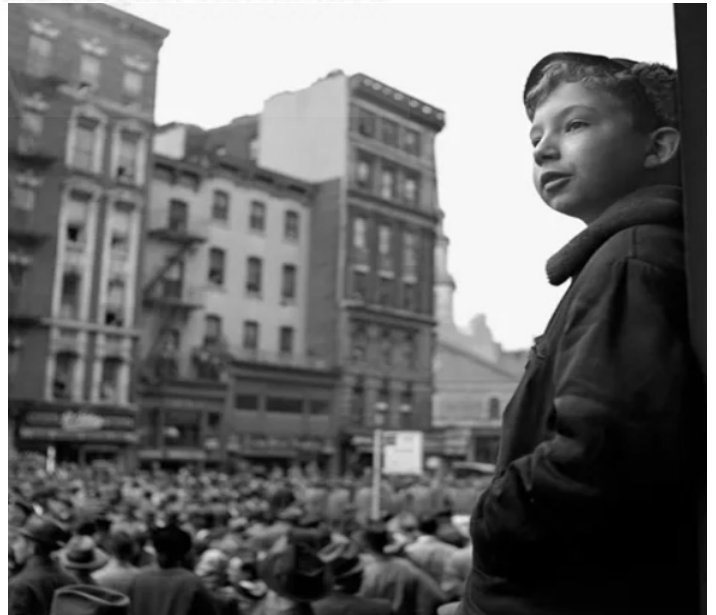
Undated, New York, NY