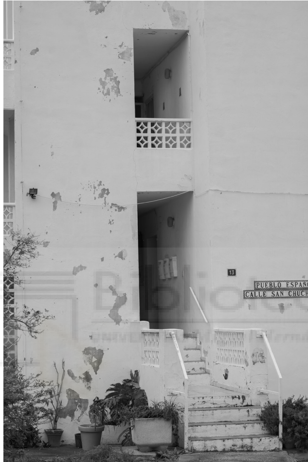
4, 2022. Fotografía digital B/N. 29,7 x 42 cm c/u