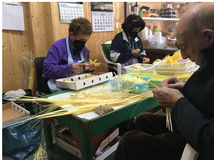
Artisanos del taller Serrano Valero.

Fue hace 25 años cuando su padre se desvinculó de sus hermanos, porque querían jubilarse, y fué su hermano y ella los que se quedaron con la empresa familiar, que ahora se llama Serrano Valero. Anteriormente, la empresa se llamaba Francisco Serrano Valero (nombre de su padre), y otros nombres que ha tenido el negocio son: Hijos de Serrano Valero, Viuda de José Serrano García, Hijos de José Serrano y Hermanos Serrano Valero. El nombre más antiguo que ha tenido la empresa familiar es José Serrano García (su bisabuelo).