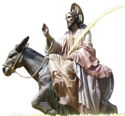
Jesús triunfante de Elche.

Cada año, es una cofradía diferente la que se encarga de portar el paso, que tradicionalmente está engalanado únicamente con piezas elaboradas de palma realizadas por los alumnos del Taller Municipal de Palma Blanca. Cabe destacar que, en esta procesión, se exhiben las palmas rizadas que los artesanos presentan el día anterior en el concurso de palma blanca, las cuales suelen tener motivos religiosos alusivos a la ciudad en su configuración. Al finalizar la procesión se celebra una Misa Solemne en la Basílica de Santa María.