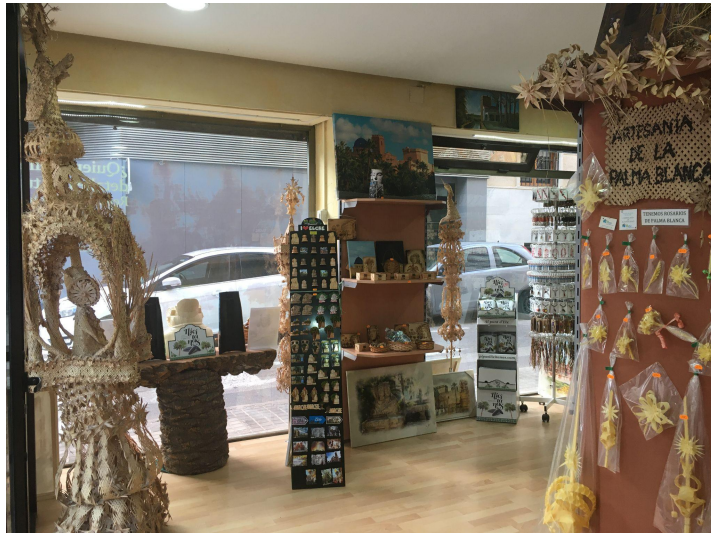
Tienda El Cor d' Elx. Fotografía de Armando Marco

Su familia lleva dedicándose al sector unos 55 años, aproximadamente desde los años 60. En aquellos años, sus familiares trabajaban en la palma para tener un revulsivo económico en la temporada después de la Navidad. Son dos generaciones. Su padrino era el palmero, y fue quien enseñó al resto a trenzar las palmas, aunque él aprendió sobre todo de su padre.