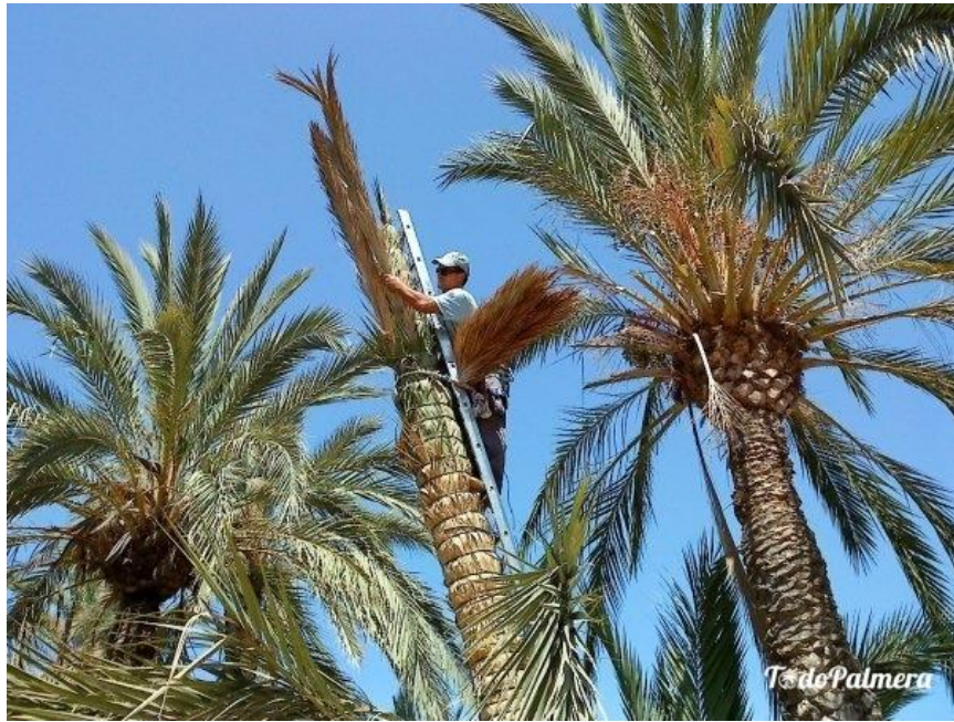
Palmerero atando palmeras.

En el proceso hay una parada en enero, donde los palmereros se ponen a cortar las palmas que ataron el año anterior, porque la palma, para que no se ponga rojiza, tiene que cortarse entre 60 y 90 días antes del Domingo de Ramos. Una vez que han cortado la palma del año pasado, se continúa atando palma. Cuando llega junio, ya se ha terminado el trabajo y se empiezan a tapar los capuruchos, que es la segunda parte.