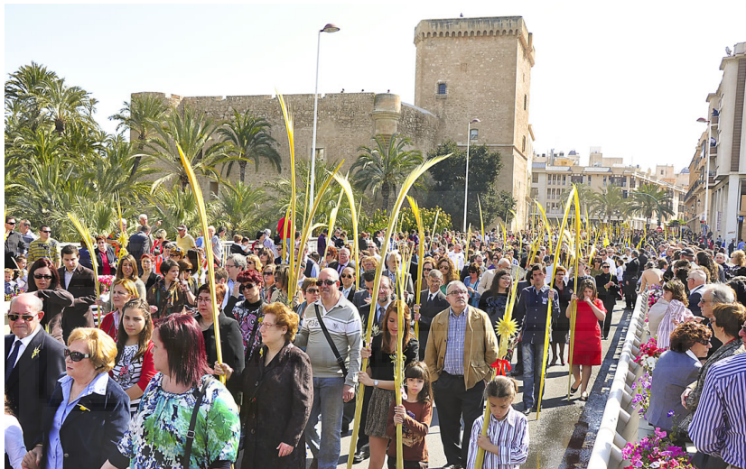
Procesión de las palmas de Elche.

El Domingo de Ramos es uno de los días grandes para Elche. En la ciudad, la Semana Santa se inicia con la procesión de las palmas en la mañana del Domingo de Ramos. Cada año, miles de personas inundan las calles portando su palma en una jornada única. La procesión comienza en el Paseo de la Estación, en torno a las 11:00 horas, con la bendición de las palmas. El recorrido procesional se hace bordeando el Parque Municipal y durante el trayecto se puede apreciar uno de los contrastes más espectaculares con las palmas blancas en movimiento sobre un fondo de palmeras verdes.