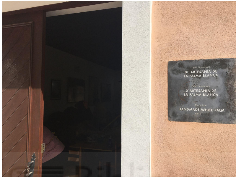
Entrada del taller municipal de Palma Blanca.

2 partes: 300 horas para el taller de iniciación y las otras 300 para el taller de perfeccionamiento. Los alumnos van de martes a viernes y está financiado por el ayuntamiento, por lo que es gratuito para el que quiera. Los únicos requisitos que se exigen para poder apuntarse son: ser mayor de 18 años y tener disponibilidad horaria.