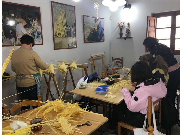
Instalaciones del taller municipal de Palma Blanca.

Junto a la monitora, la mayoría de alumnos destacan que en el taller hay un gran compañerismo y lo pasan muy bien aprendiendo esta artesanía. Los alumnos no van con la intención de dedicarse profesionalmente a la palma, sino que lo hacen porque les gusta y quieren aprender cosas nuevas. Todos valoran positivamente el concurso municipal de palma blanca, ya que presentan los trabajos con mucha ilusión sabiendo que el resto de la ciudadanía los va a poder ver y, encima, tienen la oportunidad de ser uno de los ganadores que se lleve uno de los premios económicos que se dan.