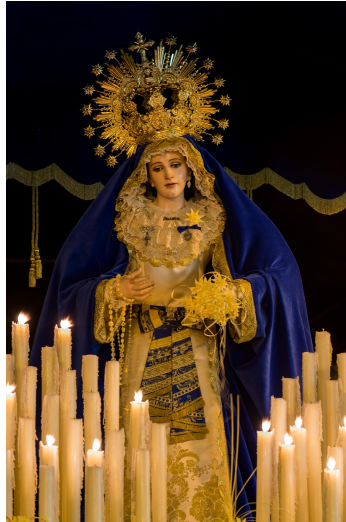
María Santísima de la Palma de Elche.

La procesión del Domingo de Ramos fue declarada de Interés Turístico Internacional el día 22 de julio del año 1997. Al contar con distintivos turísticos como este, la Semana Santa ilicitana tiene un gran impacto económico en la ciudad, ya que genera unos 22 millones de euros anuales, según un informe del Instituto de Estudios Económicos de la Provincia de Alicante (INECA).