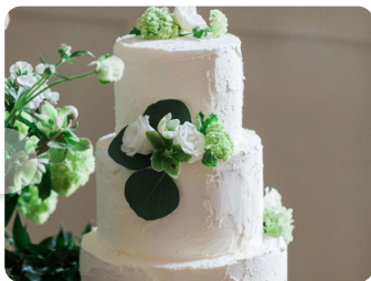
European Wedding Trends

from 'The International Wedding Trend Report 2020'