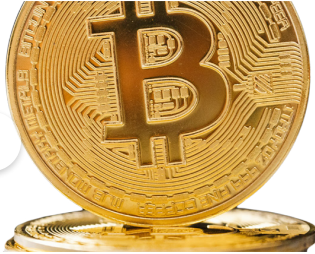
La estafa piramidal: un engaño...

from '¿Por qué me duele la regla? | UMH Sapiens 32'