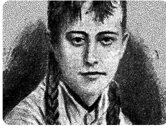
La primera botánica española |...

from '¿Por qué me duele la regla? | UMH Sapiens 32'