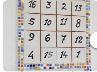
Pasatiempos, pero... | UMH Sapie...

from '¿Por qué me duele la regla? | UMH Sapiens 32'