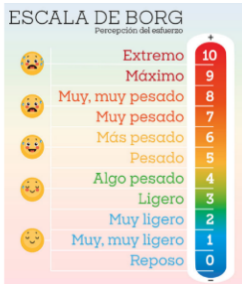
Figura 1: Escala de Borg Modificada