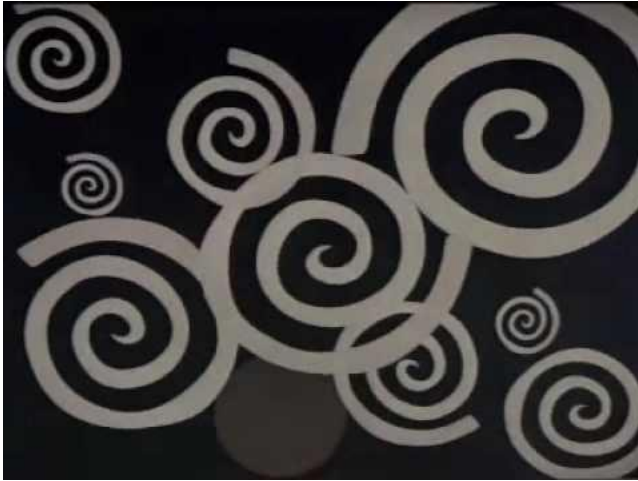
Figura 9: Videoclip La canción de todo va mal de Le Mans.