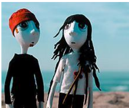
Figura 4: Muñecos de Amaral.

Esta tendencia se traslada a España y se unen a ella grupos como Amaral, que crearon muñecos de plastilina que representaban a los componentes del grupo.