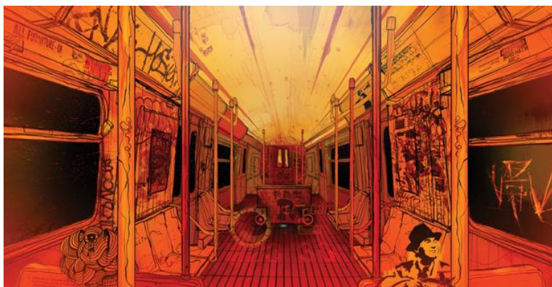
Figura 7: Videoclip 8 líneas , Violadores del verso.

líneas de Violadores del Verso, realizado en 2006 y subido a la plataforma en 2009.