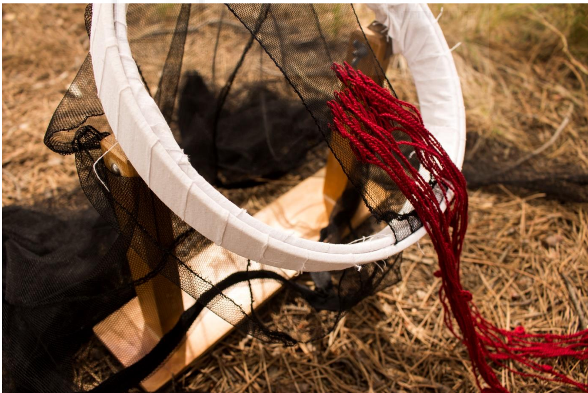
Fig. 19- Beatriu Marer, 2021. Significarse. Labor de aguja VIII , confección textil.