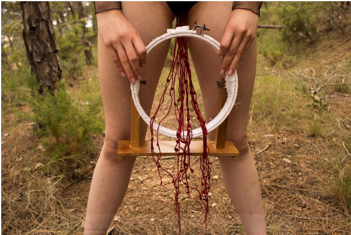
Fig. 18- Beatriu Marer, 2021. Significarse. Labor de aguja VII , confección textil.