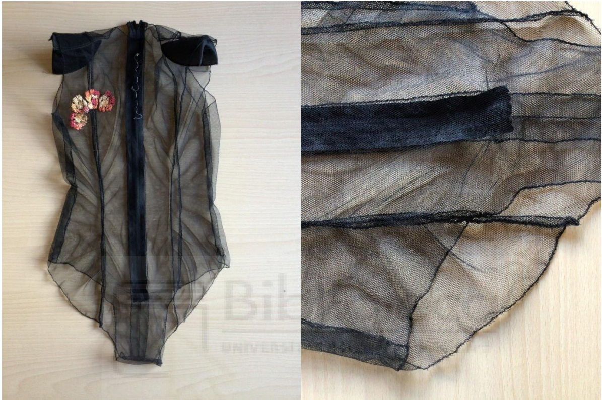
Fig. 8. Foto de taller, 2021. Significarse: labor de aguja.

Seguidamente, pasamos a la confección de las dos piezas textiles de las que parte nuestro proyecto. En este caso, utilizamos tul de algodón, que nos permite ver a través de él. Al mismo tiempo, destacamos la delicadeza y fragilidad de la tela utilizada.