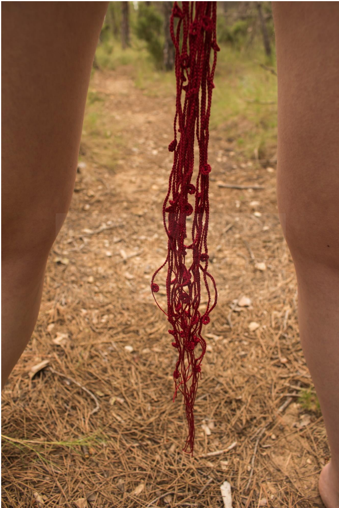
Fig. 16- Beatriu Marer, 2021. Significarse. Labor de aguja V , confección textil.