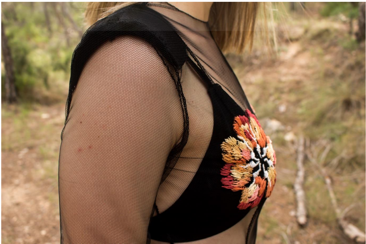
Fig. 13- Beatriu Marer, 2021. Significarse . Labor de aguja II, confección textil.