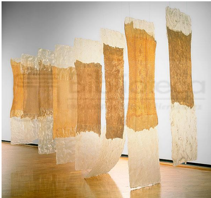
Fig. 1- Eva Hesse, 1968. Contingent , técnica mixta. Galería Nacional de Australia.

Encontramos en nuestro trabajo una gran influencia de Eva Hesse. En su obra, tiene muy presente el trabajo manual y el uso del textil, que toma forma de órganos sexuales y reproductivos, aparecen referencias fálicas y formas que nos trasladan al útero. De esta manera, Hesse establece una relación entre el trabajo hecho a mano y lo visceral (Torres, 2019).