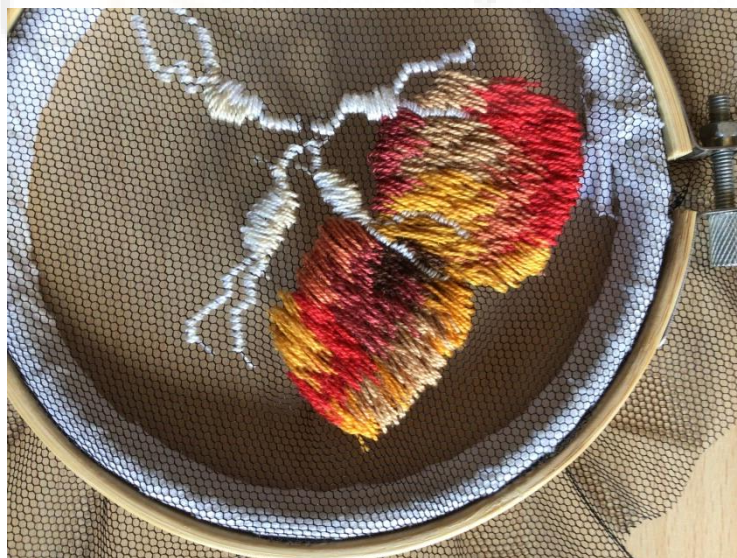
Fig. 6. Foto de taller, 2021. Significarse: labor de aguja.