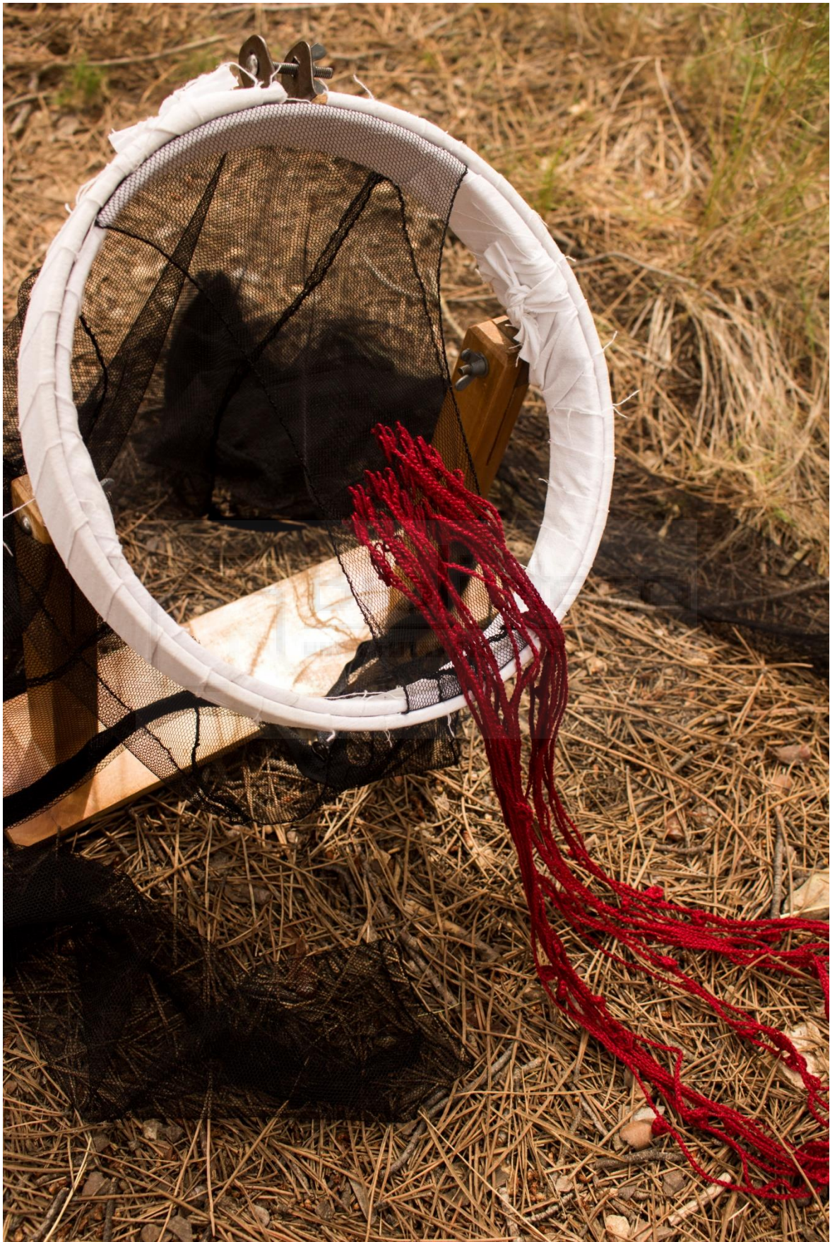
Fig. 17- Beatriu Marer, 2021. Significarse. Labor de aguja VI , confección textil.