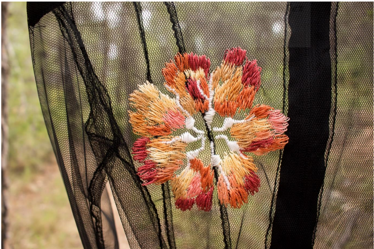
Fig. 15- Beatriu Marer, 2021. Significarse. Labor de aguja IV , confección textil.