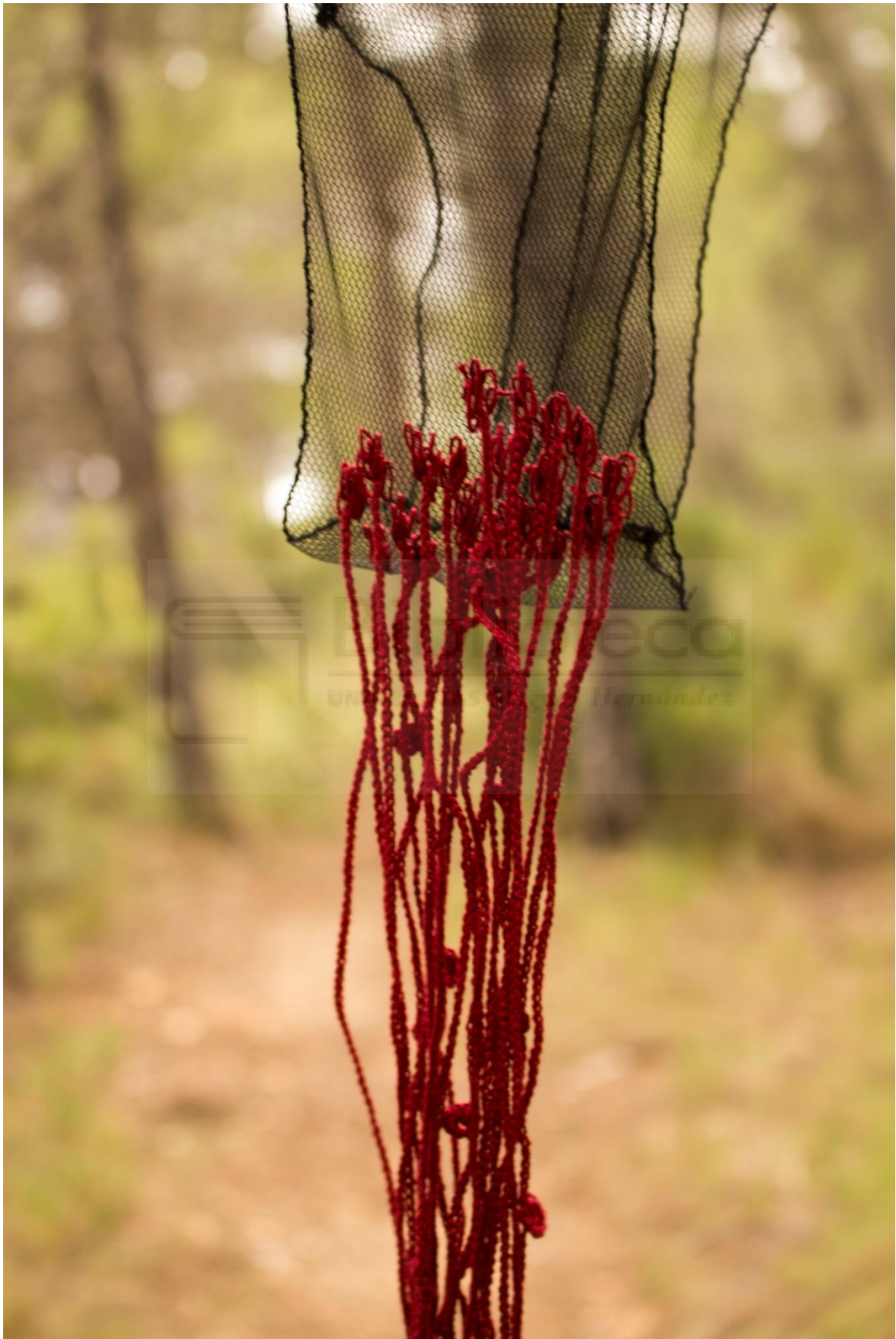
Fig. 20- Beatriu Marer, 2021. Significarse. Labor de aguja IX , confección textil.