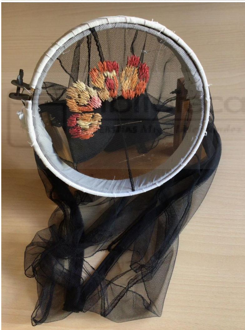
Fig. 10. Foto de taller, 2021. Significarse: labor de aguja.