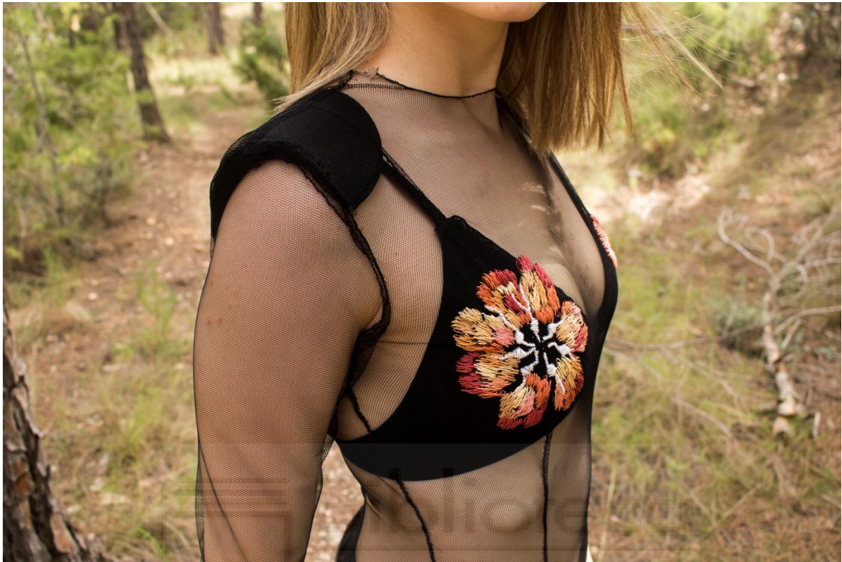
Fig. 12- Beatriu Marer, 2021. Significarse . Labor de aguja I, confección textil.