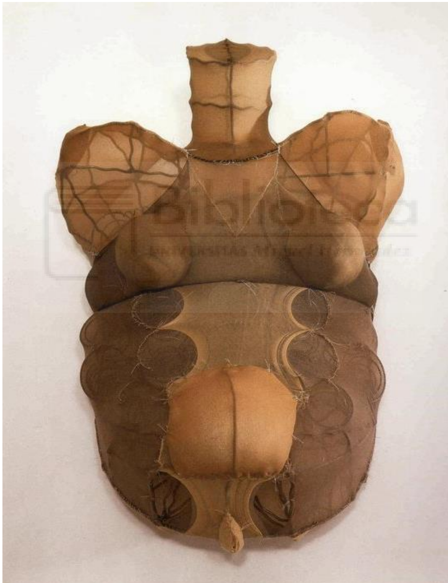
Fig. 2- Louise Bourgeois, Sin título , tela y acero. Colección Daros, Suiza.

La artista Louise Bourgeois piensa, por su herencia materna, en términos de tejer, pues su madre reparaba tapices. En repetidas veces ha definido las telas como la arquitectura que le devuelve a sus orígenes (Colomina, 2000). Genera además, superficies que nos recuerdan a la carne, habla desde las entrañas. De esta manera destruye el concepto de privado. Revela al público su vulnerabilidad y se expone a sí misma.