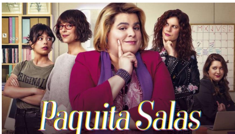
Figura 1. Imagen de la serie 'Paquita Salas'

catálogo 5 y actualmente posee los derechos exclusivos de la serie, desapareciendo de Flooxer. La segunda temporada se estrenó en Netflix el día 29 de junio de 2018, la tercera el 28 de junio de 2019, y no se descarta una cuarta.