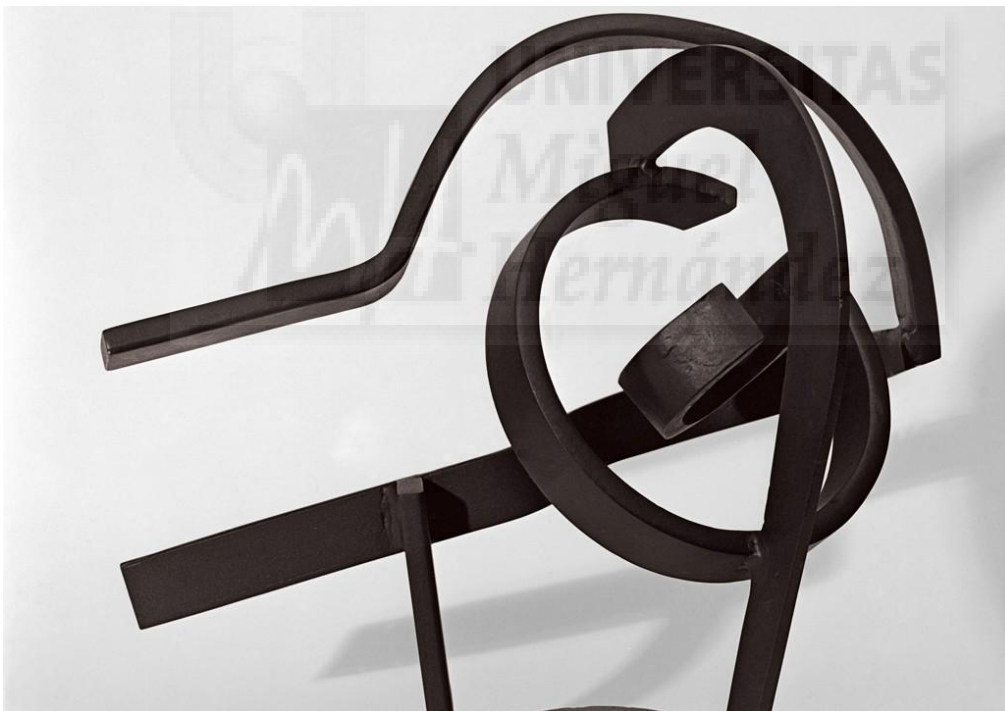
Figura 6. Jorge Oteiza. "Ensayo de la despreocupación de la esfera" 1958, acero forjado. 50x49x39 cm.