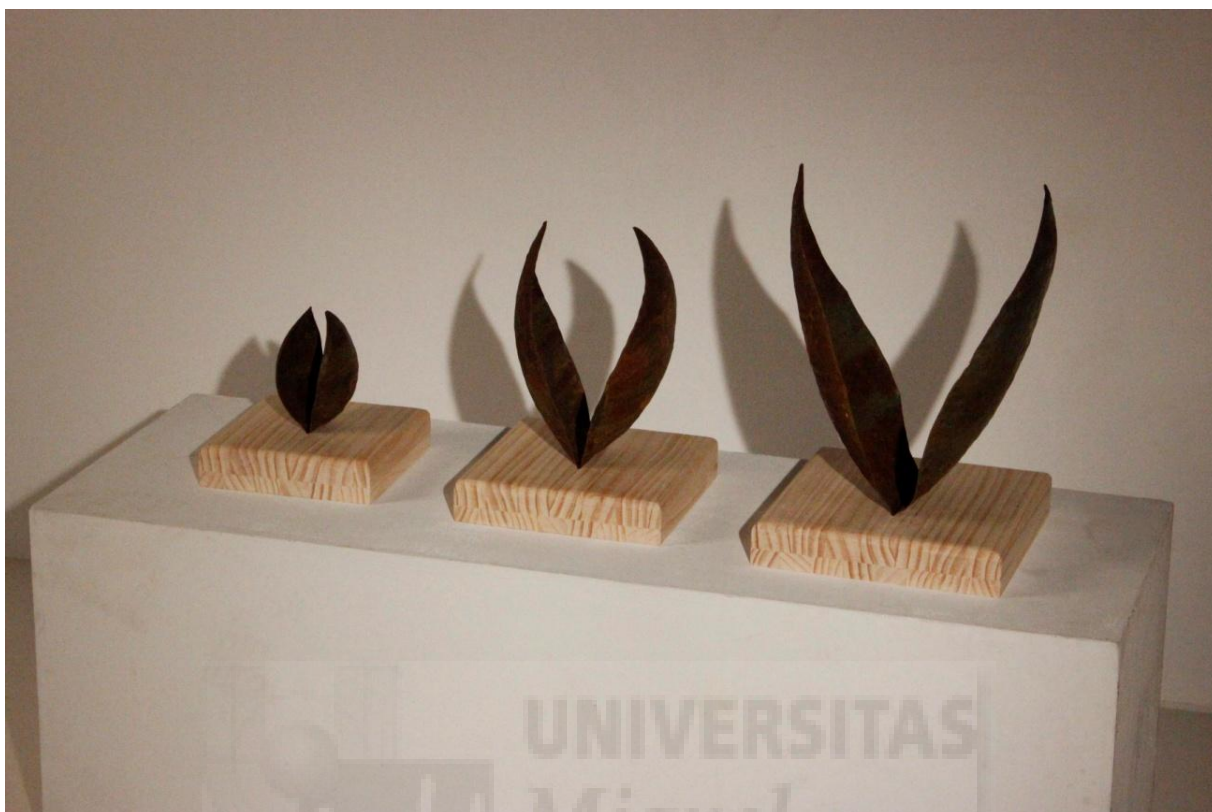
Figura 1. "Matrioska" 2015, repujado en hierro, 38.2x82.5x25 cm.