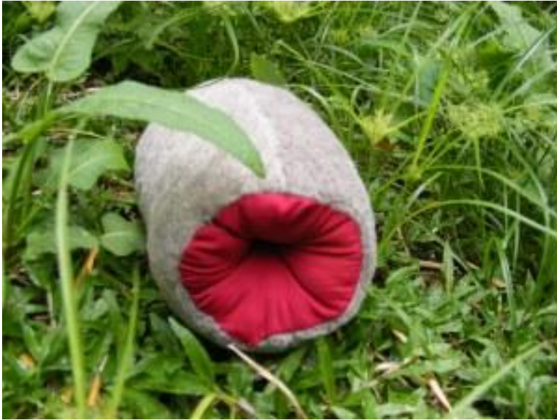
Figura 5. Paulina Velázquez. "Bulbos" 2013, técnica de patronaje y costura.