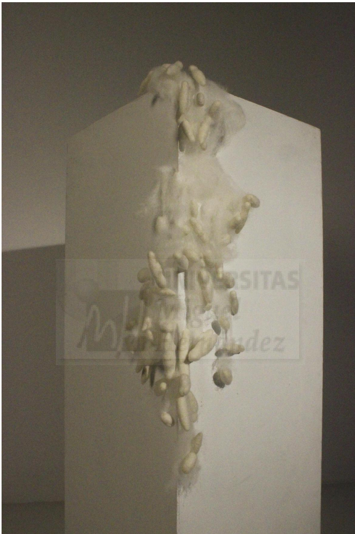
Figura 10. “Afieltrados” 2015 , modelado con lana de fieltro, medidas variables (77x22x4 cm)