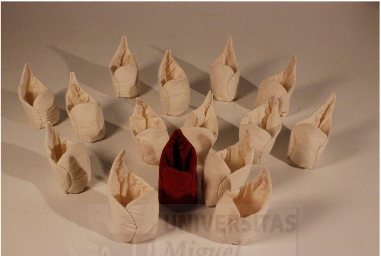
Figura 6 y 7. "Lilium" 2015, tela cosida con guata, medidas variables (35x120x112 cm)