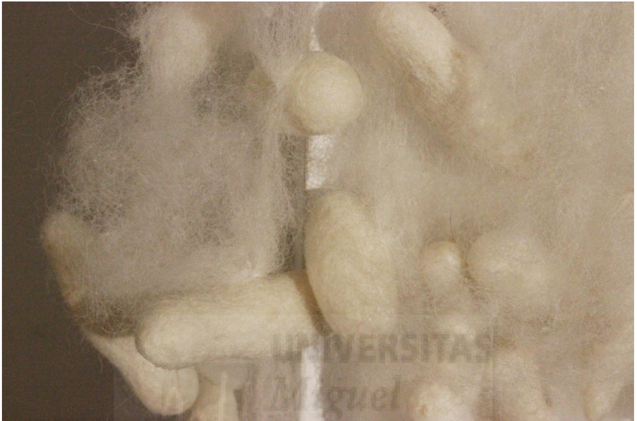
Figura 11 y 12. Detalle de las crisálidas