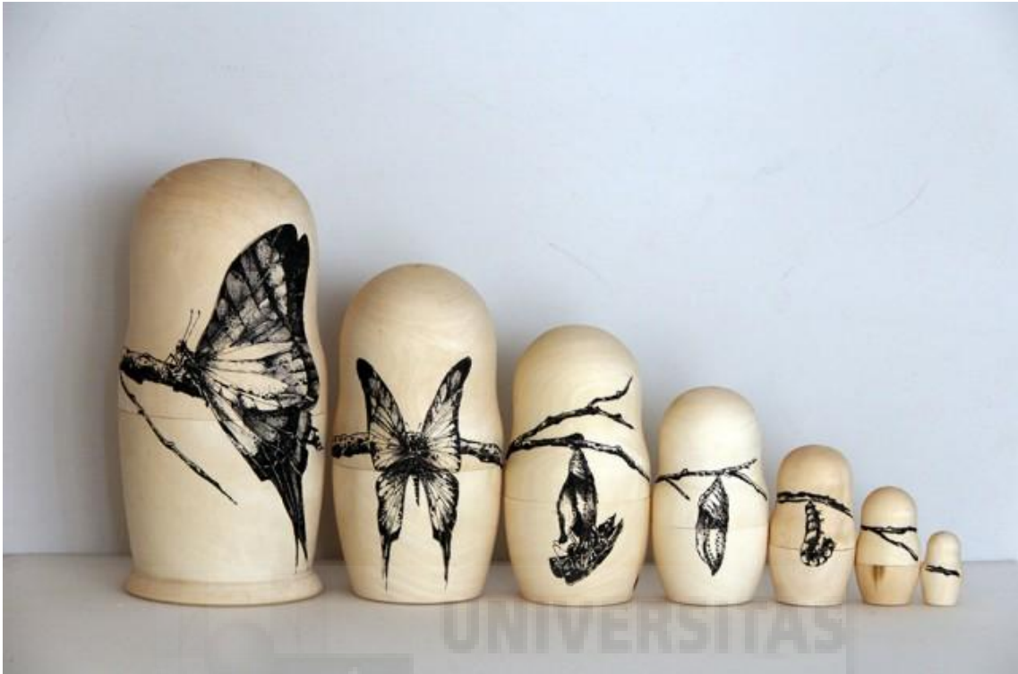
Figura 1. Raul del Sol. "Metamorfosis" 2012, técnica mixta rotulador sobre madera