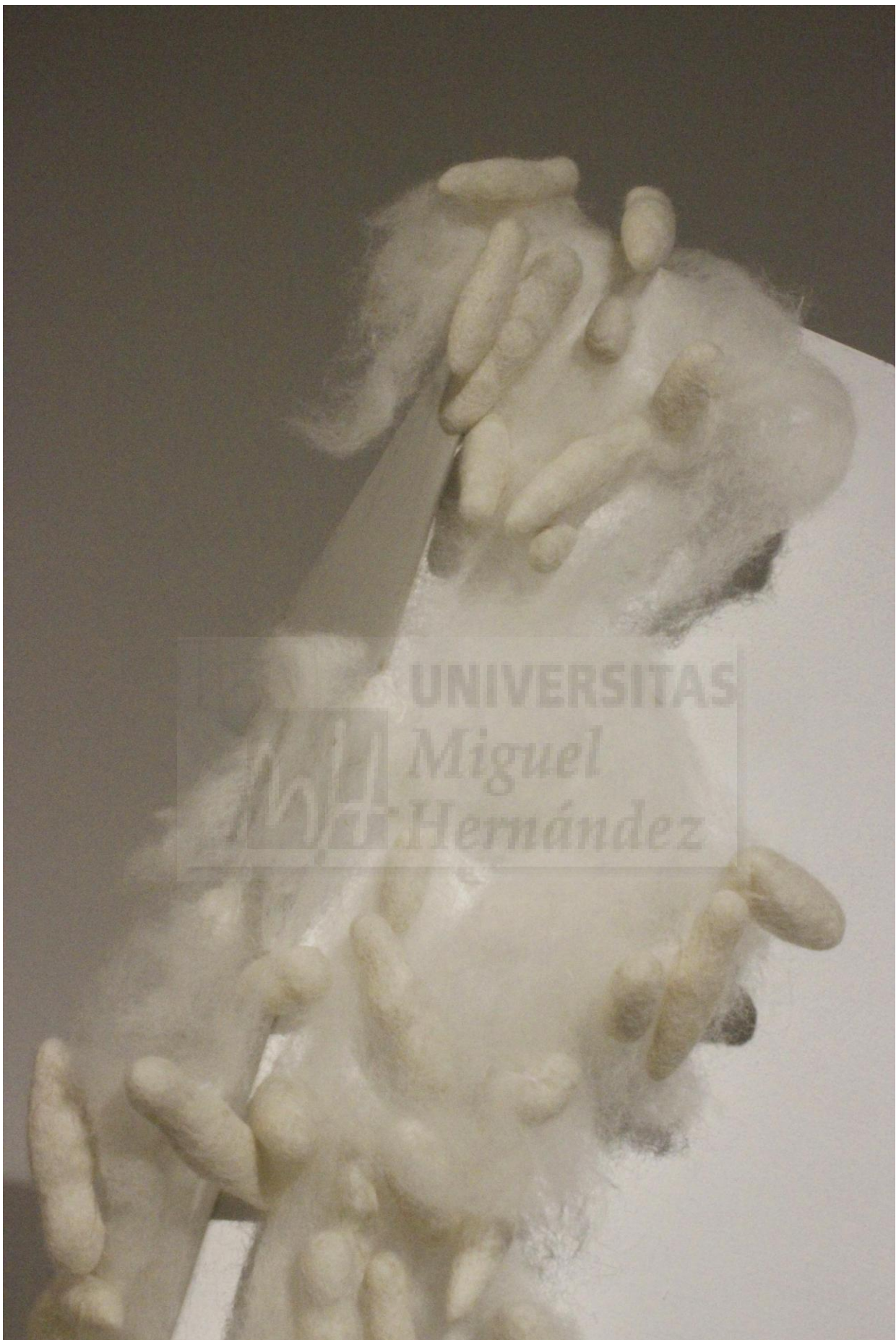
Figura 13. Vista en contrapicado.