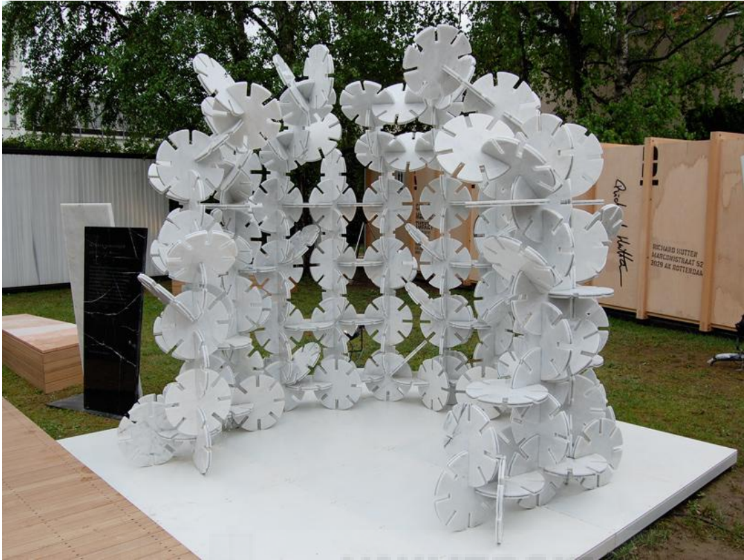
Figura 3. Judit Bellostes "Bosque de mármol" 2012 construcción en mármol.