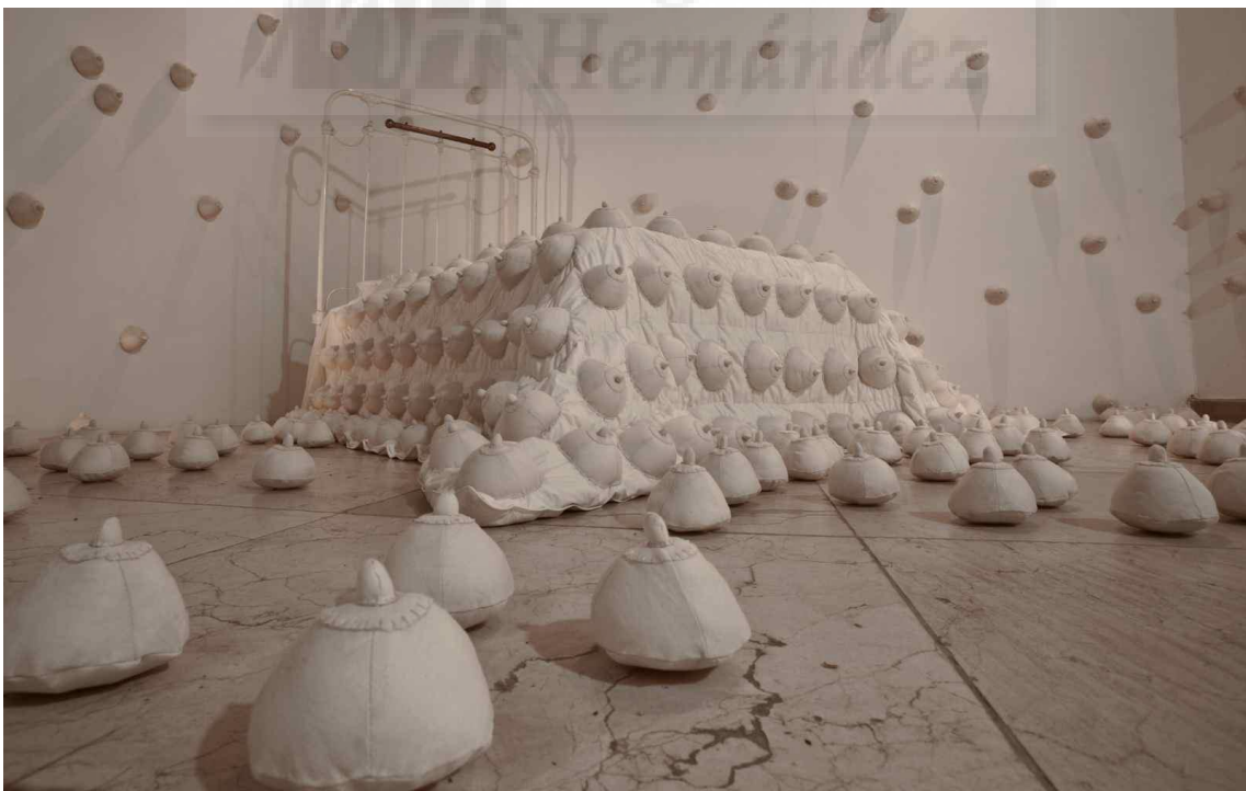
Figura 2. Raquel Paiewonsky "Inopia" 2012, técnica mixta con tela.