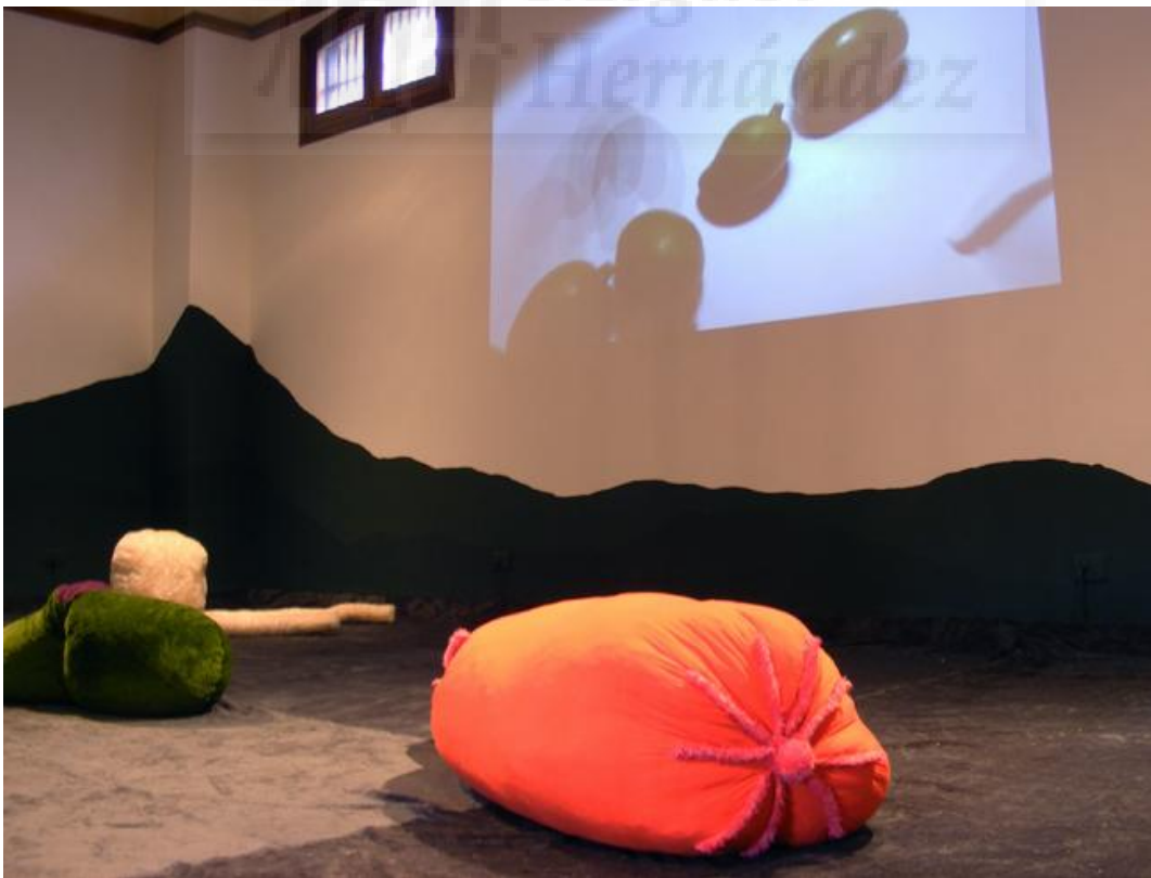
Figura 4. Paulina Velázquez. "RARO" 2011 Video instalación con elementos textiles.