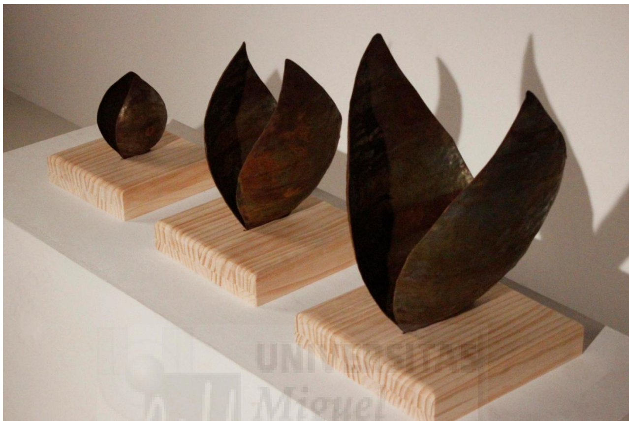
Figura 3 y 4. Otras vistas y detalles de "Matrioska"