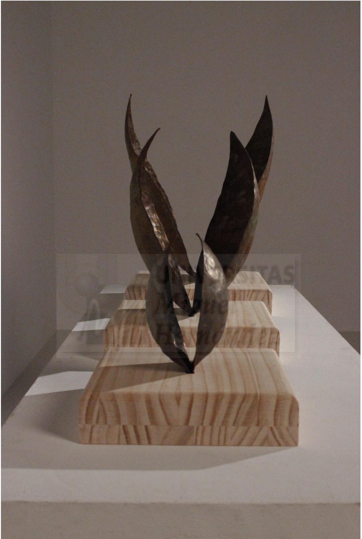
Figura 5. Vista lateral