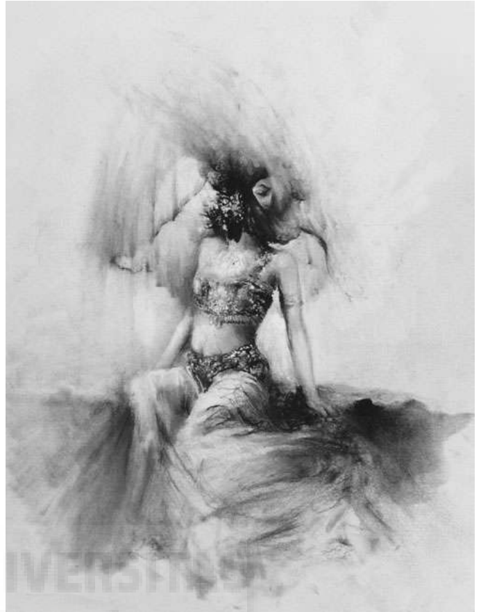
Fig.2 Quintana, D. Siren , 30 x 23cm. Carboncillo sobre papel vitela.