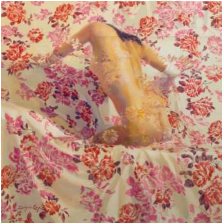
Fig.3 López, S. Devonensis , 46 x 46 cm. Óleo sobre lienzo