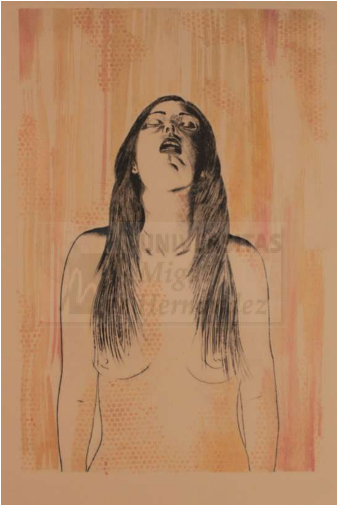
P.E. 3/3 Realidad Relativa , 2015, técnica mixta, 112x 76 cm