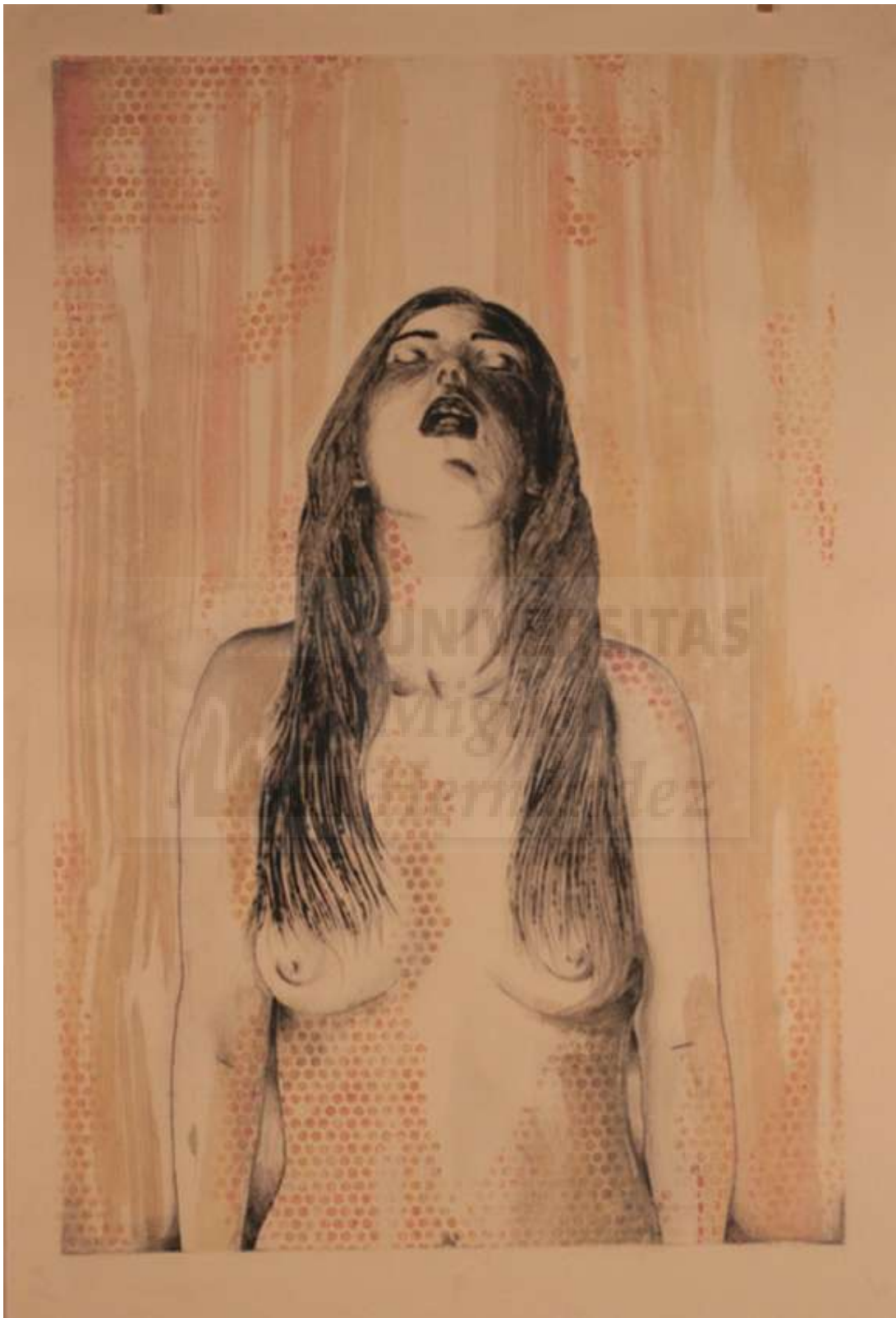
P.E. 2/3 Realidad Relativa , 2015, técnica mixta, 112x 76 cm