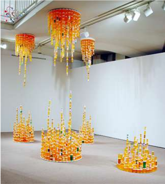
Fig.1 Sin, J. Chemical balance , 7 uds. de 46 x 96,5 cm de diámetro.