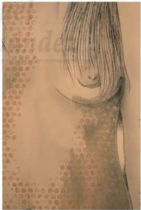
Detalles P.A. 1/1 Realidad Relativa , 2015, técnica mixta, 112x 76 cm