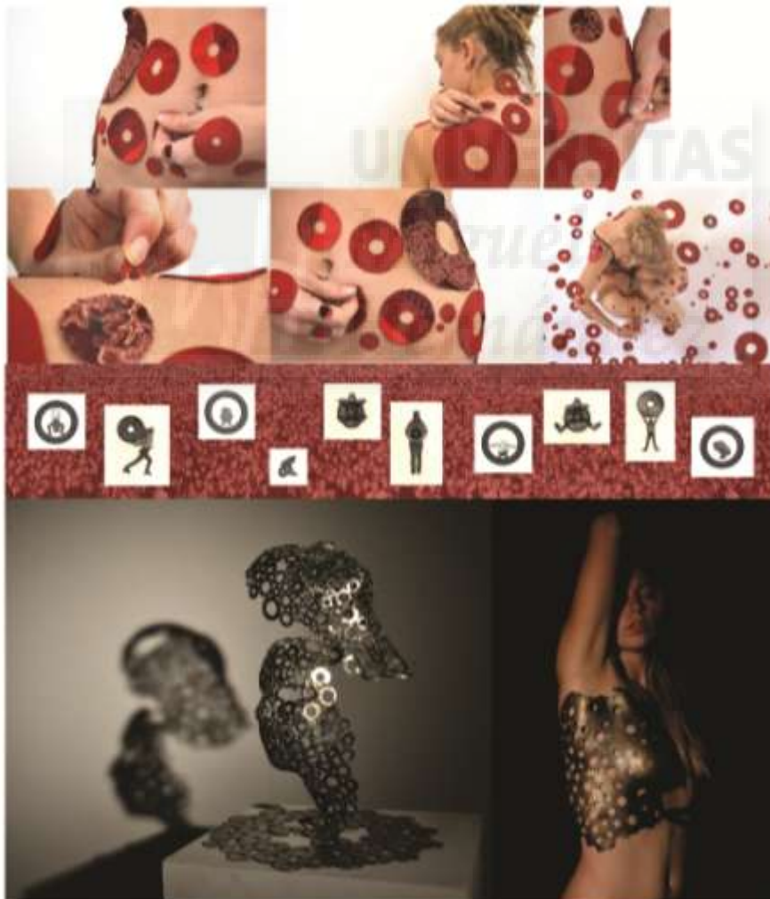
Fig.4 Serie Deconstruyendo lo supuesto : Desprendimiento , 2015, video performance, 3' 44"////// Montaña rusa , 2015, técnica mixta, 45 x 200cm. //// Giro inesperado , 2014, hierro, 50x 38x 38cm. //// Permanece , 2015, bronce fundido, 35x 20x 20cm.

Seguidamente empezamos a trabajar en un boceto nuevo (Fig.5), continuando con el planteamiento de la serie, empleamos un autorretrato, en este caso, acompañado por círculos.