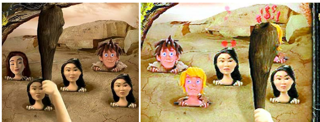
Figura 6. Mujeres y hombres en anuncios