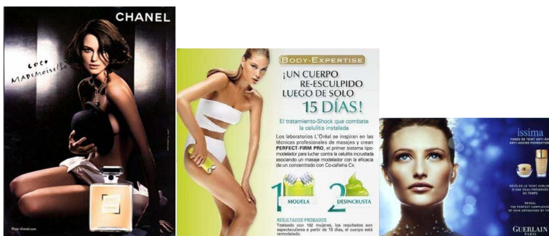
Figura 5. Mujeres en anuncios de cuidado personal