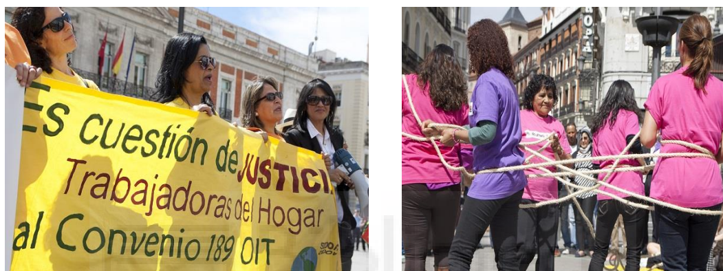
FIGURA 1: Acto Reivindicativo (Madrid)

La negación de la aprobación de la ratificación del convenio numero 189, las organizaciones, junto a los sindicatos se reúnen para organizar ciertos actos no formales de reivindicación de este colectivo como se ve que fue realizado en Madrid el Acto reivindicativo (Figura 1 fotos) con su principal objetivo de ratificación del convenio 189 de la OIT la cual se comprometieron antes del 2010 y el gobierno de España del Partido Popular no ha ratificado aún 20